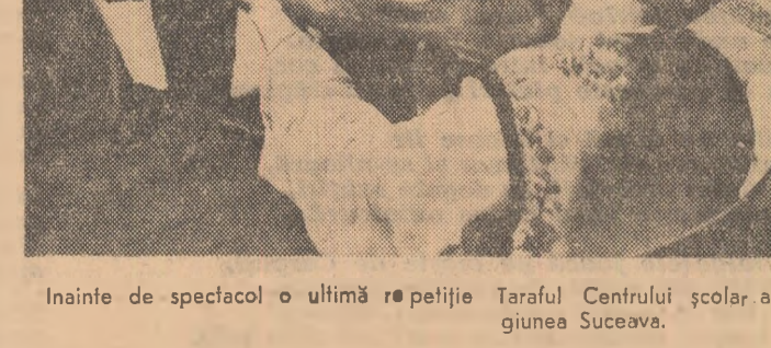
Înainte de spectacol o ultimă petiție Tariful Centrului școlar agricol din Comuna Șindriceni, regiunea Suceava.