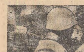
Japonia: Aspect din timpul unei demonstrații din recentele demonstrații ale minerilor japonezi pentru condiții mai bune de muncă, împotriva politicii guvernului de concediere în masă a muncitorilor din industria cărbunelui. La această demonstrație au participat peste 200000 de mineri veniți cu acest prilej la Tokio

Lucrările celei de a XII-a sesiuni a Conferinței generale UNESCO continuă. Comisia de program discută activitatea culturală, iar o subcomisie, special instituită, analizează problemele legate de activitatea Departamentului de educație UNESCO.