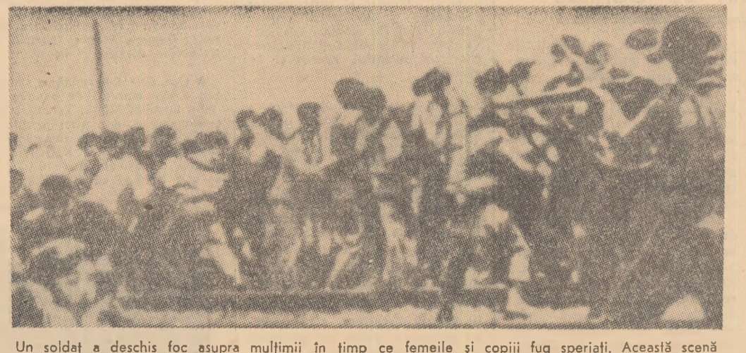
Un soldat a deschis foc asupra mulțimii în timp ce femeile și copiii fug speriați. Această scenă tragică a avut loc recent la Santiago de Chile în timpul unei demonstrații muncitorești însoțite de familiile lor. Poliția și armata a intervenit în mod bestial ucigînd și rănind mai multe persoane

Referindu-se la comunicatul dat publicității după această primă lustră de contact dintre reprezentanții celor două partide, agenția France Presse relatează că ele nu au dus la realizarea niciunui acord, dar că tratativele vor continua.