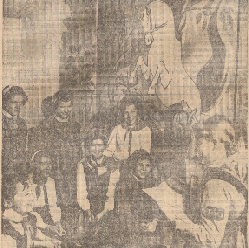
În camera basmelor, la Casa Pionierilor din Oradea