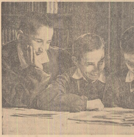
Viitorii mecanizatori agricoli își consacră adesea orele libere cărților de literatură, revistelor, albumelor. În fotografie: la biblioteca Școlii de mecanici agricoli din Botosani.

La lecțiile ținute de majoritatea studenților, predarea a corespuns nivelului programelor și sarcinilor educației comuniste, iar elevii au dobândit cunoștințe temeinice legate de activitatea practică.