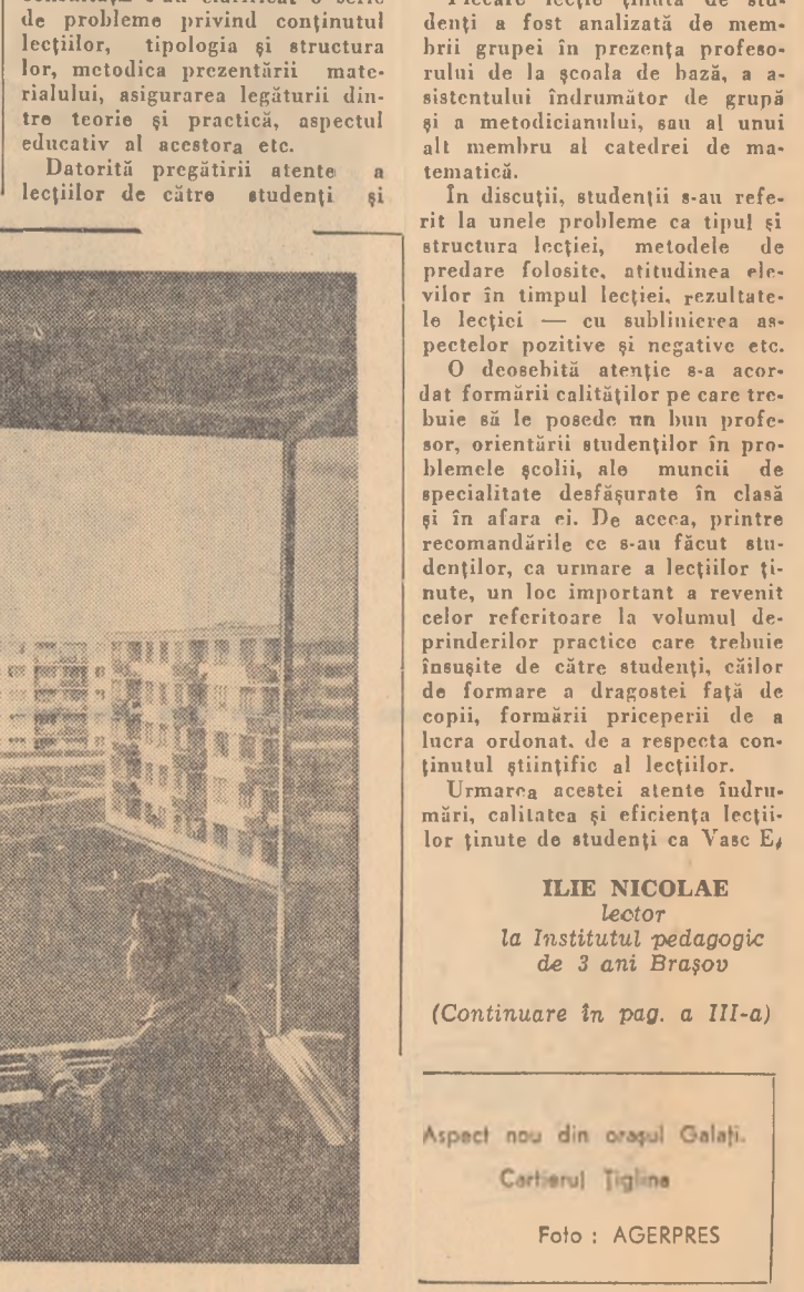
Aspect nou din orașul Galați. Cartierul Țigline

Stațiunile de mașini și tractoare din regiunea Iași au luat din timp măsurile pentru ca lucrările de reparație a tractoarelor și mașinilor agricole să se desfășoare în bune condiții.