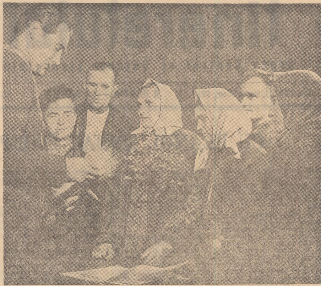
Ora de curs s-a terminat. Cîțiva colectivști înșă explicații suplimentare. Lectorul cercului pentru cultura plantelor de cîmp de la gospodăria colectivă din Negrești, raionul Oaș, răspunde fiecăruia în parte, folosînd și de data acesta material intuitiv

T. OANCEA corespondentul „Științei Tineretului” pentru regiunea Galati