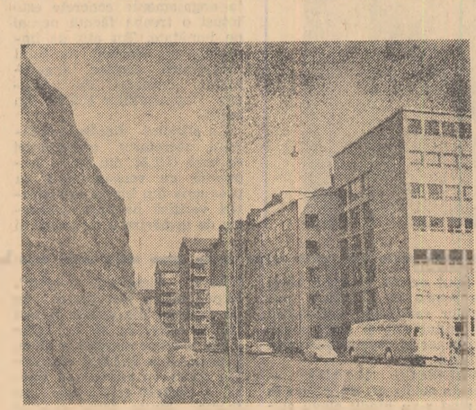
Printre clădiri, granitul erupe pe străzile orașului Helsinki, dîruind peisajului o frumusețe puțin obișnuită.

robabil, într-o clipă de inspirație, anonimul fîur de poezie a denumit-o „țara celor o mie de lacuri”. Statisticienii s-au declarat nemulțumiți: ei preferă limbajul riguros al cifrelor, care certifică existența a „60.000 de lacuri. Drumetii pe meleagurile finice, mînturisec că n-am fost tentat să verific exactitatea „recifictărilor” solicitate de către specialiștii cifrelor. În schimb, pe pelicula memoriei am înregistrat superbe peisaje care se desenează pe ogîndă lăcnoasă a ochiurilor de apă ce rîsar pretutindeni printre siluetele suple ale comitelor și masivele stînci roștice. Imaginea — limitată de porțiunile unei ferestruce de avion — care mi s-a dezvăluit iniția oară în vreme ce navele noastre aeriene se pregăteau să aterizeze la Helsinki, am regăsit-o multiplicată cu o umitoare fanazie de acel genial creator de frumusețe care este natura. Pămîntul pe care s-a născut „Kalevala”, pe care Sibelius l-a cîntat cu discretă gingășie iar Aleksis Kivi l-a zugrăvit cu forța realismului, pămîntul acesta cu orașele, casele și oamenii săi și se înfățișează învîluit de o atmosferă neobișnuită, tuburătoare, ca într-una din străvechile rume ce glorifică pe vîntozul Väinämöinen. Prima noastră cunoștință a fost Helsinki, oraș clădit pe stîncă și prins în strînsura apei și pădurii. Liniștia capitală finlandeză, străzile ei cu coloritul arămiu, oșezarea un decor înedit plantat în lumea, ireală parcă, a zilelor