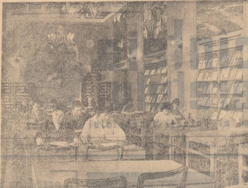
Vedere generală a noii săli de lectură a publicațiilor periodice de la Biblioteca centrală universitară din București.