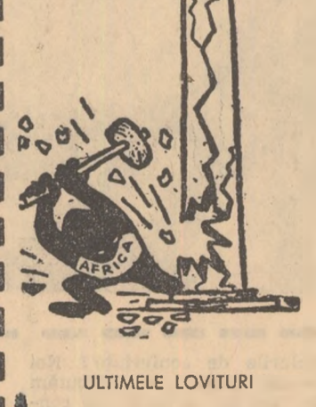
ULTIMELE LOVITURI Din „Voice of Africa” (Accra)