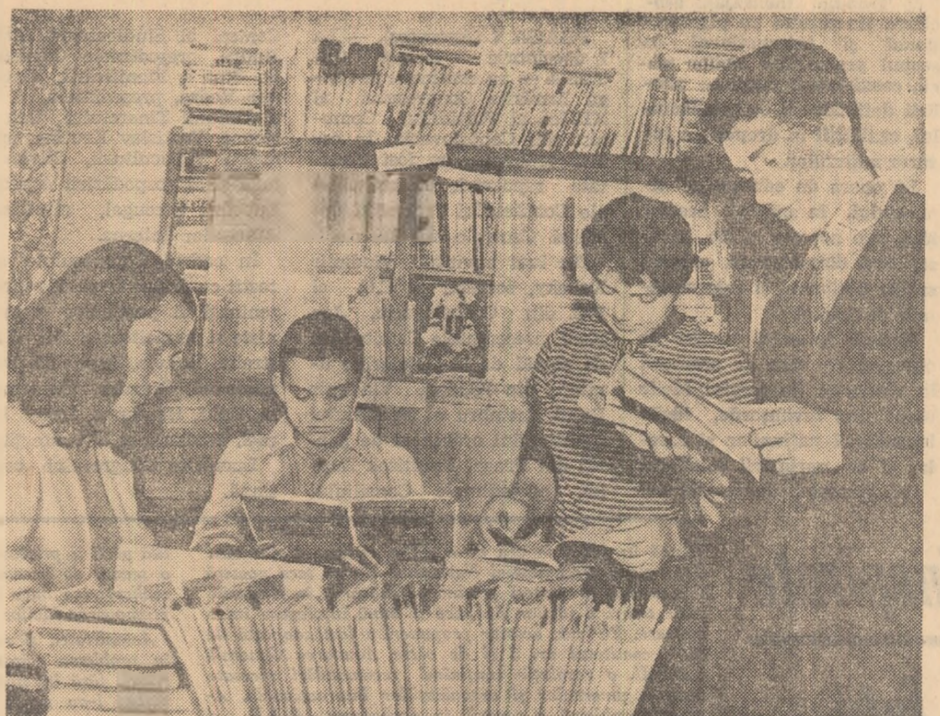
La biblioteca clubului „23 August” din Ploieşti au sosit cărţi noi. Cititorii îşi aleg...