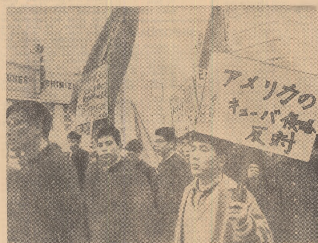
Demonstrație la Tokio a studenților japonezi împotriva politicii anti-populare a guvernului.