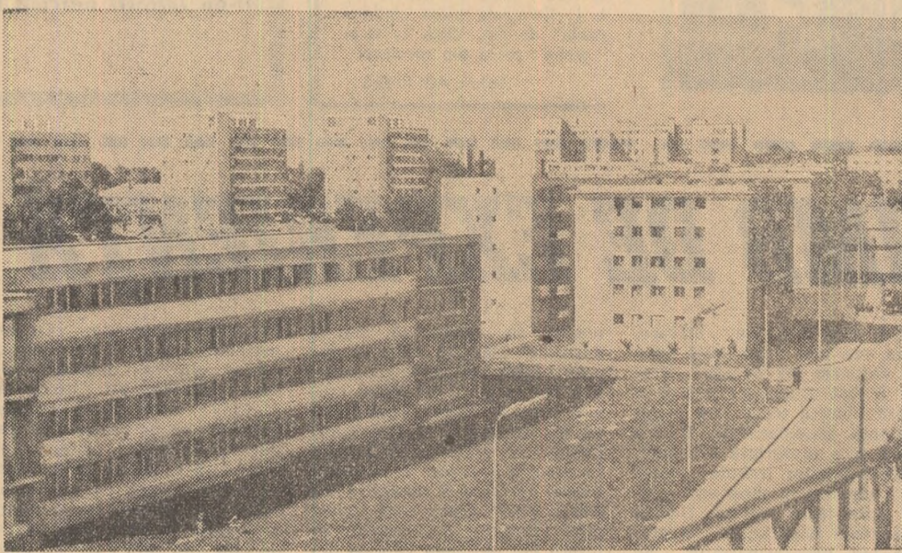
Bătrînul Iași întinereste