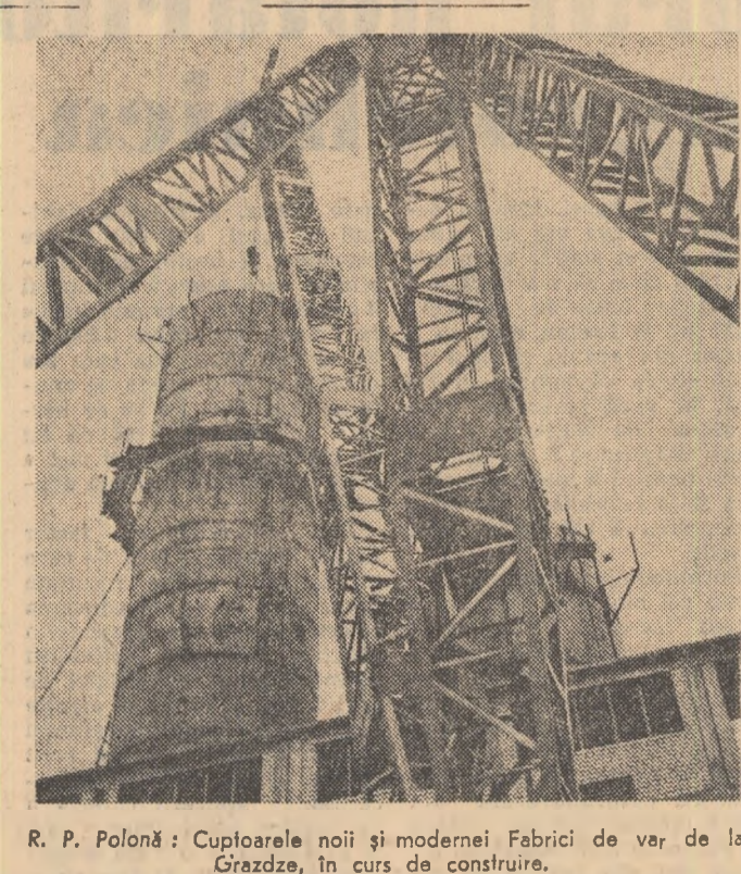
R. P. Polonă: Cuploarele noi și modernei fabrici de var, de la Grzędze, în curs de construire.

GENEVA 14 (Agerpres). — La seșința din 14 decembrie a Comitetului celor 18 state pentru dezarmare s-a hotărât ca lucrările Comitetului să fie întrerupte între 21 decembrie 1962 și 15 ianuarie 1963.