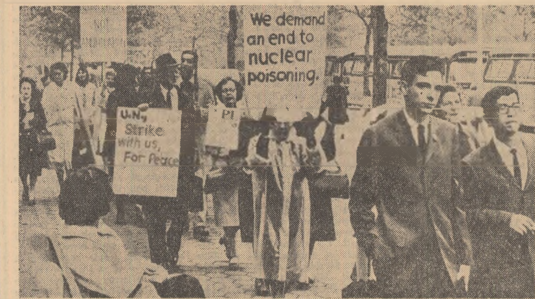
Aspect de la o recentă demonstrație pentru pace și dezarmare, demonstrație care s-a desfășurat în fața sediului O.N.U. de la New York.