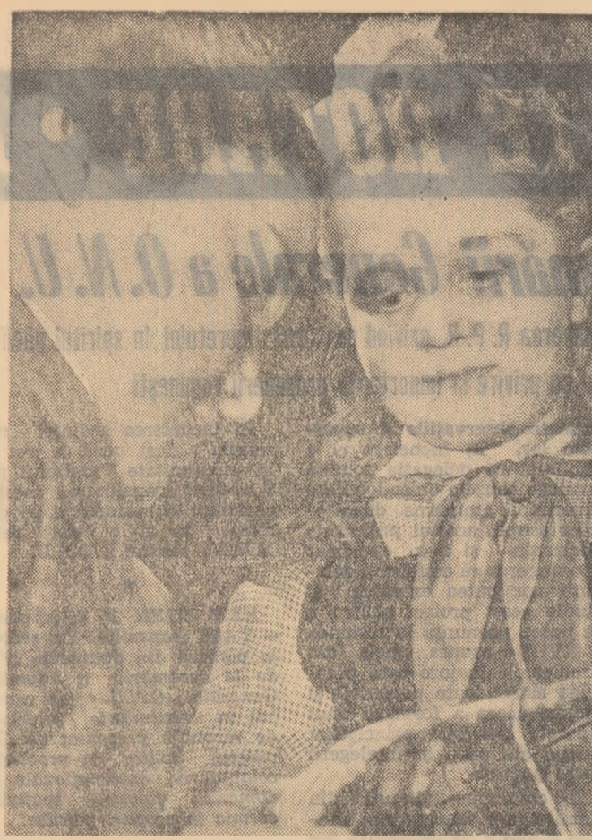
O „consultajie” pe tema... tricolorului. Pionierii pe care le vedeți în fotografie sînt membre ale cercului „mîini îndemnitice” de la Casa pionierilor din Galați.