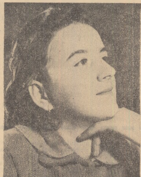
Să trăiesc și să muncesc astfel, încît întotdeauna să pot ține fruntea sus, ca astăzi.