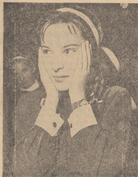
Vai, ce de lume a venit să mă sărbătorească!