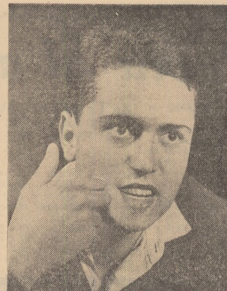
Tot ce se spune aici privește viitorul nostru...