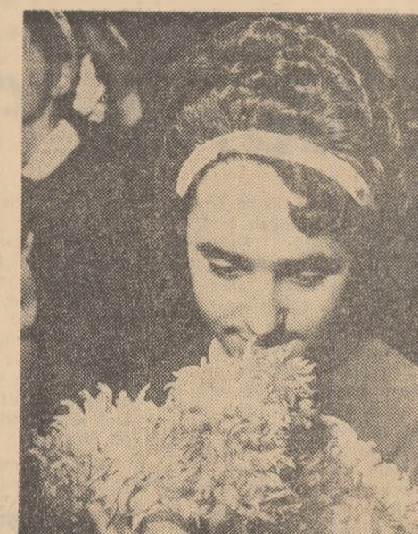
Vor trece ani, parfumul crizantemelor va stîrui mereu pentru ea.