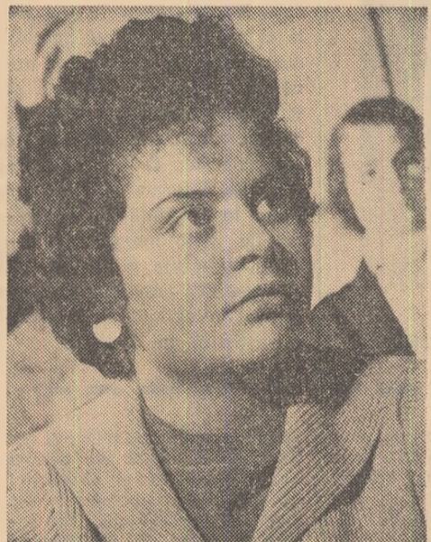
Da, voi înfîptui cu siguranță idealurile vieții mele!