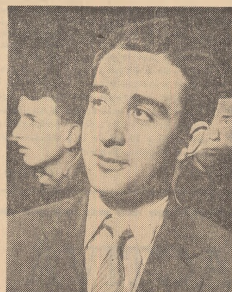
Desigur, laudele ne fac multă plăcere, dar să ne vedem la treabă.