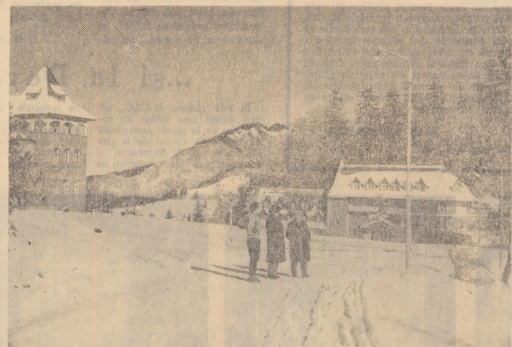
Stajunea Piriul Rece, investimîntă în haină de nea.