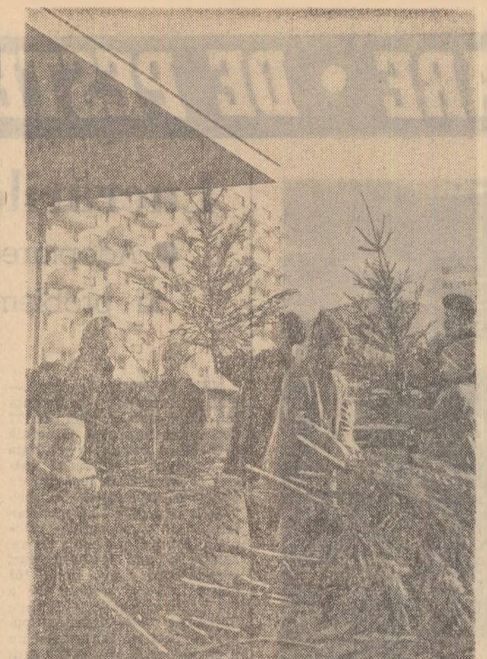
Pregătirile pentru Anul Nou sînt în toi. În piața „1 Mai” din Capitală, au fost puși în vinzare pomi de lămăie.

Este drept că această muncă complexă cere timp și posibilități de desfășurare. Poate că emisiunile de muzică distractivă ar trebui programate în funcție de răgazul convenit repetițiilor și eventualilor imbuștățiri pe parcurs. Poate că ar trebui luat în discuție faptul că în prezent un număr foarte restrîns de oameni calificați se ocupă cu organiza-