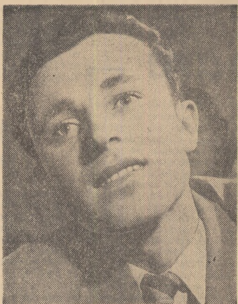
Totul e prin viață să treci ca metalul incandescent, să poți răspunde mereu: „Sînt prezent!” — la opșteprece ani — și la șizeci.