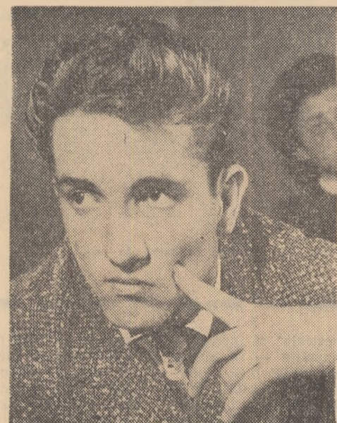
Tot ce rostesc aici tovarășii mă îndeamnă să mă gîndesc: Sînt eu destul de exigent cu mine însumi?