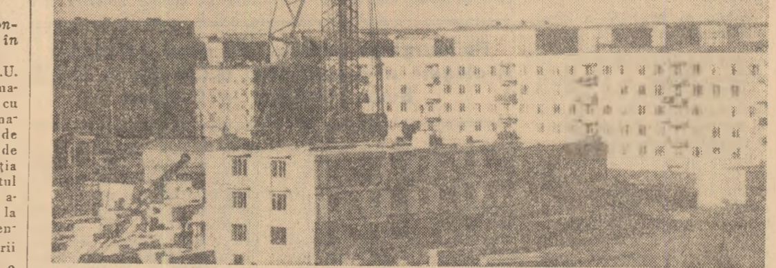
Moscova: în fotografie, pe unul din șantierelor de construcție a noilor locuințe din Novaya Loukinne din Moscova.

Proiectul de rezoluție cere autorităților portugheze să înceteze imediat orice acțiuni represive împotriva poporului angolez, să elibereze deținuții