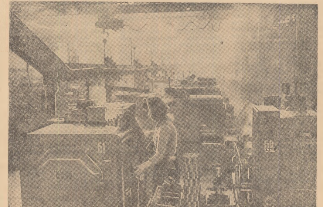
U.R.S.S.: Aspect al unei linii automate din cadrul uzinei de rulmenți din Sarofov care produce în 24 de ore pînă la 14 000 de inele de rulmenți. Uzina dispune de aproximativ 50 de linii automate în flux.

● LONDRA. Un grup de parlamentari laburisti și oa-