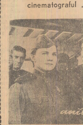
Tovăstia anilor înflăcărați