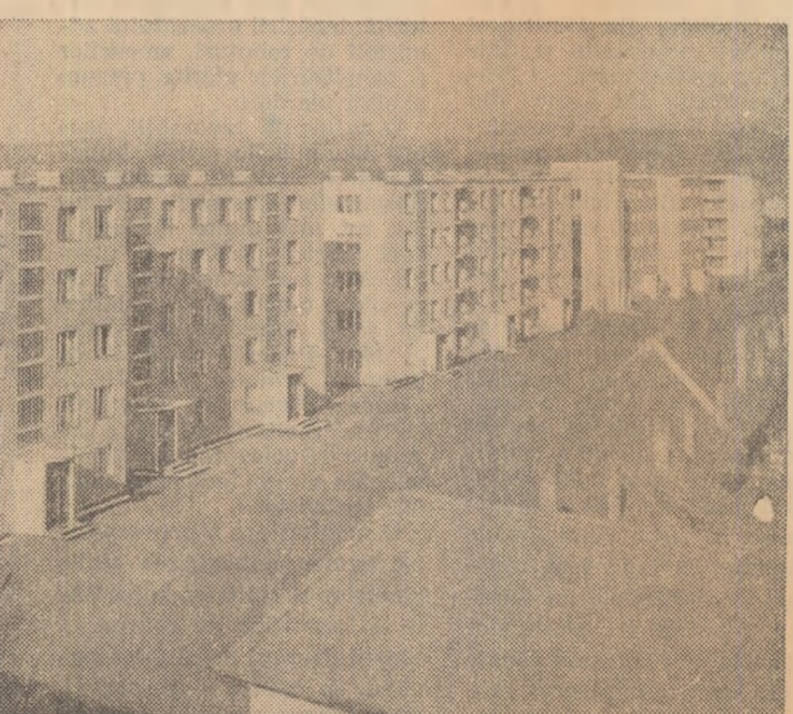
Construcțiile noi înfinesc și peisajul vechiului Sibiu.

în prezent școlile culturale închinată celei de-a 15-a aniversări a Republicii. Sute de formații de artiști amatori străbat cu cîntecul și jocul comuncle și satele regiunii.