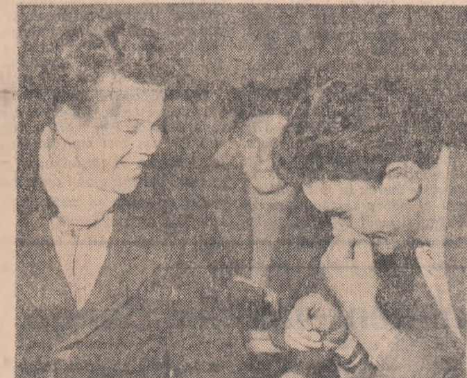
Ori îți faci autocritica și-ți analizezi munca așa cum trebuie, ori nu mai face lumea degeaba să ridă...

c) Vom înființa, pînă la sfîrșitul lunii aprilie, două posturi utemiste de control (unul în sectorul vegetal și unul la sectorul zootehnic) care vor organiza periodic rînduri în urma cărora vor face propuneri concrete privind îmbunătățirea activității tinerilor în producție.