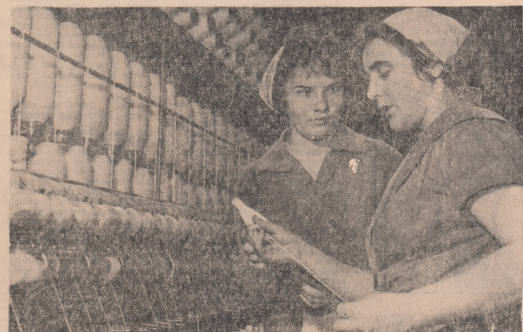
Discuție despre calitate în secția filatură a Uzinelor textile din Timișoara.