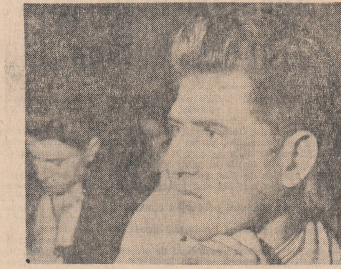
Lucrurile astea le-am mai auzit. Dar iată că acum cînd se vorbește despre munca noastră pe concret — limpede ce avem de făcut...