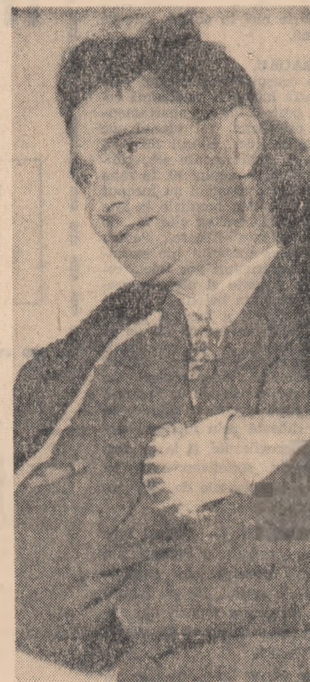
Ce băieți buni avem! — gîndește prezidinte. E destul să le dai o idee, să-i ajuți, și sînt gata să facă minuni...

— Mai am ceva de zis. Eu lucrez la oi. Se apropie perioada fătărilor. Prin unificarea gospodăriilor a crescut numărul oilor și nu prea avem adăposturi așa cum ar trebui. Trebuie ca în cel mai scurt timp să improvizăm un adăpost din stuf și papură cu grădele de