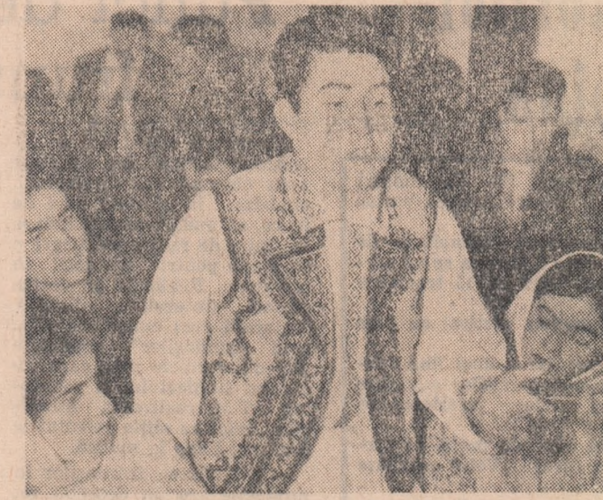
Acum ne-am unificat cu gospodăria din Tâtarca. Deci sîntem două sate. Să facem o echipă artistică șlăncioasă, să nu ne-o mai ia înîntele cei din Frumușuța...