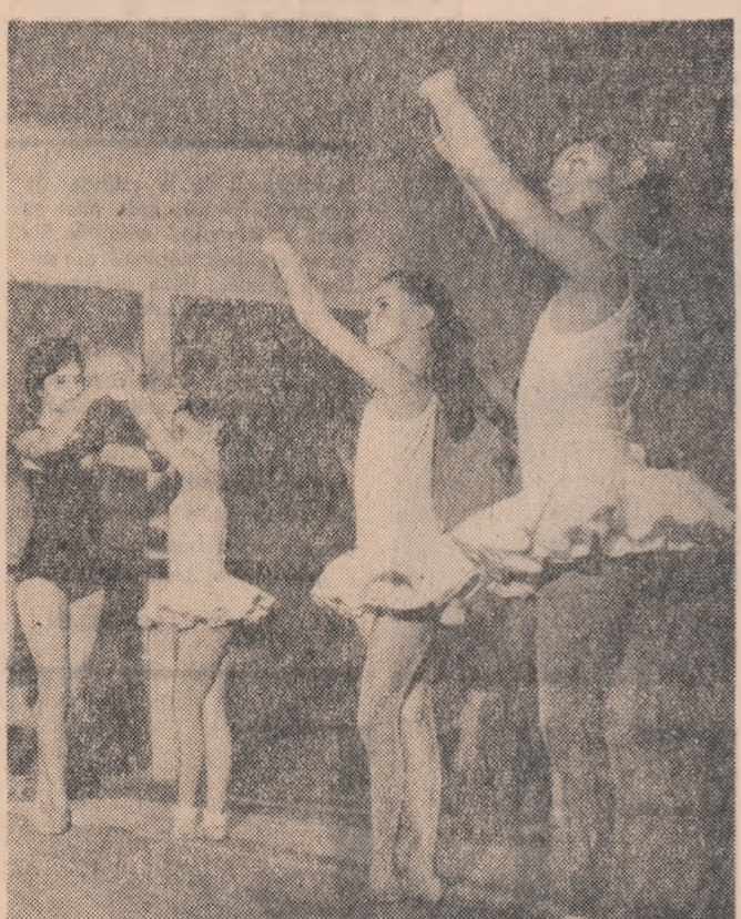
„Micii balerini” învăț (Cercul de balet al Școlii populare de artă din Brașov).