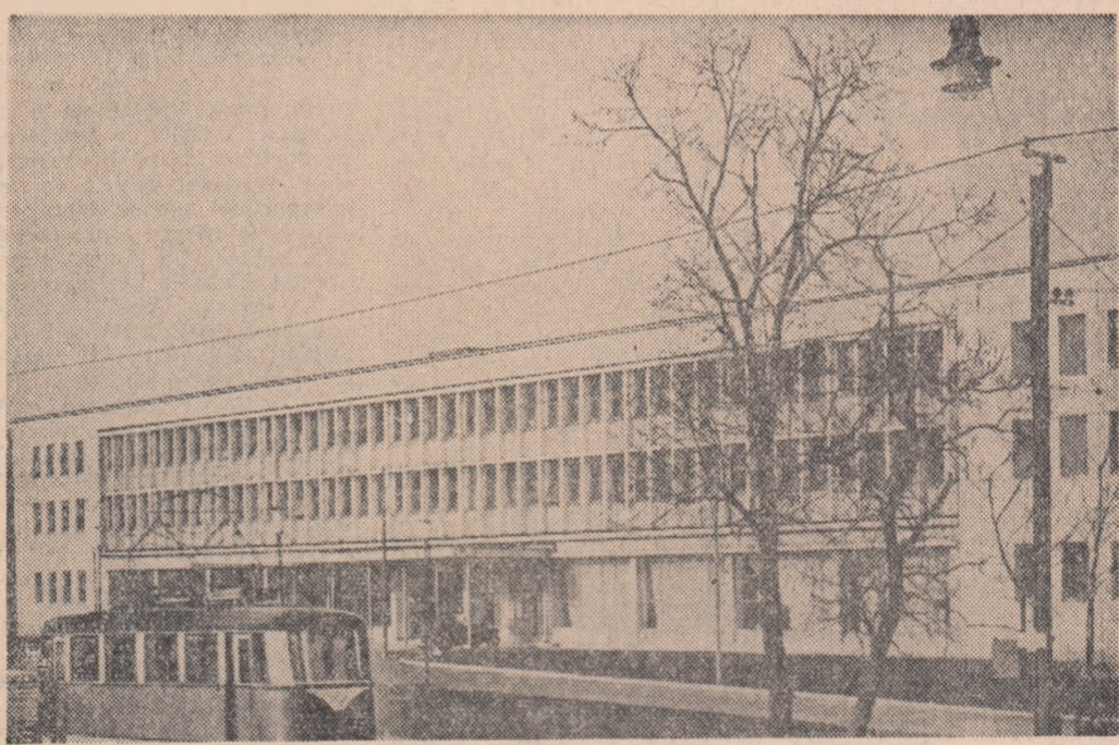
Vederea a noii fabrici de mobilă din Arad.

Aceste angajamente și altele, vor fi cuprinse în planul de muncă al organizației U.T.M.