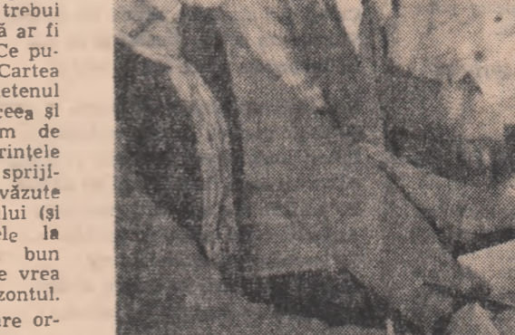
„Iată, aceasta este bibliografia... De fiecare dată membrii comisiei stau de vorbă cu tinerii care doresc să participe la concursul „Iubiți cartea”.

Mai interesantă și mai potrivită pentru crearea unei atmosfere de dezbateri ne s-a părut totuși una dintre recenzii