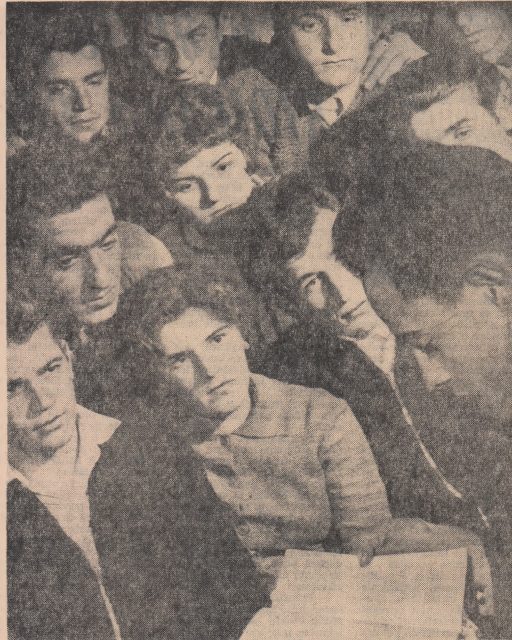
Seară literară. După primele file, tinerii se și simt cuprinși în atmosfera întîmplărilor din carte.

PORNIND DE LA ÎNTREBĂRILE DE MAI SUS, BIBLIOTECARA ISTORISÎ APOI ACESTE: