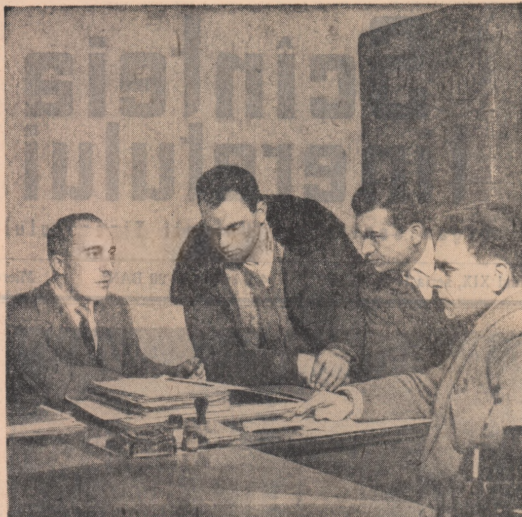
Curînd, mecanizatorii de la S.M.T. Grădiștea, regiunea București, vor pleca spre gospodăriile colective pe ale căror ogare vor lucra. Interesul pentru cunoașterea amănunțită a planului de producție îi aduce, în aceste zile, pe mulți șefi de brigadă în biroul directorului sau al inginerului mecanic.