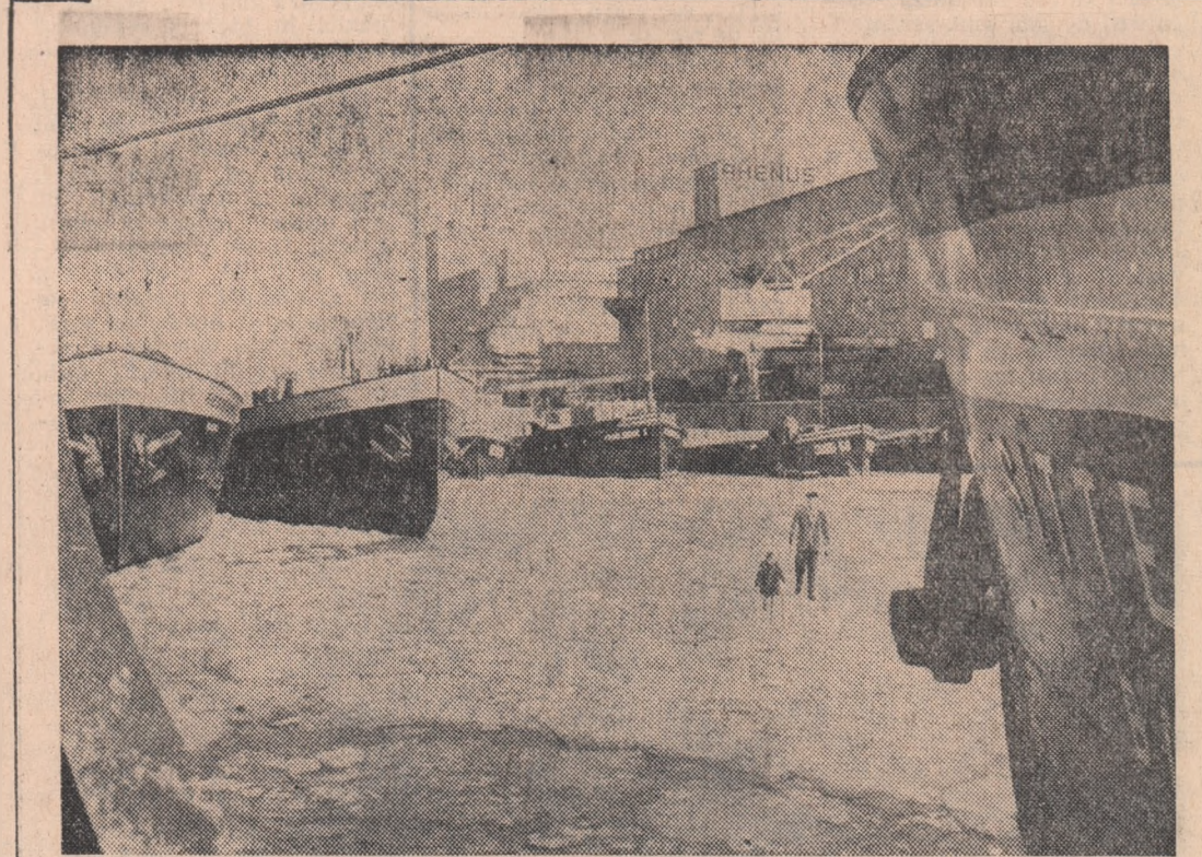
Apele Rinului au înghețat cu desăvîrșire la Basel (Elveția) așa cum se vede și din fotografie, navele au fost immobilizate de ghețuri.