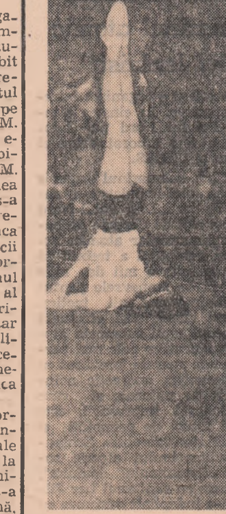
O imagine de la întrecerile feminine de gimnastică disputate duminică în sala Floresca în cadrul finalei „Cupei orașului București”.

Ultima problemă, dar nu și cea mai puțin importantă, cuprinsă în programul de pregătire a cadrelor U.T.M. de la sate, s-a referit la întărirea vieții interne de organizație. Expunerea pe această temă a urmărit să lămurească cât mai bine sarcinile ce revin comitetului U.T.M. pe comună, comitetului organizației de bază U.T.M. pe G.A.C. și birourilor