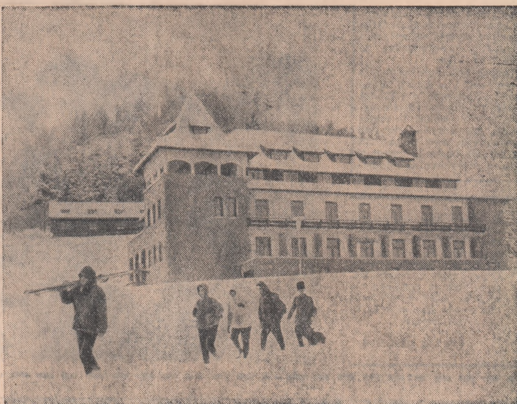
În excursie la Piriul Rece.