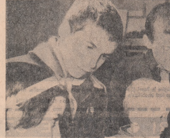
La cercul de foto și Casel pionierilor din Galeți

Ultima problemă, dar nu și cea mai puțin importantă, cuprinsă în programul de pregătire a cadrelor U.T.M. de la sate, s-a referit la întărirea vieții interne de organizație. Expunerea pe această temă a urmărit să lămurească cât mai bine sarcinile ce revin comitetului U.T.M. pe comună, comitetului organizației de bază U.T.M. pe G.A.C. și birourilor