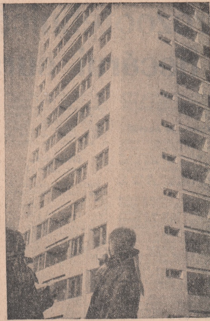
Unul din noile blocuri din cartierul Floreasca. Prin folosirea cofrajelor glisante s-a scurta termenul de darea în folosință, realizîndu-se și importanța economică.

Calitatea unei șarje de fontă se asigură printr-o supraveghere continuă, la fel pe prim-furnalul Adam Fritz, lund o probă în timpul unei șarje la furnalul nr. 2 al Combinatului Siderurgic Reșița.