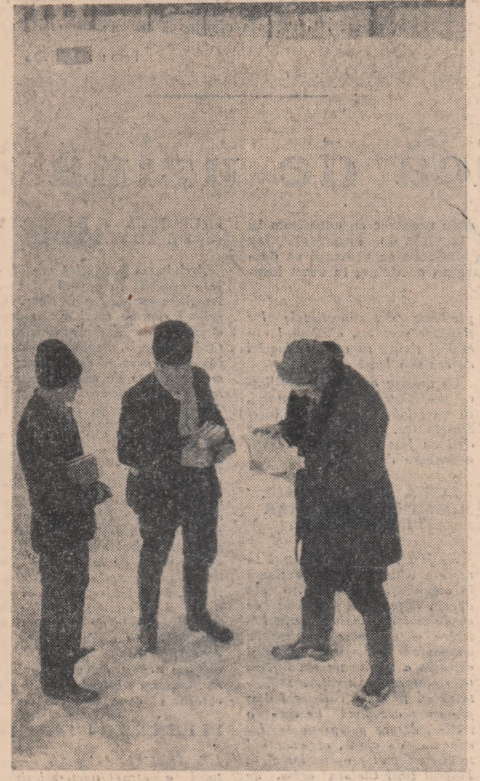
Întă, eu, de pildă, am luat „Bărăgan”... Voi? (Tineri) colectivști din comuna Dridu, raionul Urziceni, plecând de la bibliotecă.

Tinerii din secția rulmenți de la Uzina nr. 2 din Ploiești se străduiesc neconștient să dea lucru de cea mai bună calitate. Dornici să și ridice tot mai mult nivelul profesional, ei participă în număr cit mai mare la cursurile de ridicare a calificării din cadrul secției. Iată-i pe acești tineri ascultind cu atenție îndrumările inginerului Straus Teodor cu privire la rectificarea suprafețelor conice.