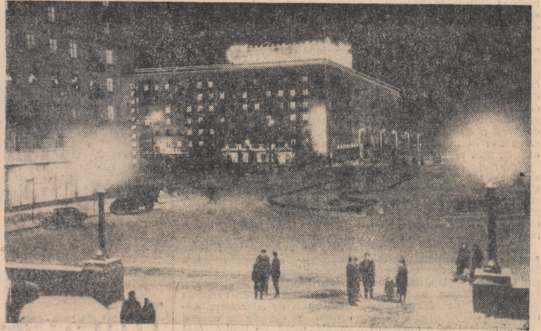
Aspect din Volgogradul de astăzi: Prospecul V. I. Lenin seagr.