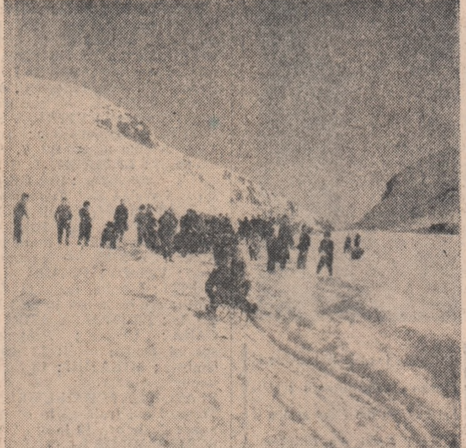
Peste 500 de tineri din comuna Sprincenata, regiunea Argeș, participă la Spărachiada de iarnă a tineretului. În fotografie: un aspect din timpul desfășurării probei de sănișu.