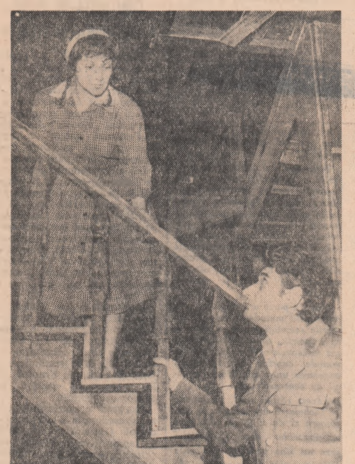
La Teatrul Național din Cluj a avut loc de curînd premiera pe lîră cu piesa scriitorului Eugen Barbu...

Pe care le puteți procura de la: Librăriile și magazinele cooperativelor de consum și distribuții de cărți de la sate.