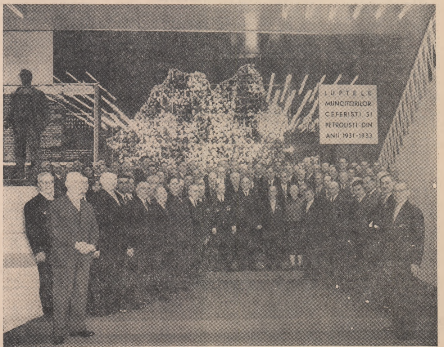
Tovarășul Gheorghe Gheorghiu-Dej și ceilalți conducători de partid și de stat în mijlocul participanților la luptele din februarie 1933

Organizația Centrală Regională Hunedoara-Deva