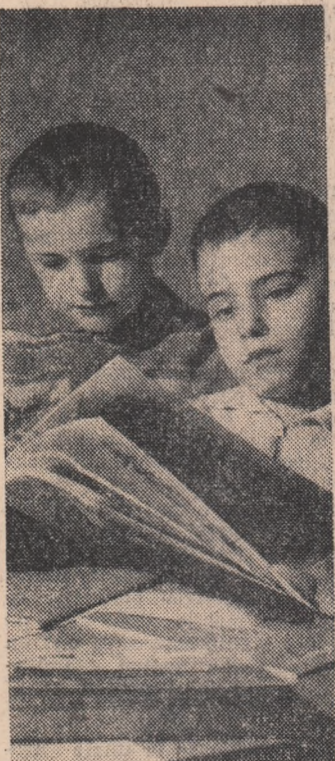
Copiii sînt și ei vizitatori neplăsuți ai bibliotecii regionale din Plești.