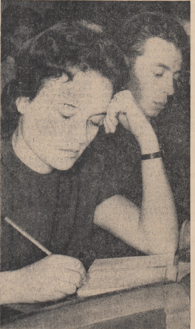
Delegații își notează cu multă atenție problemele ce se dezbate în cadrul conferinței.