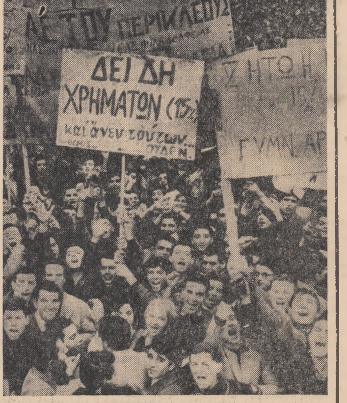
Zilele acestea au avut loc două demonstrații de protest ale studenților greci împotriva poliției autorităților în domeniul învățămîntului. În fotografie: un aspect de la una din demonstrațiile care au avut loc la Pireu.

Conferința a relevat, de asemenea, necesitatea unei mai bune asigurări a englezilor cu locuințe. Un vorbitor a subliniat că guvernul nu și-a îndeplinit angajamentul de a lăchida slumsurile (cociobane n.r.).