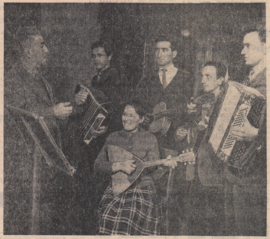
Repetiție la școala populară de ară