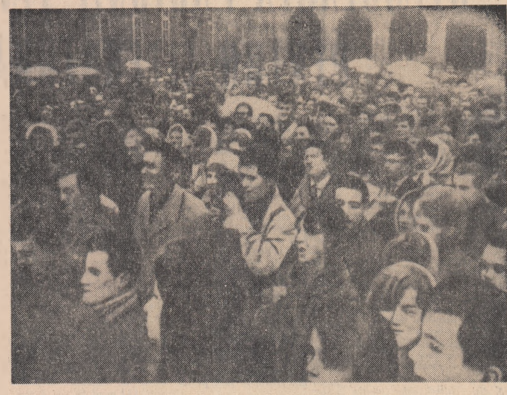
Peste o mie de studenți s-au adunat în curtea Sorbonei în cadrul unui miting desfășurat sub lozincă „Amfiteatre și nu tunuri!”

SOFIA 25 (Agerpres).— Ziarele trecute a avut loc la Sofia cea de-a XIII-a ședință a Comisiei Permanente C.A.E.R. pentru agricultură. La ședință au luat parte delegații din partea R.P. Bulgaria, R. S. Cehoslovacie, R. D. Germane, R.P. Mongole, R.P. Polone, R. P. Romine, R. P. Ungare și Uniunii Sovietice. În calitate de observatori au fost prezenti la ședință reprezentanți ai R. S. Chineze și R.D. Vietnam. Comisia a analizat unele probleme ale producției în țările membre ale C.A.E.R. în domeniul agriculturii, a adoptat referatul cu privire la activitatea Comisiei desfășurată în anul 1962 și la activitatea ei de viitor, a ascultat informarea despre îndeplinirea în țările membre C.A.E.R. a recomandărilor Comisiei în legătură cu problemele veterinare. În conformitate cu hotărârile celei de-a XVII-a sesiuni a Consiliului, Comisia a adoptat completările la planul ei de lucru pe 1963, precum și recomandările pregătite de organele auxiliare ale Comisiei în domeniul mecanizării agriculturii și protecției plantelor. Ședința s-a desfășurat în spirit de colaborare frățească și ajutor reciproc.