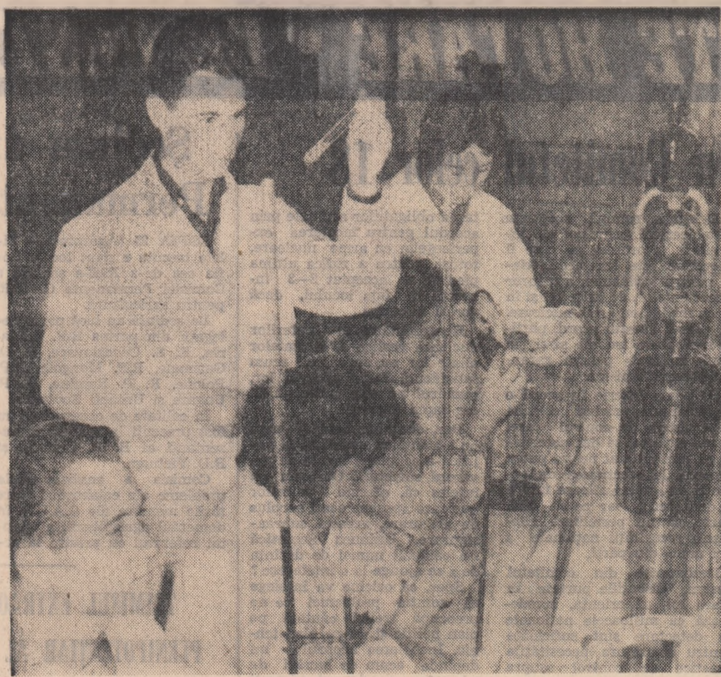
În laboratorul de tehnologie amidonului și produse zaharose ale Institutului politehnic din Galați.

Mihail Nicolae: „Eu, în chestiunea asta a timpului pentru lectură — și a scoaterii unui maximum de folos din lectură — îmi impusese, într-o vreme...”