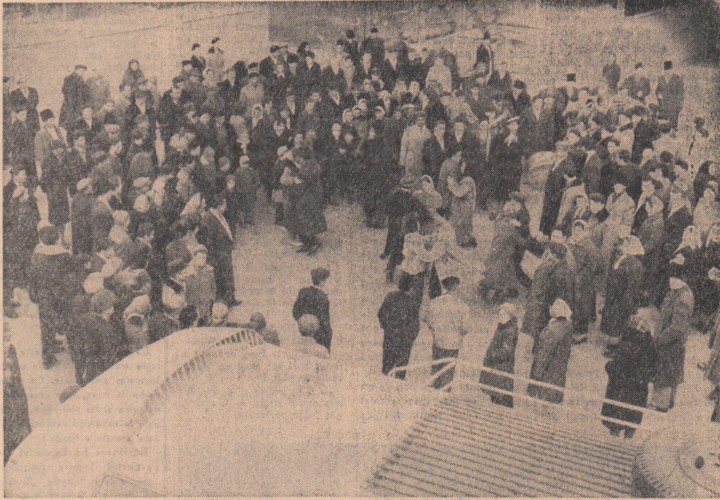
Pe străzile Sighișoarei sărbătorea se manifestă spontan, în cîntec și joc.