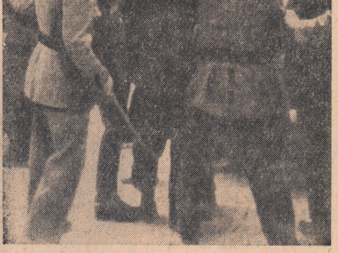
Incidente la Bogota, capitala Columbiei, după debarcarea grevei personalului companiei aeriene „Avianca”.