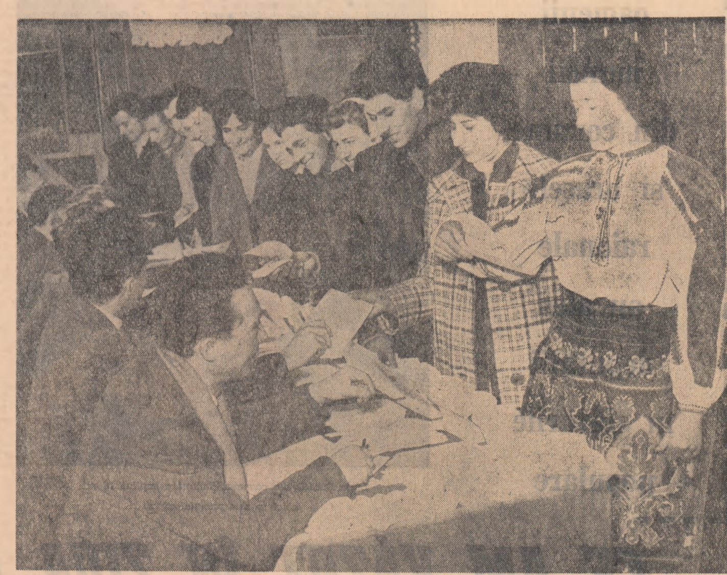
Li se înmînează pentru prima dată în viață buletinul de vot.

— N-ai noroc și pace... Meru sosit firzi — îi spunem noi fotoreporterului.