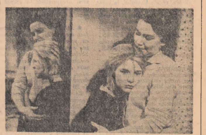
O producție a studioului „Lenfilm”

Film distins cu premiul „Leul de aur” la festivalul internațional de la Veneția 1962 și cu „Palmele de aur” al Centrului național italian de filme pentru tîneret.