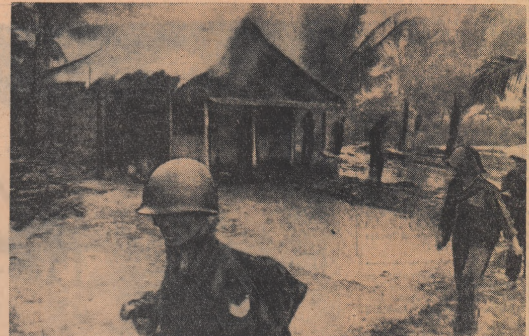
Acest document fotografic vorbește despre teroarea cruntă prin care guvernul democristian încercă să îndușure lupta de eliberare a dusă de poporul Vietnamului de Sud. Soldații democristiani atacă cu sălbăcie un sat sub motivul că acolo activează forțele patriotice.

Este puțin probabil ca cineva să sfîrșească imposibilitatea pentru S.U.A. de a rezolva această sarcină.