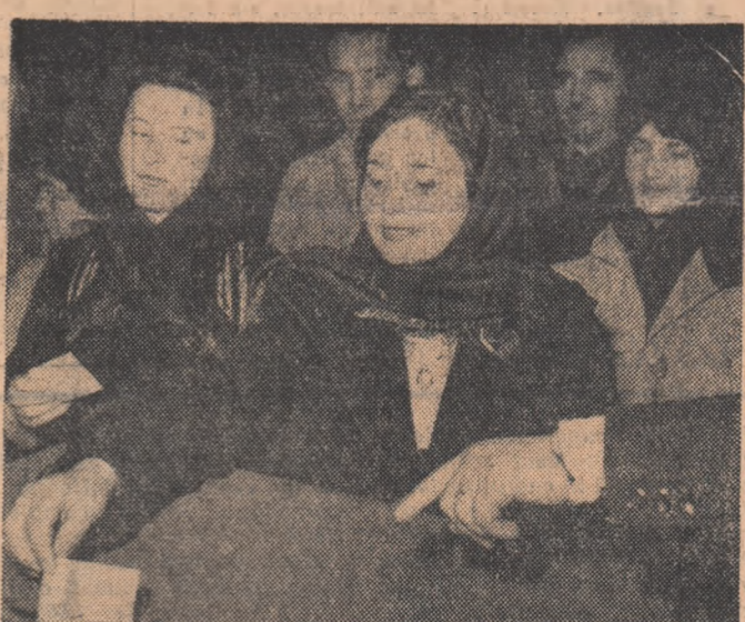
Alegerile de deputați în sfaturile populare comunale și ale orașelor de subordonare raională s-au desfășurat în întreaga țară într-o atmosferă înaltă, sărbătorească.

În ziua de 3 martie au avut loc alegeri parțiale de deputați în Marea Adunare Națională, pentru locurile de deputați devenite vacante în circumscripția electorală Hațeg, regiunea Hunedoara și în circumscripția electorală Simburești, regiunea Argeș.