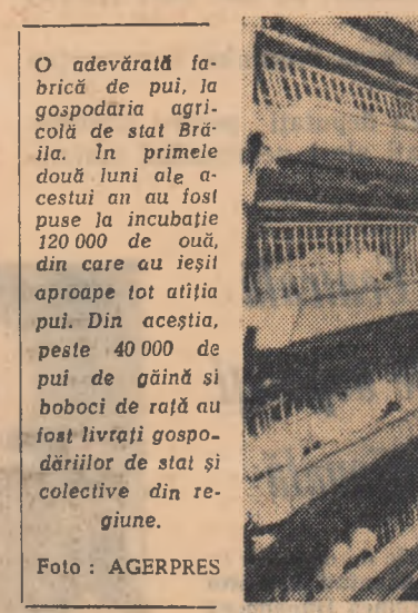
O adevărată fabrică de pui, la gospodăria agricolă de stat Brăila. În primele două luni ale acestui an au fost puși la incubare 120.000 de ouă, din care au ieșit aproape tot albia pui. Din acestia, peste 40.000 de pui de găină și boboci de rață au fost livrați gospodăriilor de stat și colective din regiune.

Consider însă că în perioada iernii numărul demonstrațiilor practice este destul de limitat. De aceea cred că ar trebui studiată posibilitatea ca procesul de în-