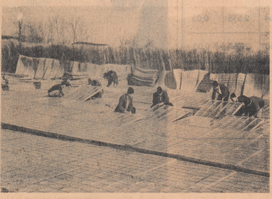
Mai multe legume timpurii pentru satisfacerea nevoilor crescînde ale oamenilor muncii. Colectiviiștii din Alumați-București și-au bine ales lucrul, lădă de ce, în aceste zile ei lucrează cu migală și pricepețe la răsădnie.

Folosind timpul prielnic, mecanizatorii din raioanele Negru-Vodă și Mehedina au început arăturile, gîrpatul ogoarelor de toamnă, iar în unele gospodării și desfundarea terenurilor ce urmează să fie plantate cu vie.