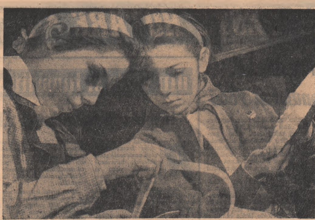
— Oare e bine așa? Îți place? (la cerșul de sculptură de la Palatul pionierilor din Capitală).