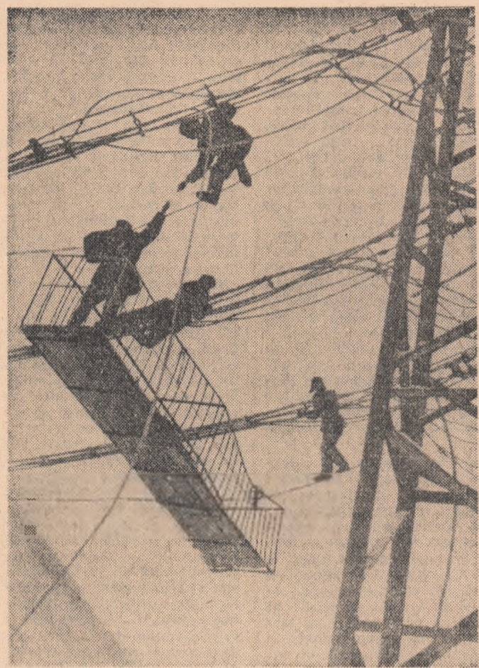
Aspect de la instalarea liniei de transport electric pe șantierul Uzinei metalurgice din regiunea Kemerovo (U.R.S.S.)

„Ne bucurăm mult că am avut posibilitatea să cunoaștem jara voastră atât de frumoasă și harnică în tineret” — ne-a spus Anezka Valigurova, secretar al Comitetului Central al Uniunii Tineretului Cehoslovac. La invitația C.C. al U.T.M., delegația Uniunii Tineretului Cehoslovac a făcut o vizită în țara noastră. Înainte de a părăsi București, am rugat-o pe conducătoarea delegației, tovarăsa Anezka Valigurova, să împărtășească cititorilor noștri impresiile sale. — Am străbătut câteva sute de kilometri pe pământul României îndrăști. Am fost la Ploiești, unde am văzut o modernă rafinărie, la Brașov am