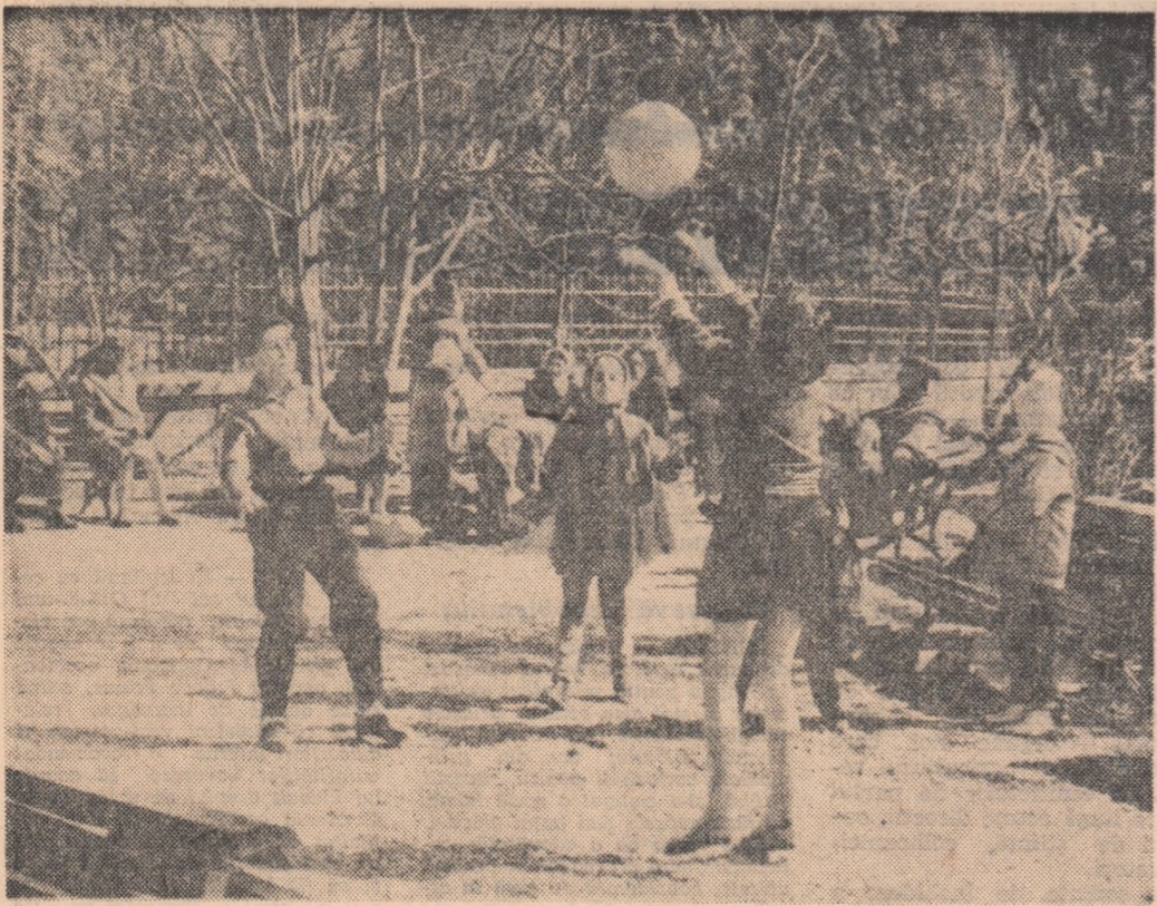
Primăvara a poposit și în Cismigiu.