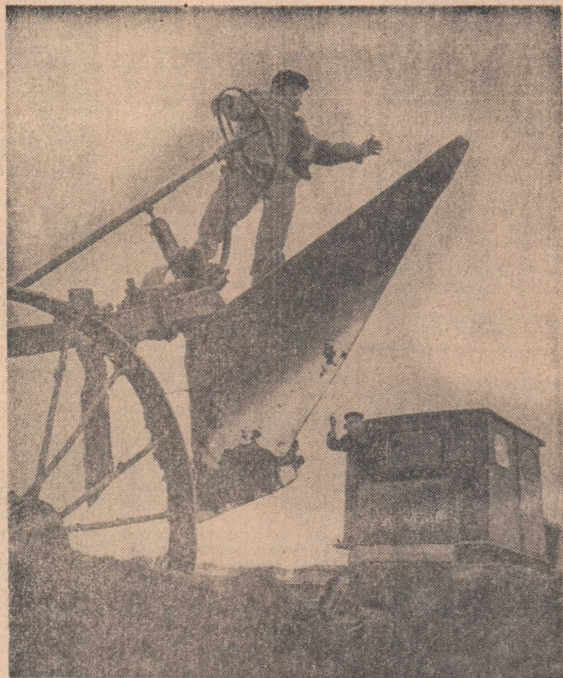
Acțiuni importante se desfășoară în aceste zile de primăvară pentru mărirea suprafețelor cultivate cu viță de vie. În fotografie: la G.A.S. Valea Călugărească, regiunea Ploiești, se lucrează cu mijloace mecanizate la săpatul terenului pe care va fi plantată vița de vie.