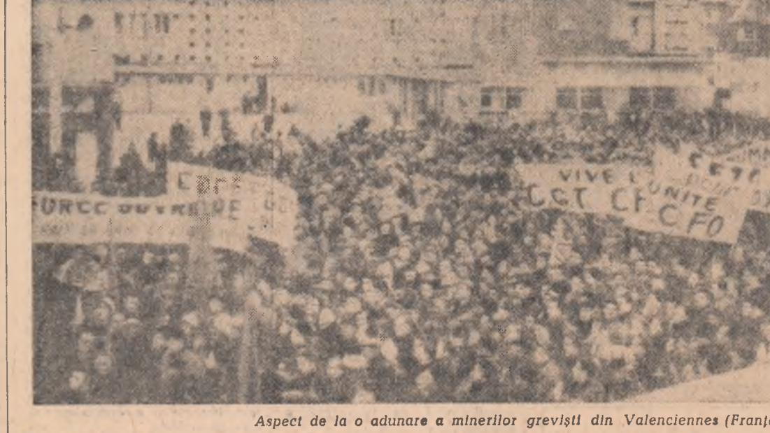
Aspect de la o adunare a minerilor greviști din Valenciennes (Franța)

SANAA. — Agenția France Presse transmite că președintele Republicii Arabe Yemen Abdallah As-Sallal, a adresat la 16 martie un mesaj președintelui Nasser în care îi cere „ca Yemenul să fie inclus în proiectata uniune între Cairo, Damasc și Bagdad”. As-Sallal declară în mesajul său că „Yemenul aderă la rezoluțiile menite să promoveze uniunea completă a arabilor”.