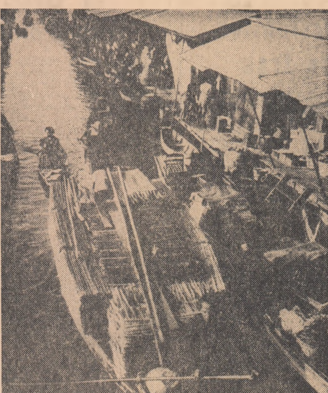
BANGKOK. — În asemenea barăci mizere trăiesc mii și mii de oameni ai muncii din capitala Tailandei

Declarația semnată de președintele Confederației, Ali Fateni (care învață în S.U.A.), a fost remisă ambasadei iraniane din Washington pentru a fi transmisă guvernului iranian. În declarație se spune că actualul regim din Iran a pornit un val de reprimări împotriva a mii de profesori, studenți, pe care i-au aruncat în închisori pentru că s-au pronunțat împotriva referendumului fraudulos din ianuarie. „Sîntem hotărîți — se subliniază în declarație — să continuăm lupta pentru înfăptuirea unor reforme cu adevărat progresiste”.