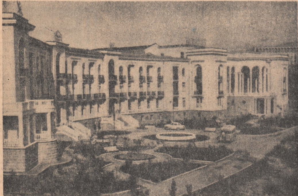
In fotografia noastră: noul sanatoriu dat recent în folosință în stațiunea balneo-climaterică Thallabo din R.S.S. Gruzină