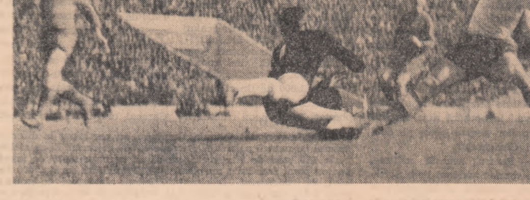
O nouă acțiune de gol la poarta formației Crișana