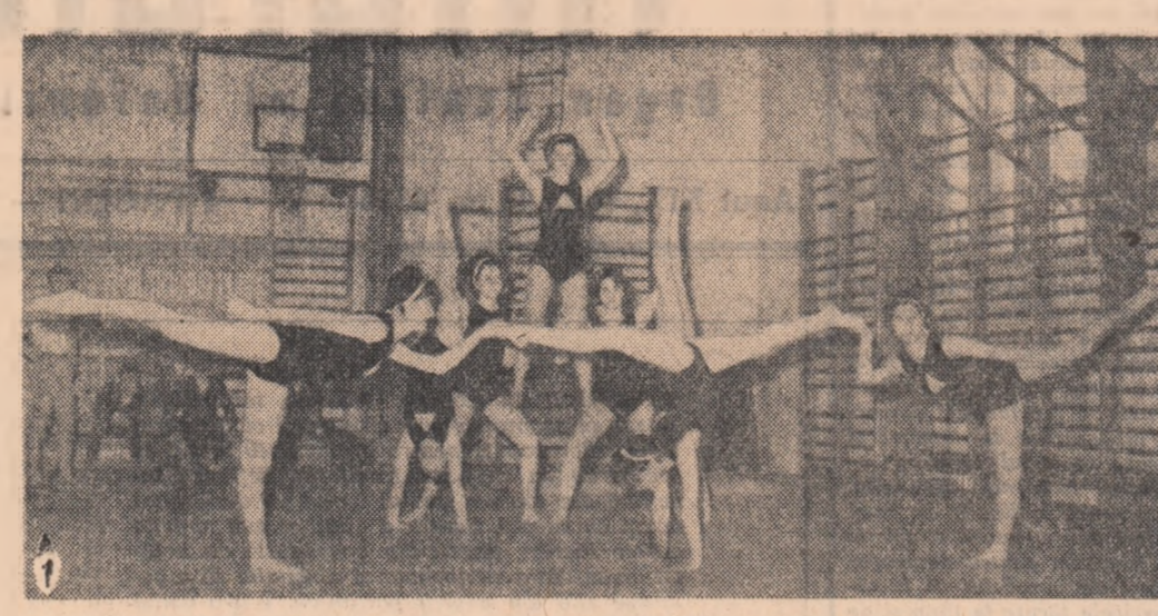
Instantanee din întrecerile bucureștene

Impreună cu primăvara (Urmare din pag. 1)