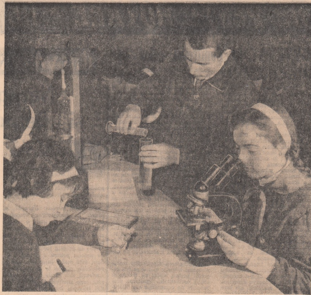
Noua școală medie din comuna Cobadin, regiunea Dobrogea, este dotată cu săli de clasă spațioase și luminoase, cu laboratoare utilitate cu material didactic. De asemenea școala are un internat pentru elevii care vin din alte comune. În fotografia elevii ai acestei școli în laborator

velatoare, folosiți de romancier. Titulul cărții are și el o evidentă valoare simbolică. Aparent, ea s-ar referi numai la condiția morală a lui Andrei Sabin. În realitate, sfera noțională a cuvîntului e mult mai cuprinzătoare: „străin” se simt în societatea burgheză toți exploatații, umiliți și asupriți, toți cei aminați de idealuri generoase, fie ei luptători activi pentru dreptate și libertate, fie numai oameni nemulțumiți de starea de lucruri existentă. Unii (comuniștii) au dezvoltat mișcare repede acest adevăr și știu ce e de făcut pentru a schimba situația și a pune bazele unei vieți noi, ferice. Alții (ca