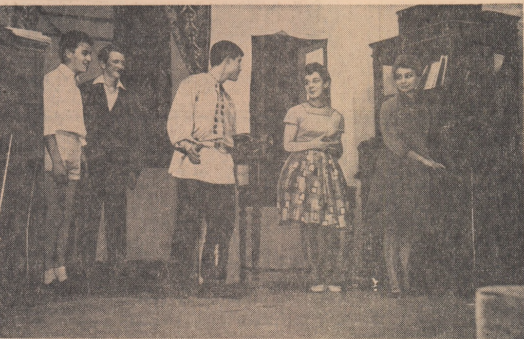
Scenă din spectacolul „În căutarea tericirii” de Rozov prezentată de elevii școlii.

Activitatea culturală — un bun al tuturor