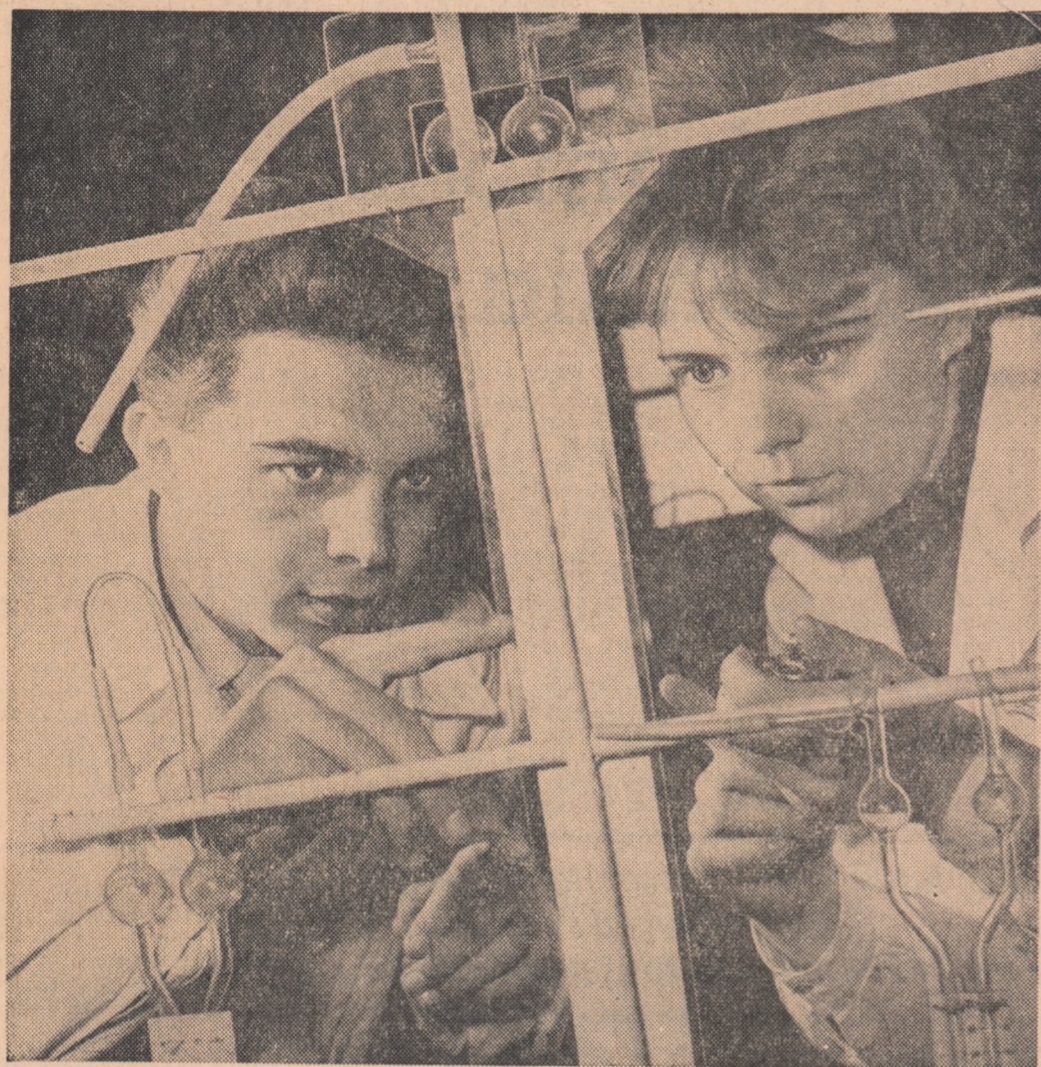
Studenții din anul al III-lea al Facultății de Fizică în laboratorul de izotopi stabili al Universității din Cluj