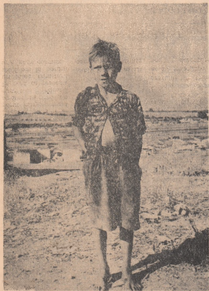
Spania de astăzi: copilul unui muncitor șomer din Merida

irfurile franchiste au renunțat două zile la treburile lor obișnuite și s-au strîns într-un colocviu pe care „Le Monde“ îl considera densit de importanță. Este întâia oară după 11 ani cînd se întrunesc cele mai marcante personalități falangiste. Nu-l greu de înțeles că multe probleme dau bătăi de cap complicilor lui Franco. Dar din mulțimea grîjilor lor, franchiștii au vădit o preocupare cu totul specială față de una din ele: atitudinea generației tineri.