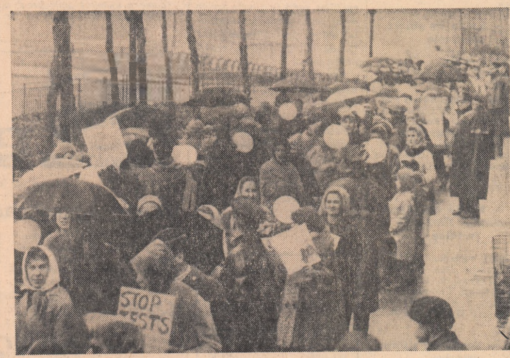
Demonstrație de protest a femeilor progresiste din S.U.A. împotriva cursei înarmărilor nucleare

VIENA. La Viena a fost format Comitetul pentru desfășurarea „marșului pentru pace și dezarmare“. Din comitet fac parte 28 de oameni de știință, scriitori, compozitori, fruntași pe tărîm obștesc din Austria. În apelul comitetului se arată că scopul principal al marșului este să contribuie la realizarea dezarmării genera-