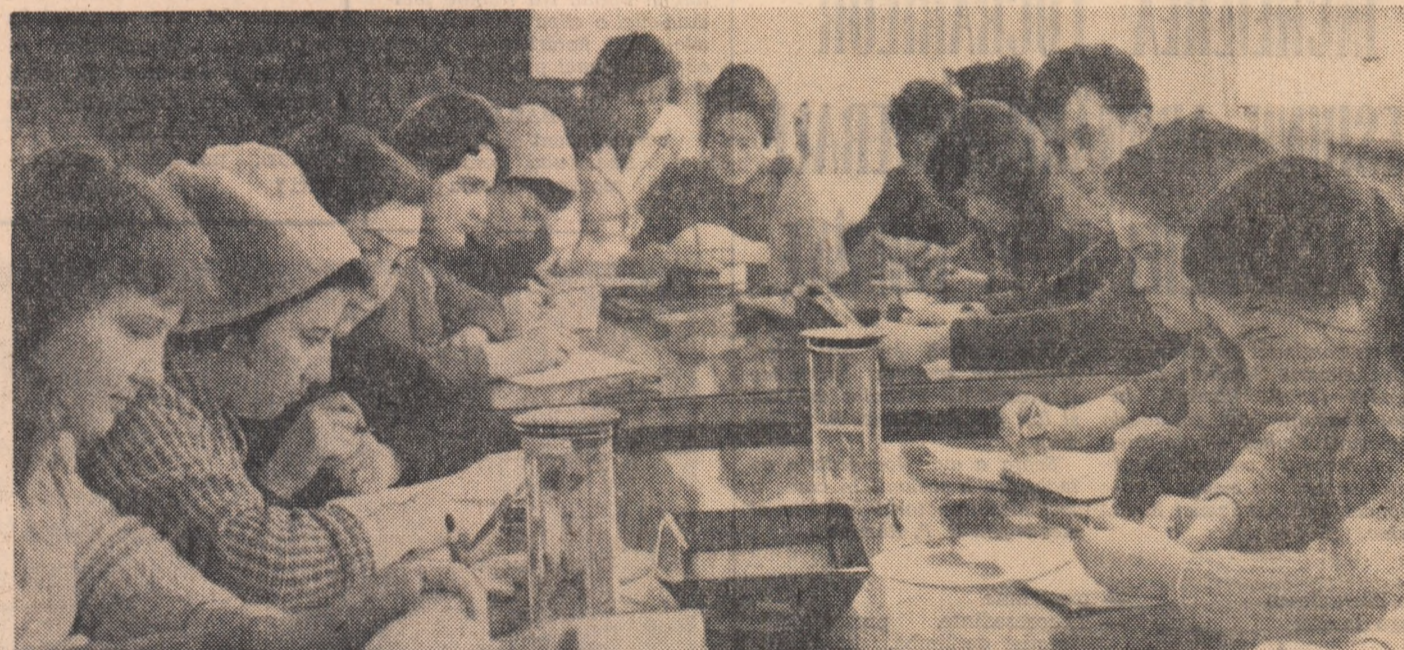
Oră de zoologie în laboratorul Institutului pedagogic de 3 ani din Bacău.

Considerăm că ar fi util pentru înlăturarea deficiențelor în organizarea practicii să se organizeze o întâlnire între conducerea școlilor profesionale și de meserii, conducerea întreprinderilor, tovarășii de la consiliul local al sindicatelor și Comitetul orașesc U.T.M. În urma schimbului de păreri ce s-ar realiza cu acest prilej, s-ar putea stabili pentru fiecare problemă, încă nerozolvată, măsuri cu răspundere și termene precise. Numai un asemenea mod concret de a munci poate să ducă la aplicarea în viață a constatărilor făcute în legătură cu practica elevilor atît în cadrul practicii amintite, cit și de către fiecare conducere de întreprindere ori școală profesională.