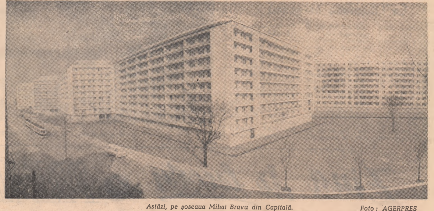
Astăzi, pe șoseaua Mihal Bravu din Capitală.

Acad. Athanase Joja a relevat meritele acad. Ilie Murgulescu ca om de știință și ministru al învățămîntului. Lîndă cuvîntul, acad. Ilie Murgulescu, în numele Președintelui nou ales a exprimat mulțumiri membrilor Academiei pentru încrederea acordată asigurîndu-i că va depune toate eforturile pentru dezvoltarea activității de cercetare științifică în slujba construcției socialismului în țara noastră. Acad. Iorgu Iordan a dat apoi citire unei scrisori adresate C.C. al P.M.R., tovarășului Gheorghe Gheorghiu-Dej, prin care oamenii de știință din țara noastră își exprimă dra- După-amiază au fost aleși președinții secțiilor științifice și președinții filialelor din Cluj și Iași ale Academiei R. P. Romine. Seara a avut loc ședința de închidere a sesiunii în care a fost ales următorul Președinte al Academiei R. P. Romine: gostea și devotamentul lor față de partid și hotărîrea lor de a depune toate eforturile pentru intensificarea cercetărilor științifice. Adunarea Generală a votat apoi în unanimitate hotărîrea prin care se aprobă activitatea Academiei R. P. Romine pe anul 1962 și planul de cercetare pe anul 1963 și se ratifică toate hotărîrile Academiei în perioada de la ultima sesiune. Au fost decernate apoi în cadrul festivității premii Academiei R. P. Romine pe anul 1960 și 1961 pentru lucrări de deosebită valoare în diferite domenii de activitate. (Agerpres)