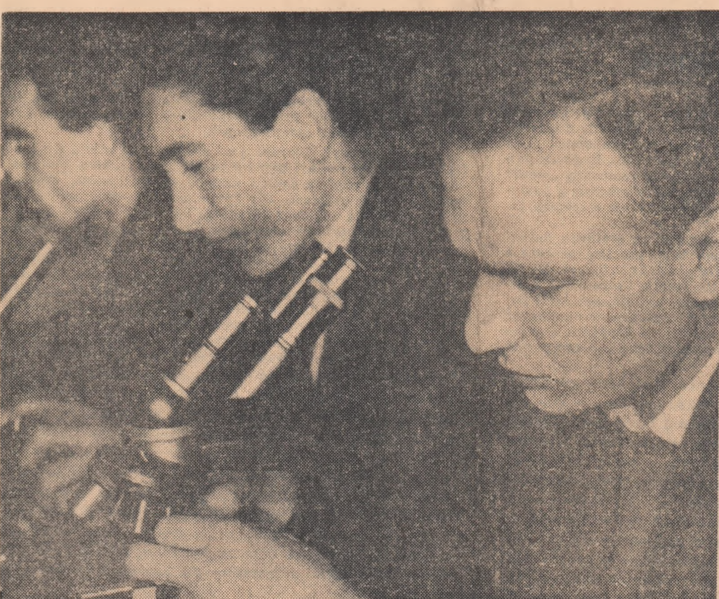
În laboratorul de fiziopatologie al Institutului agronomic din Craiova

Anul XIX, seria II nr. 4309 4 PAGINI — 20 BANI Simbătă 23 martie 1963