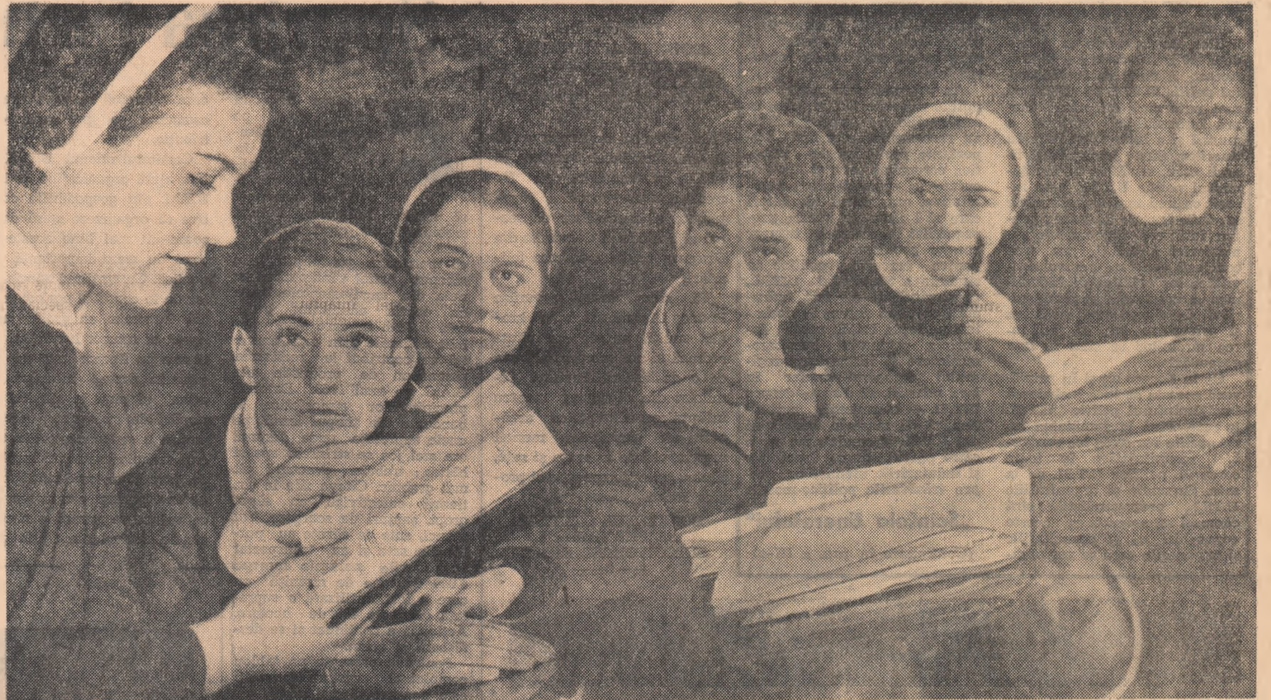
Cîțiva membri ai cercului literar de la Școala medie nr. 3 din Capitală într-o sesiune de lucru.