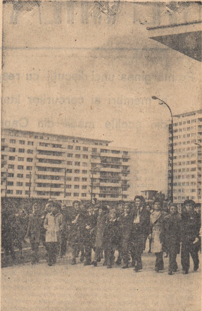
În drumejie prin Capitală

Folosirea utilajelor moderne asigură obținerea unei productivități sporite și cu consumuri specifice mai mici. Acum în minele Văii Jiului se extrag zilnic, în medie, pe fiecare post, cu 250 kg cărbune mai mult decît la începutul șesenalului, prețul de cost al cărbunelui scăzînd în acest timp cu aproximativ 13 la sută. (Agerpres)