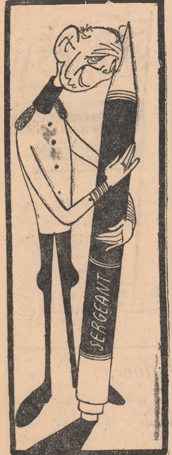
— Asta a fost foc — osul meu de totdauna Desen de: V. VASILIU

Agenda de presă au anunțat că în luna mai a.c. va fi formată prima subunitate a Bundeswehrului vest-german, înarmată cu rachetele americane de tipul „Sergeant” prevăzute cu focos atomice.