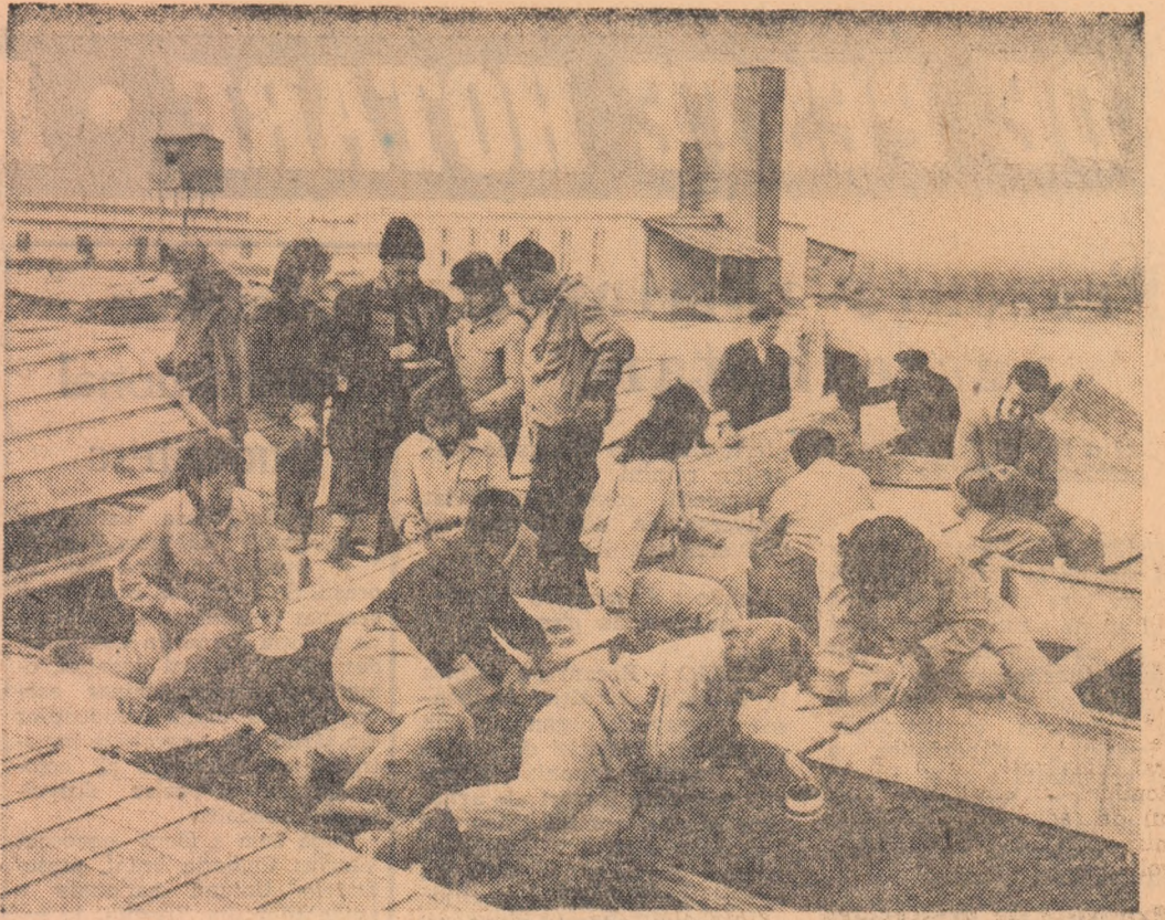
Studenți din anul I horticultură al Institutului agronomic „T. Vladimirescu” din Craiova, la lucrări practice în Stațiunea experimentală Simnic