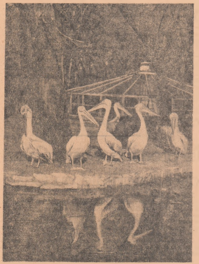
Primăvară în Cismigiu