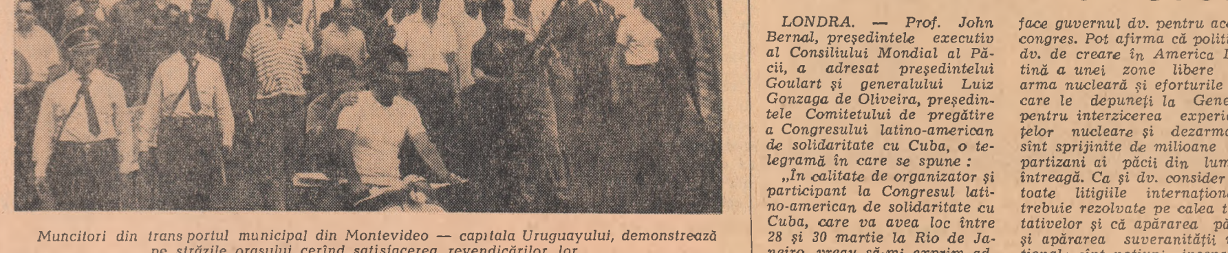
Muncitorii din transportul municipal din Montevideo — capitala Uruguayului, demonstrează pe străzile orașului cerînd satisfacerea revendicărilor lor.

Worthington relevă și un alt aspect al intervenției americane în Vietnamul de sud. El scrie că comandamentul armatei americane folosește războiul din Vietnamul de sud ca un teren de instrucție pentru așa-numitele „forțe speciale ale S.U.A.”, care au drept sarcină lupta împotriva unor acțiuni de partizani și răsturnarea regimurilor care nu convin Washingtonului. „Există unii care consideră că cele învățate în Vietnamul de sud ar putea fi în curînd aplicate în Cuba împotriva regimului lui Castro”, scrie Worthington.