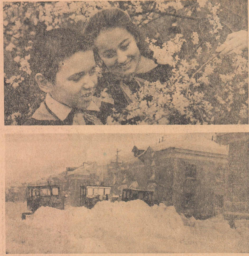
În timp ce în sudul Uniunii Sovietice au înflorit corodșii (fotografia de sus), în orașul Varkute, din R.S.S. Autonomă Comi, bulldozele au de furcă cu mari toreni de zăpadă (fotografia de jos)

Lansarea simultană, în 1962, a celor doi cosmonauți sovietici a declarat Johnson, „este cea mai mare realizare înfăptuită vreodată de o națiune”.