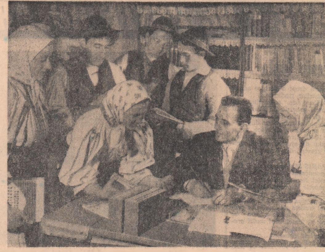
În bibliotecă, la căminul cultural din comuna Suciu de Jos, raionul Lăpuș.

În încheierea convorbirii, tovarășii de la „I.O.R.” și-au exprimat convingerea că și în viitor colaborarea cu instituțiile de cercetări și oameni de știință va constitui un sprinț în realizarea unei producții de o calitate mereu crescîndă, la nivelul tehnicii celei mai moderne.