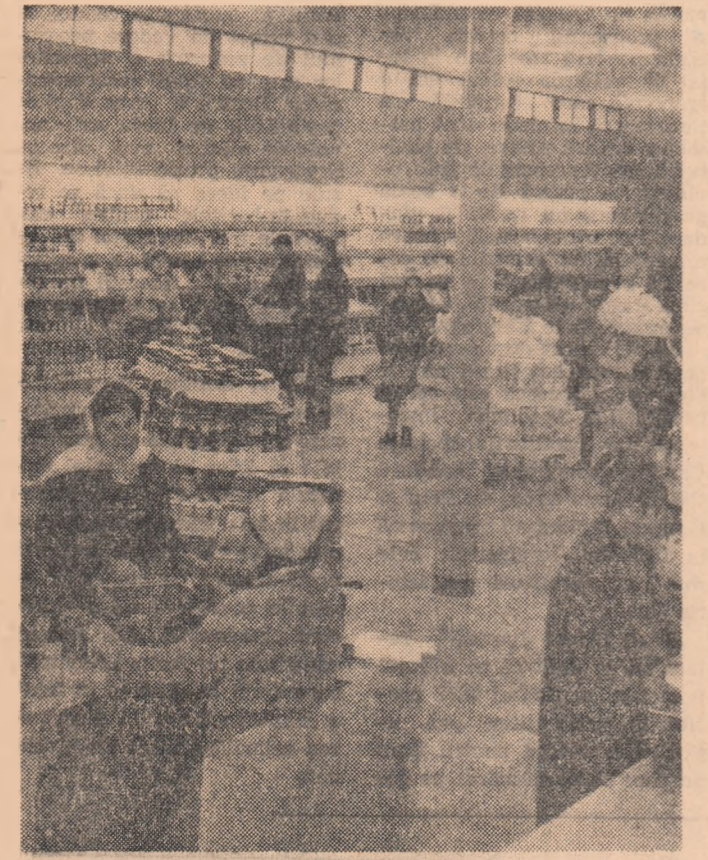
Noul magazin cu autoservire din cartierul Tîglna-Galați.

Consfătuirea a adoptat un plan de măsuri care, aplicate, vin în sprințul ridicării cît mai multor tineri în rîndul frunțașilor.