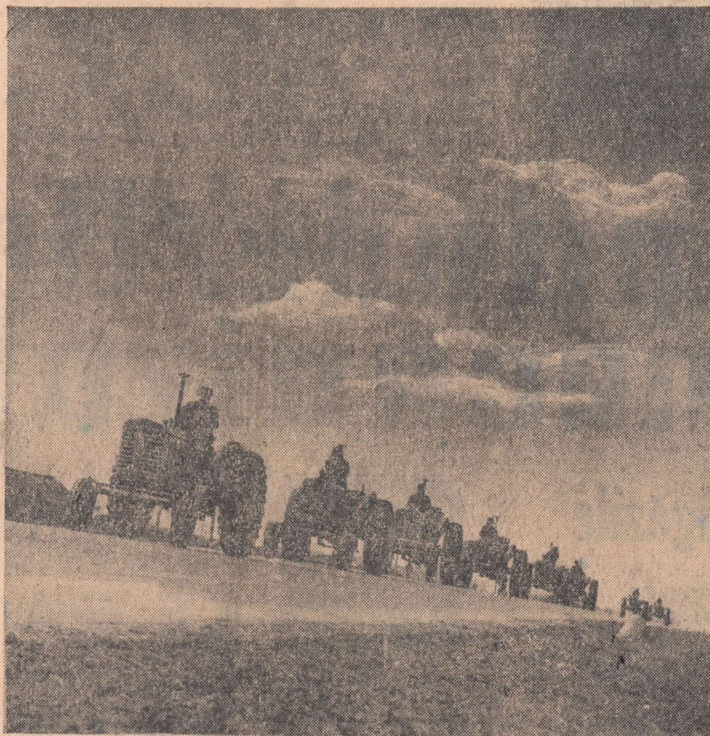
...Se-aude cînt de primăvară!