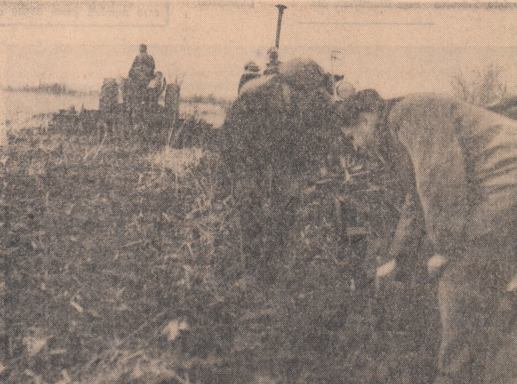
Lucrări de pregătire a terenului în vederea însămînțării de primăvară la G.A.S. Dumbrăveni, regiunea Brașov.