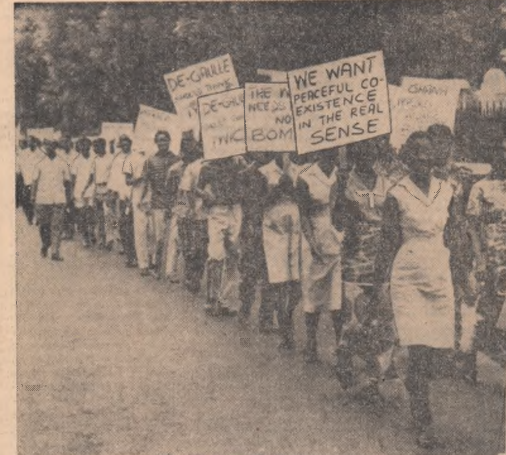
Imagine de la o recentă demonstrație desăvîrșită la Accra, capitala Republicii Ghane, împotriva detonării bombei atomice franceze în Sahara.

France Presse subliniază că, lepartea de a fi rezolvate, dificultățile se vor agrava și mai mult. Ele constituie o urmare a menținerii măsurilor discriminatorii în comerțul cu țările socialiste precum și a intensificării luptei de concurență atît în cadrul Pieței comune cît și între monopolurile din aceste țări și cele care nu fac parte din CEE.