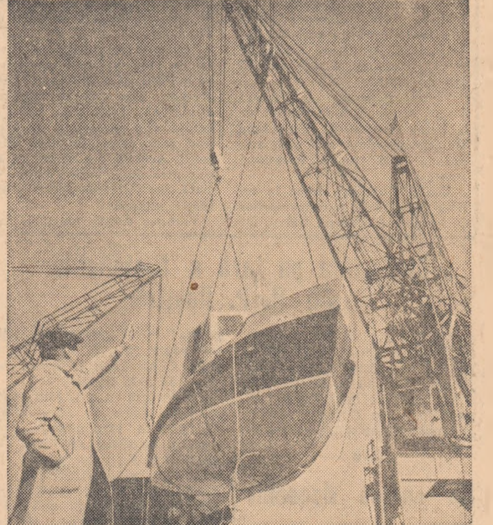
Șantierul naval Oltenița. Se pregătește lansarea la apă a unui nou remorcher.