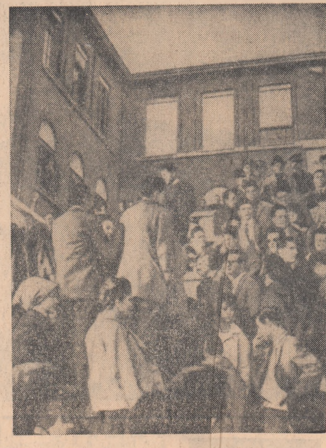
Studentii Facultății de arhitectură din Roma au ocupat incinta facultății organizînd o grevă în sprijinul revendicărilor privind democratizarea învățămîntului. În fotografie: aspect de la această acțiune a studenților.

Vorbitorii au calificat planul de prelungire a regimului militar ca „nerozonabil și antidemocratic”, și au cerut ca