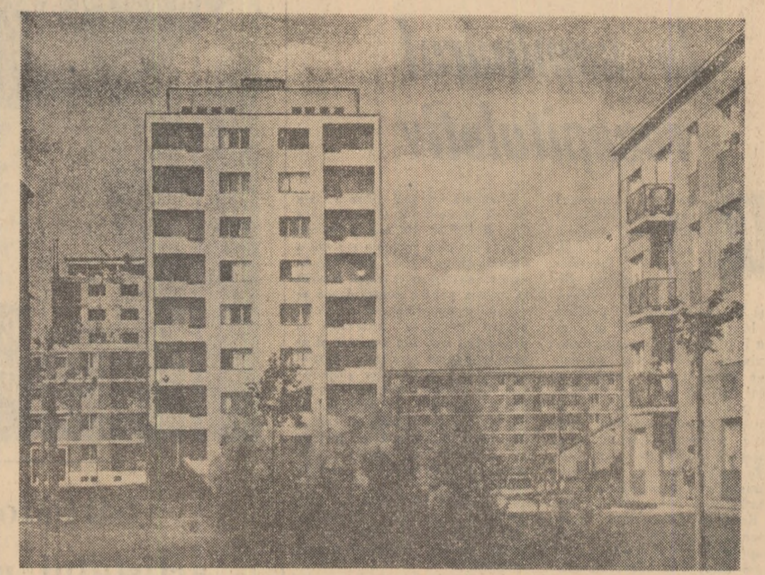
Aspect dintr-un nou cartier al Budapestei

În esență, noul regim militar nu face decât să continue și mai fățiș politica reacționară antipopulară dusă de fostul președinte al Guatemalei. De altfel, Ydigoras Fuentès, care a plecat cu un avion din Guatemala în Nicaragua în „exil”, a declarat ziaristilor la sosirea în Nicaragua că „schimbarea este bună pentru Guatemala și pentru America Centrală”. În țară s-a izbucnit un val de arestări. Armata a ocupat clădirea Congresului și sediile a două partide politice. Colonelul Enrique Peralta Azurdia are, de altfel, experiență în reprimarea adversarilor politici. După cum menționează agenția Associated Press, el este acela care, în calitate de ministru de război în perioada guvernării lui Fuentès, l-a ajutat pe acesta într-o serie de acțiuni antipopulare.