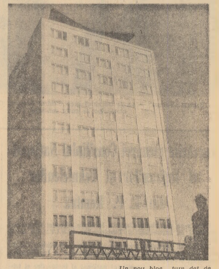
Un nou bloc turn dat de curînd în folosință la Cluj

În numeroase centre din regiunea Argeș printre care comuna Ionești, Măntăuș, Topoloveni, Rădești etc. s-a desfășurat duminică faza intercomunală din cadrul celui de-al VII-lea concurs pe țară al formațiilor artistice de amatori. La actualul concurs participă peste 2.000 de formații artistice de amatori, cu 687 mai multe decît la precedentul concurs. Numărul artiștilor amatori este de 15.000 mai mare decît cel înregistrat la concursul anterior. (Agerpres)