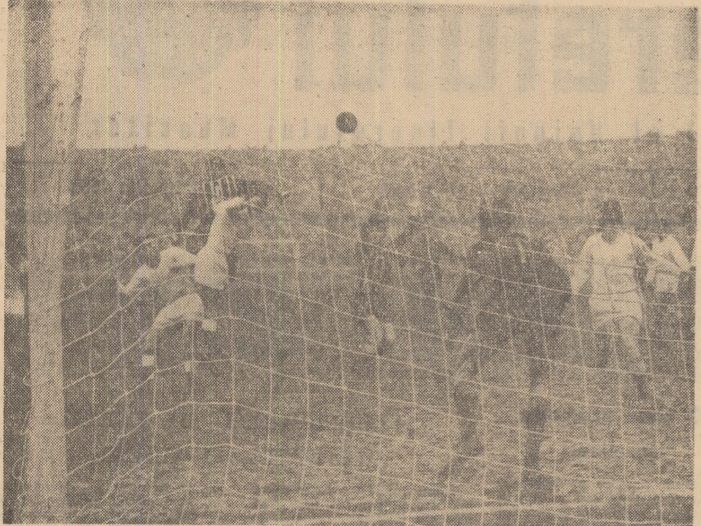
Rapid atacă insistent, obligind formația dinamovistă să se apere supranumeric