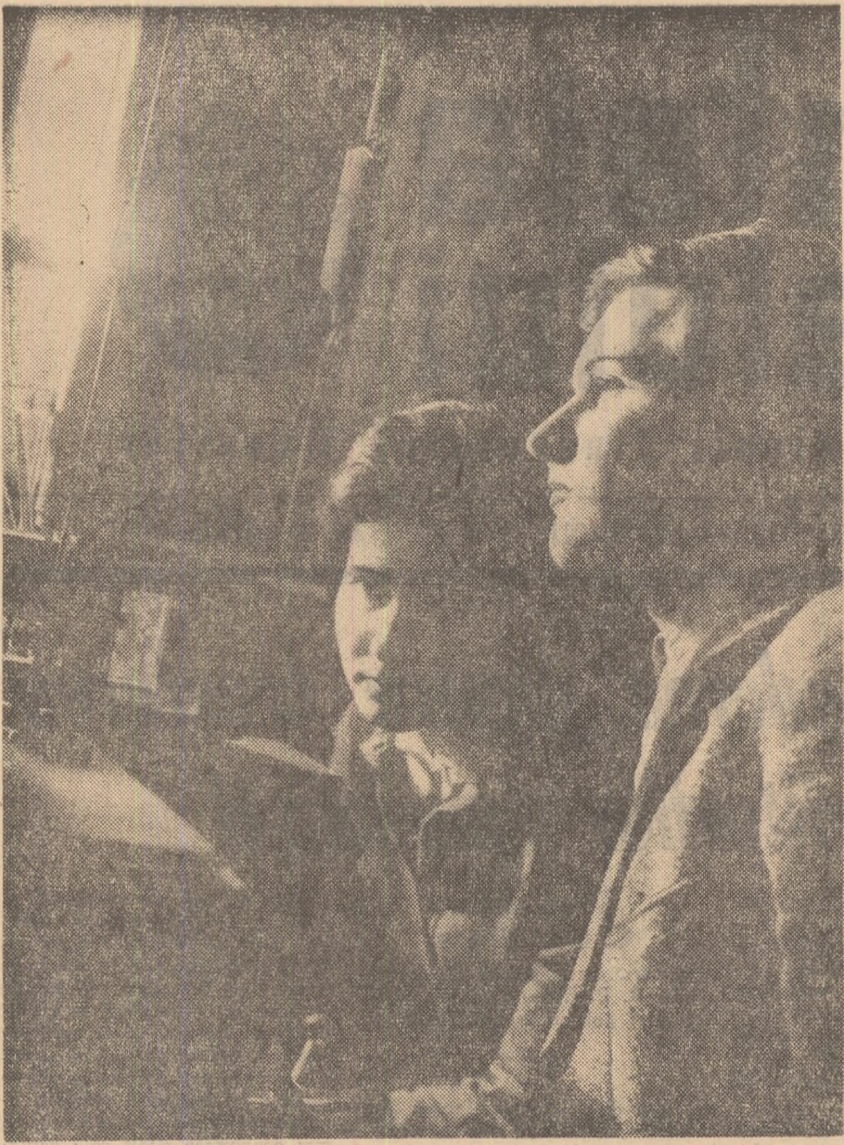
Studenti din anul II — Facultatea de fizică a Universității din București — în laboratorul de microscopie electronică