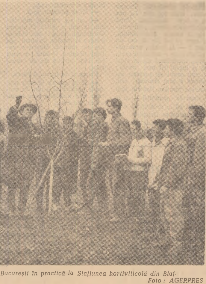
Studenți agronomi din București în practică la Stațiunea hortiviticolă din Blaj.

mentările practice li se vor tine și referate despre lucrarea respectivă. Pînă la terminarea institutului, studenții vor face cu cunoștință în mod practic și cu lucrările agricole ce se efectuează vara și toamna. Astfel studenții anului II vor efectua practica de producție vara, iar cei din anul III toamna.