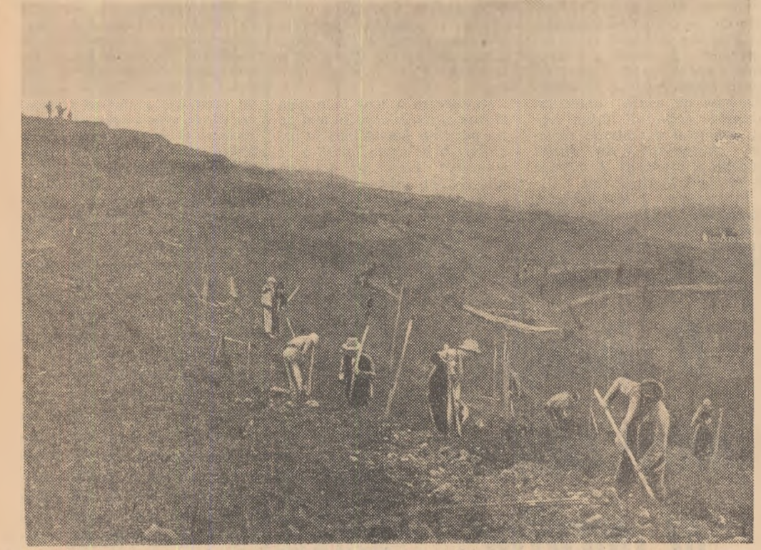
La G.A.S. Alba Iulia noi terenuri sînt puse în valoare prin terasare și plantare cu viță de vie din soiuri superioare.