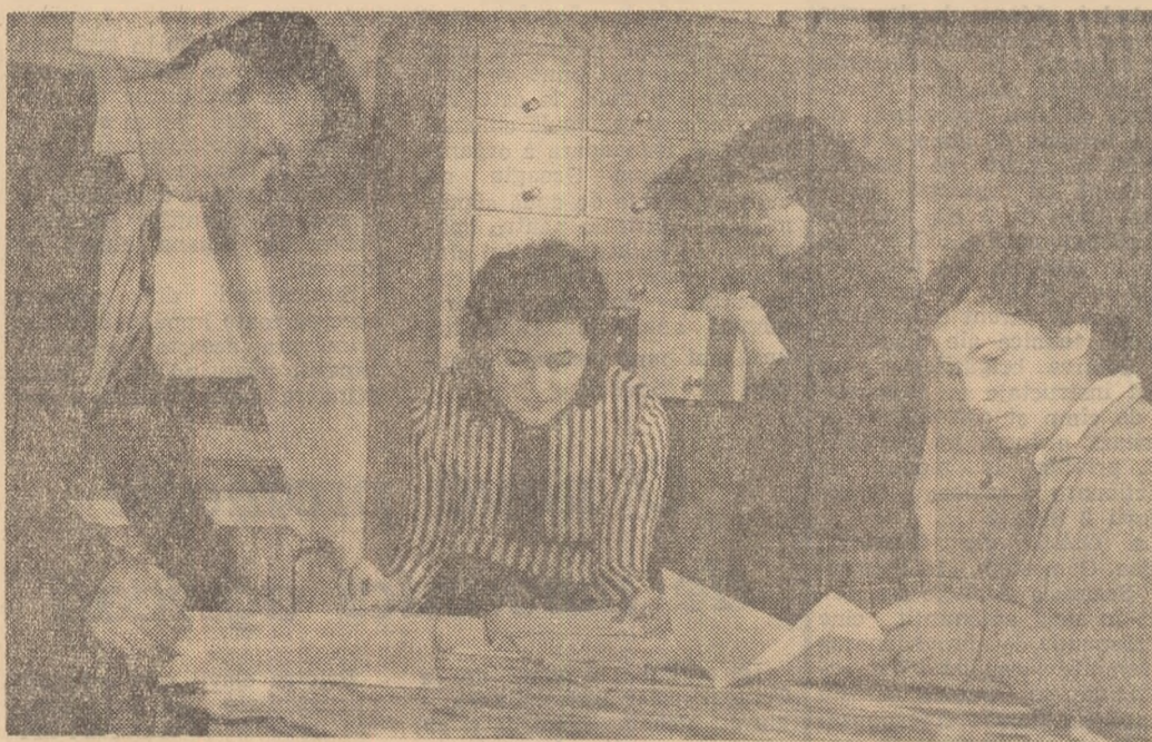
În sala de documentare a Institutului politehnic din Galați