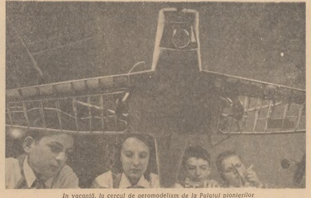
In vacanță, cercul de aeromodellism de la Palatul pionierilor

CONSTANTIN RAȘITARU correspondent voluntar