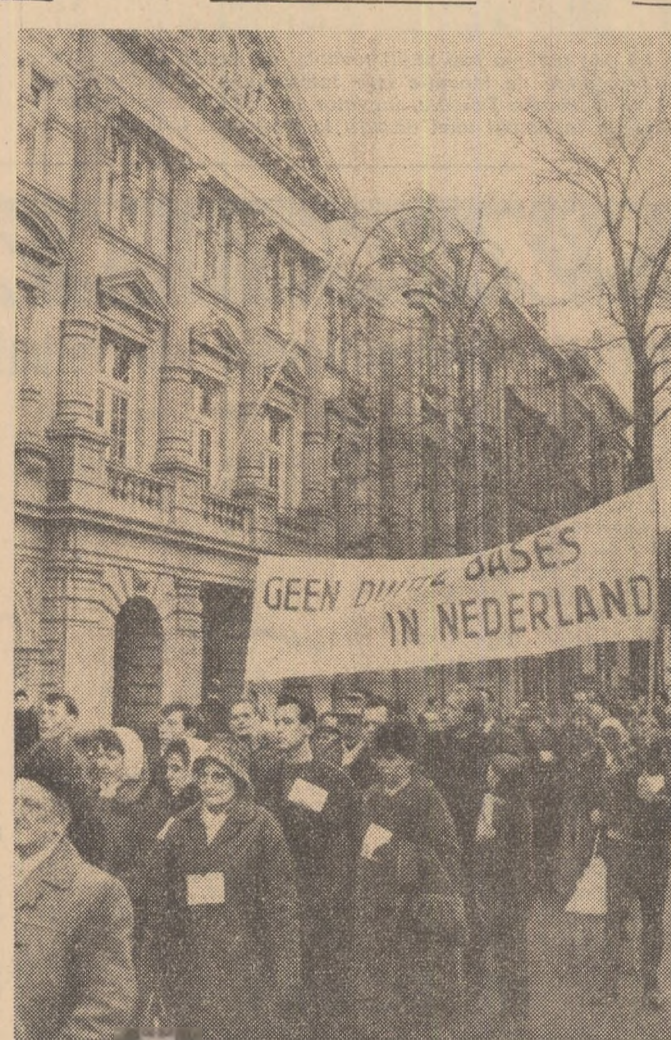
Demonstrația populației din Amsterdam împotriva amplasării de trupe ale R.F.G. Germane la Budel, provincia Brabantul de Nord din Olanda

nerilor francezi și ale celorlalte categorii de oameni ai muncii din Franța. În timp ce greva minerilor continuă, mișcarea de solidaritate cu greviștii se lărgește neîntrerupt. Numai în regiunea pariziană a fost strinsă pînă la 3 aprilie suma de 310 milioane franci vechi. Totodată, congresul Sindicatului național al învățămintului, care și desfășoară lucrările la Toulouse, a hotărât alocarea unei sume de 3 milioane franci pentru mizerii greviști. Continuă, de asemenea, stringerea de fonduri în toate departamentele Franței. În zilele de 1 și 2 aprilie în departamentul Morbihan a fost strinsă suma de 4 milioane franci, iar în departamentul Vienne, 3 milioane franci. La 3 aprilie, Consiliul municipal al orașului Dijon, al cărui primar este canonicul Kir, a votat o subvenție de un milion de franci drept fond de solidaritate cu minerii francezi.