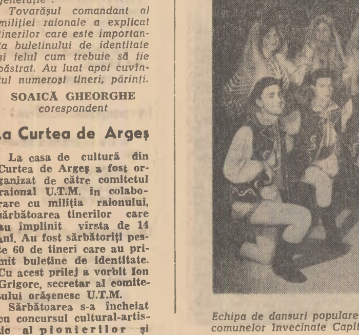
Echipa de dansuri populare a Casei de cultură din raionul 10 Februarie cunoscută publicului bucureștean și celui din raza comunelor învecinate Capitalei, unde a dat numeroase spectacole. Iată pe membrii acestei formații în timpul unei repetiții.

● Întreprinderea de foraj Moinești și-a realizat și ea planul trimestrial de colectare a fontei. Au fost trimise oțelărilor, prin I.C.M., 21 tone.