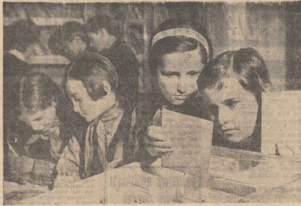
Biblioteca Școlii medii din Petroșani dispune de peste zece mii de volume dintre care un număr însemnat de cărți datinează din secolul al XVIII-lea de o mare valoare documentară. Zilnic, biblioteca este frecventată de cititori de toate vârstele. Iată-i la țigărie pe citiva dintre cei mai tineri cititori.