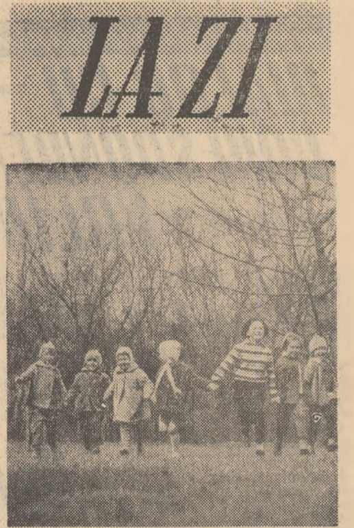
Întîlnire cu primăvara în Parcul Herastrău