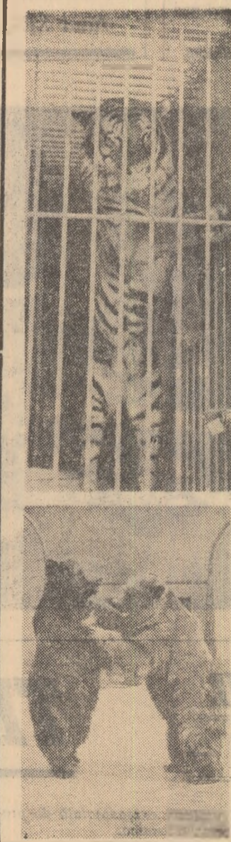
Grădina Zoologică de la Băneasa își așteaptă oaspeții

Țesăturile au fost analizate fir cu fir și s-a stabilit că ele proveneau din China, fiind dintre cele mai vechi țesături de mătase chinezească descoperite în Europa.