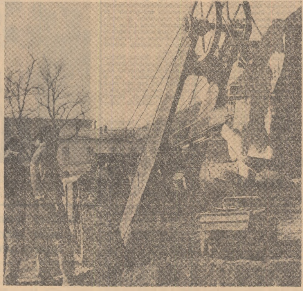
Recent, în orașul Piatra Neamț s-a desfurat un șantier de construcții de locuințe. Așa, excavatoarele „mușca” din pînă în locul unde se va înălța, nu peste mult timp, un bloc cu 9 etaje