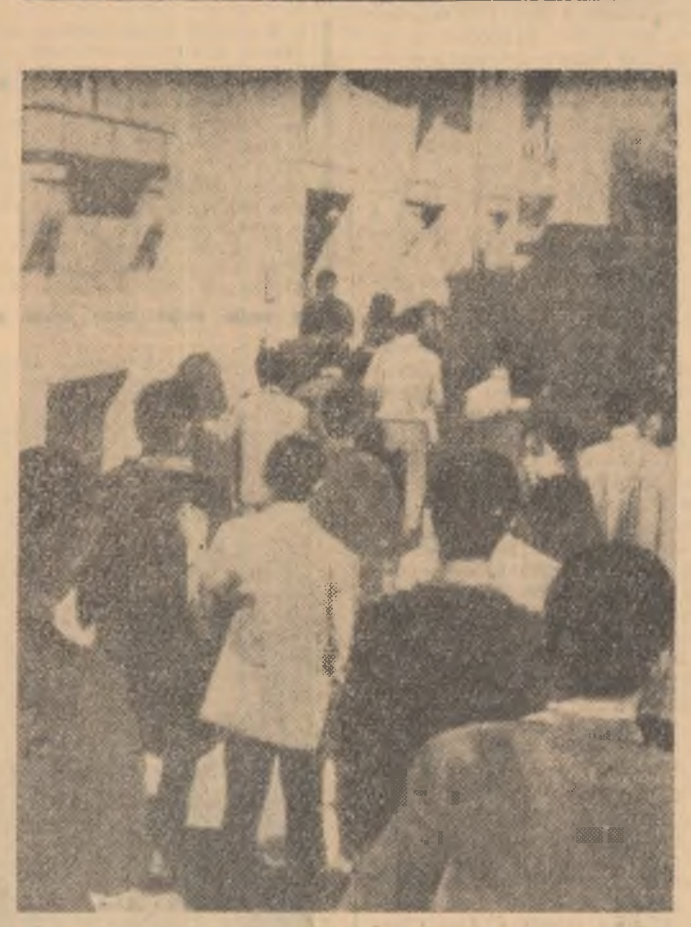
Un grup numeros de studenți iranieni care învață la Roma a ocupat de curind ambasada Iranului din capitala italiană, ca semn de protest împotriva persecuțiilor antidemocratice din țara lor.