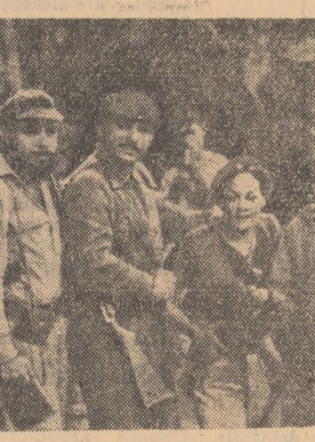
VENEZUELA: Regimul reacționar al lui Betancourt a stîrnit luptă cu arma în mîină pentru eliberarea țării lor de sub dictatură.

Oficialitățile franceze din Leopoldville, relatează corespondentul amintit, dezamint intenția de atragere a Congoului în Uniunea afro-malgaze. Observatorii din capitala Congoului, notează însă corespondentul cu vădită iritare (precum și bineînțeles de eventuala lezare în primul rînd a intereselor S.U.A.) „sînt de părere că Franța va face tot ce îi