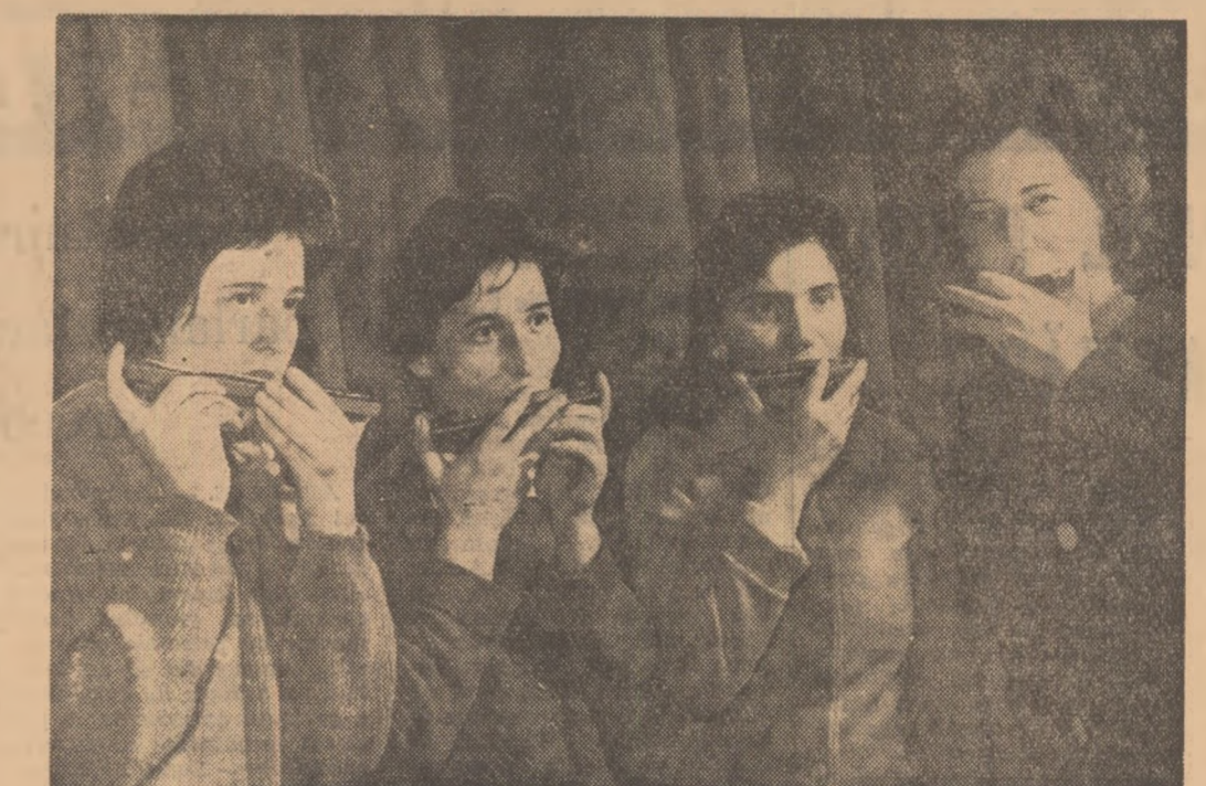
Cvartetul de muzicuțe al Intreprinderii „Dorobanțul” din Ploiești

Aceasta cu un timp în urmă. De-o bucată de vreme însă... Și aici e explicația multora dintre neajunsuri.