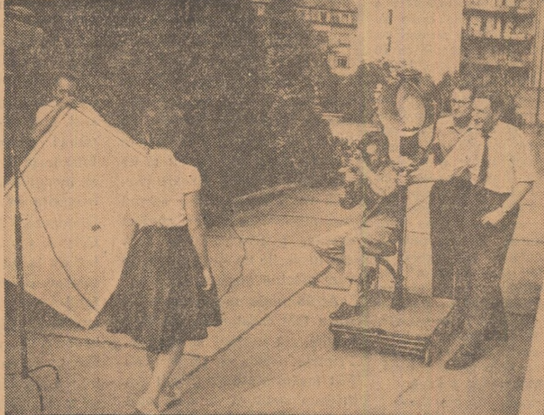
Atențiune, filmăm! (Scenă de lucru la studioul cinematografic de amatori al clubului C.F.R. „16 Februarie 1933”-Timișoara)

În perioada 15 aprilie — 15 iunie, în regiunea Crișana se desfășoară un festival al filmului pentru tineret și elevi organizat de comitetul regional U.T.M. și comitetul regional de cultură și artă.