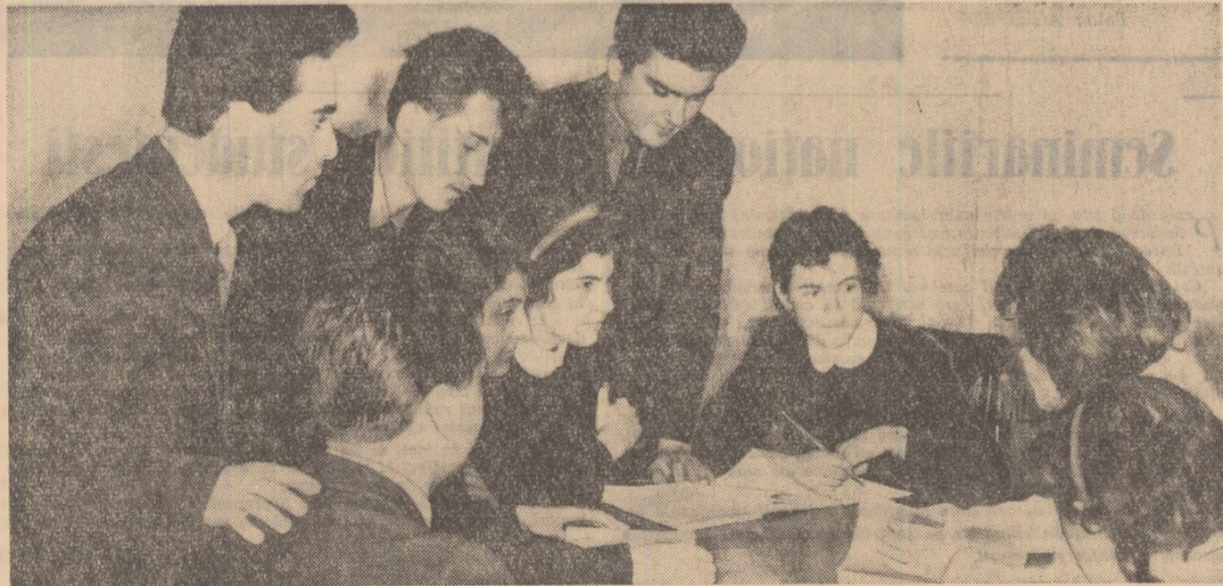
Tinerii din fotografie sînt elevi în clasa a XI-a A la Școala medie nr. 3 din Brăila. În această ultimă etapă a anului școlar ei folosesc tot mai des consultațiile colective — care și-au dovedit din plin eficacitatea.

I n cadrul pregătirilor pentru examenul de maturitate ca și pentru examenul de admitere în învățămîntul superior la care se vor înscrie apoi actualii elevi din clasa a XI-a, un important mijloc de consolidare și verificare a cunoștințelor îl reprezintă lecțiile recapitulative. Peste puțin timp, elevii din clasa a XI-a de la toate școlile medii de cultură generală din țară vor termina de parcurs materia planificată și pentru trimestrul al III-lea și vor începe lecțiile de recapitulare generală axate pe teme mari, desprînse din întreaga materie prevăzută pentru clasa a XI-a, iar acolo unde este cazul vor fi incluse și elemente din clasele a IX-a și a X-a. Pentru ca aceste lecții să-și atingă importanța lor scop, conducerea Școlii medii nr. 5 din Iași, sub îndrumarea organizației de bază P.M.R., a luat o serie de măsuri concrete menite să ducă și în actuala etapă la contrecararea în vîna defășurare a procesului de învățare atît a elevilor și cadrelor didactice, cît și a părin-