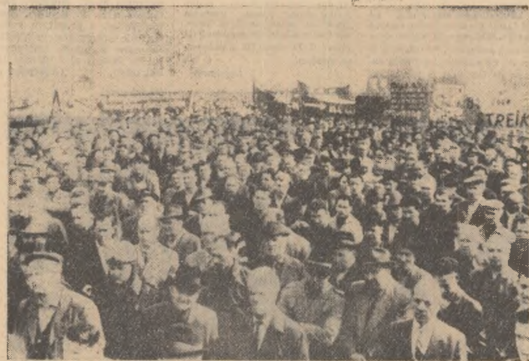
Recent au avut loc în R.F. Germană mitinguri ale metalurgistilor din centrele: Baden, Württemberg, Nordwürttemberg - Nordbaden, Südwürttemberg - Hohenzollern și alte localități. Ei au cerut majorarea salariilor.

Agenția United Press International relevă cu remaniența guvernului Adoula pune capăt, cel puțin temporar, unei crize serioase de guvern care dăinuiește de patru luni și jumătate.