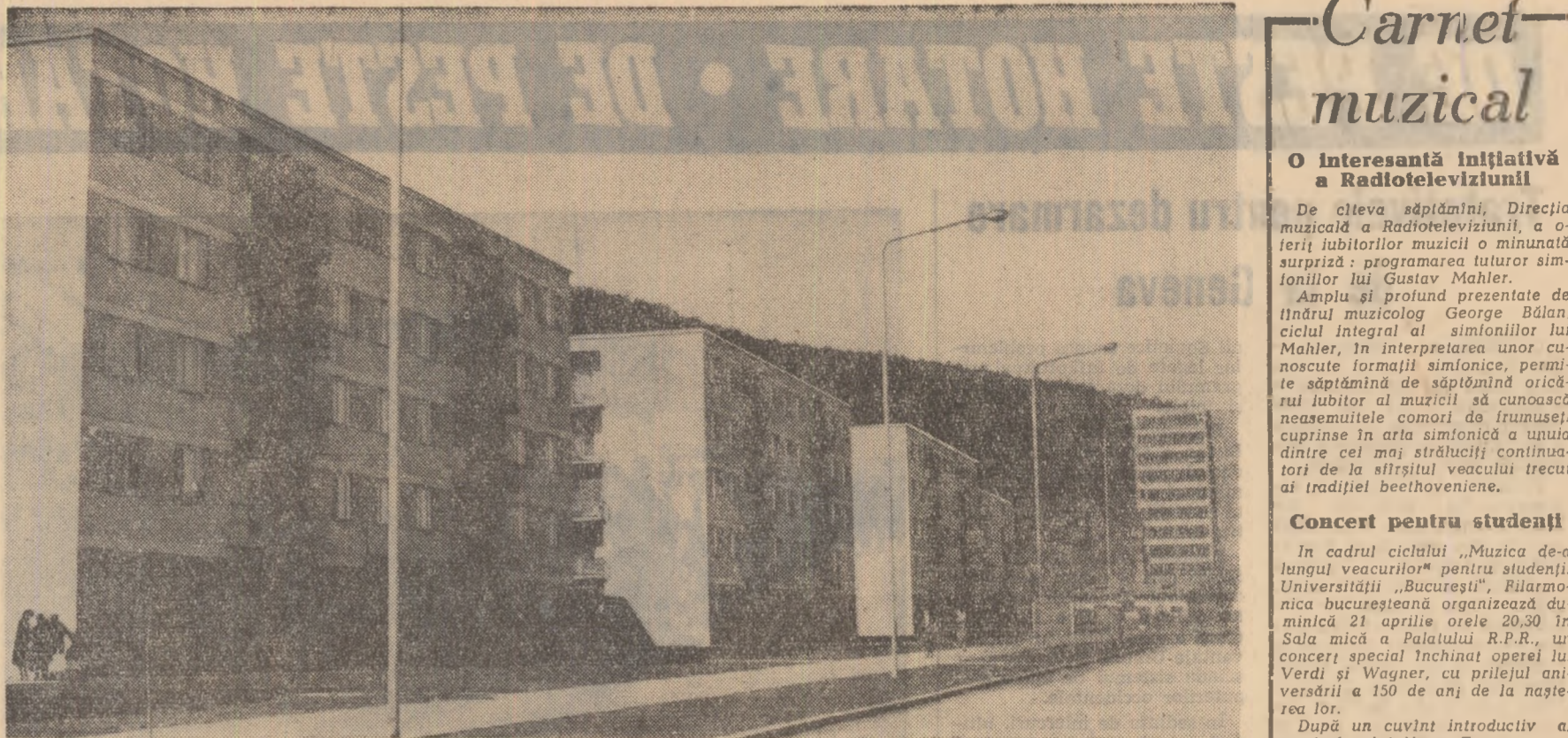
Construcții noi în Piatra Neamț

Colectivul sectorului nostru, toți muncitorii, inginerii și tehnicienii sînt ferm convinși că aplicarea metodelor înalte în forță constituie o cale sigură de sporire necontenită a productivității muncii — sarcină importantă pusă de partid în fața tuturor oamenilor muncii din patria noastră. Pînă la sfîrșitul anului vom extinde forjarea pe maxiprese a încă 15 reperi ceea ce va duce la creșterea productivității muncii între 7 și 15 la sută. Vom trece apoi în mod experimental la matrițarea danturii pinionelor cilindrice și vom extinde la încă 10 reperi încălzirea semifabricatelor prin curenți de înaltă frecvență.