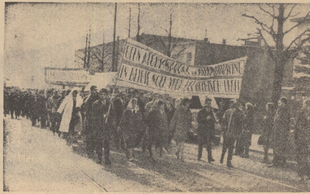
BRUXELLES. Peste 10 000 de oameni au participat la demonstrația împotriva armelor atomice de la Bruxelles, organizată din inițiativa organizațiilor democratice belgiene. La această demonstrație au participat delegații din Anglia, Olanda, Germania occidentală și Japonia.

nii Sovietice asupra problemei legate de înfăptuirea programului dezarmării generale și totale. Reprezentantul Canadei, Burns, a susținut planul occidental pentru dezarmare, afirmînd că acest plan ar prezenta condiții mai favorabile pentru control. Reprezentantul S.U.A., Ch. Stelle, care a urmat la cuvînt, a susținut că lichidarea bazelor militare străine în prima etapă a dezarmării, ar oferi avantaje Uniunii Sovietice și ar scinda sistemul de apărare al puterilor occidentale. În ședința de miercuri, ultimul a luat cuvîntul delegatul Indiei, Lal, care a sprijinit apelul delegatului Braziliei de a se trece la tratative realiste. Următoarea ședință a Comitetului celor 18 va avea loc vineri, 19 aprilie.