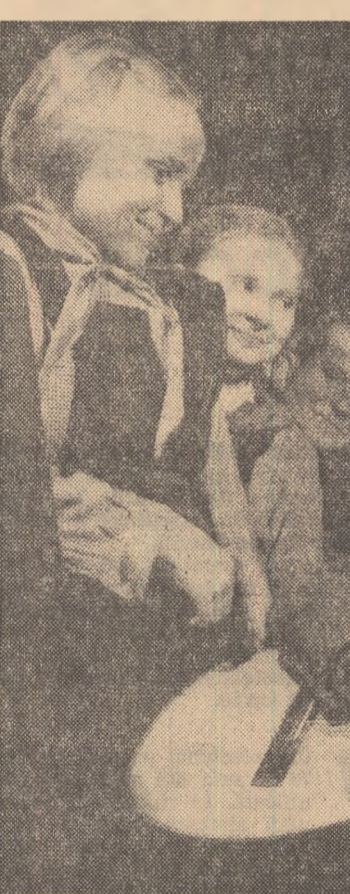
Într-o pauză, la „Colțul pionierilor” din școala de 8 ani din comuna Arduș, regiunea Maramureș.

plînește prin studiul individual, în deosebi operațiunile de memorizare: pe baza lecției predate — și care de regulă cuprinde totalitatea cunoștințelor ce se cer însușite — elevul se pregătește ca în ziua următoare să fie ascultat, făcînd dovada asimilării temei respective. În universitate crește greutatea specifică a studiului individual al studentului. Dar nu numai atât. Spre deosebire de modul de a învăța în școlile noastre, în care controlul asimilării cunoștințelor se face de regulă abia la examen după 1—3 trimestre — impune cerințe cu totul deosebite studiului individual. Acesta reprezintă înainte de toate un mod creator de a aprofunda materialul de studiu, o adevărată activitate de sine