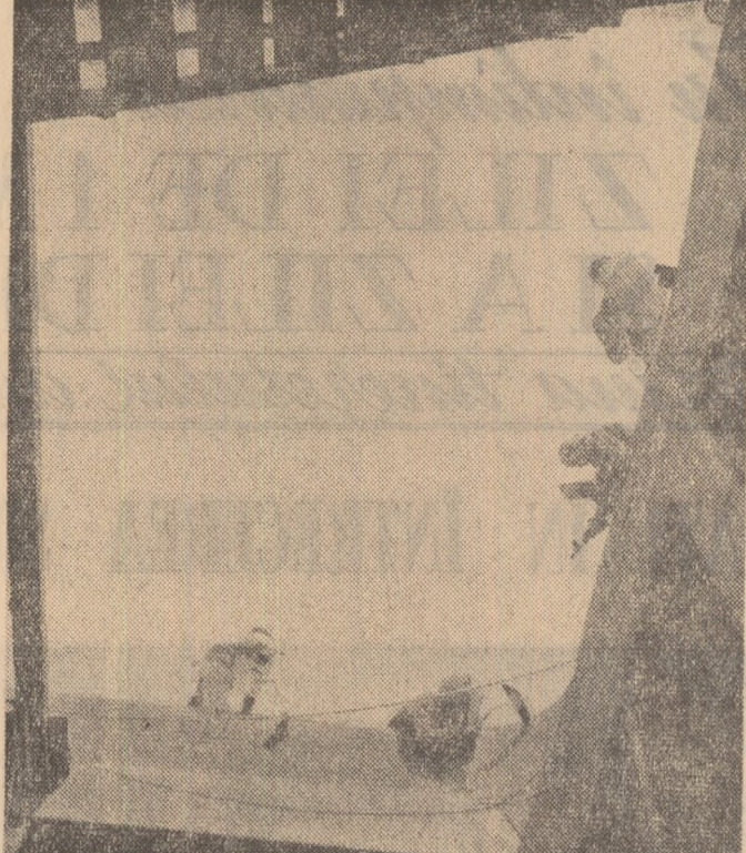
Șantierea Naval Galați. Se construiește un nou cargou de 4500 tone.