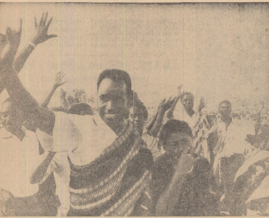
Miting la Lusaka, capitala Rhodesiei de nord, în favoarea dobândirii independenței, convocat de Partidul unit al independenței naționale de sub conducerea lui Kenneth Kaunda.

Pe toate continentele, tinerii iubitori de pace sărbătoresc astăzi Ziua mondială a luptă împotriva colonialismului, pentru coexistență pașnică. Este una din acele sărbători ale generației tinere a lumii, devenită tradițională, sărbătoare cu un puternic răsunet pretutindeni, în toate țările. În această zi cei tineri își unesc glasul cu cel al popoarelor lor spre a cere să se pună capăt odiosului sistem colonialist, să se acorde libertate popoarelor ce mai sînt oprite de către colonialiști, să înceteze tentativele neocolonialiste la adresa independenței și suveranității statelor noi ce abia recent au pornit pe drumul dezvoltării de sine stătătoare. Generația tinăra se pronunță cu fermitate pentru apărarea păcii, pentru victoria ideilor coexistenței pașnice între state cu sisteme social-politice diferite, pentru dezarmare generală și totală, pentru zădărnicierea uneltirilor cercurilor imperialiste.