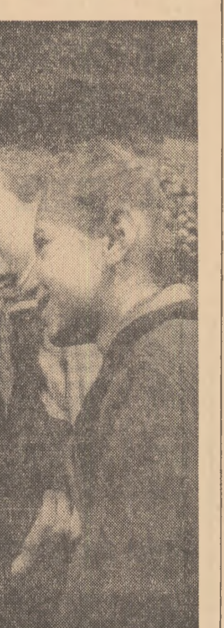
Într-o pauză, la „Colțul pionierilor” din școala de 8 ani din comuna Arduș, regiunea Maramureș.