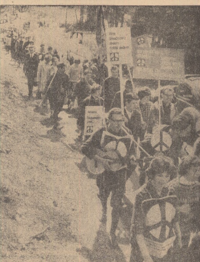
Din inițiativa organizațiilor adversarilor războiului atomic s-au desfășurat în numeroase regiuni ale R.F. Germane marșuri antiatomice. La aceste marșuri s-au alăturat pe drum numeroși alți cetățeni de prin orase și satele străbătute de participanți. În fotografie: un marș pornit spre München.