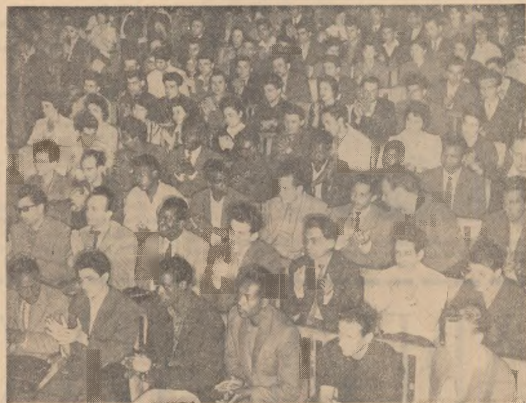
Un aspect de la adunare.