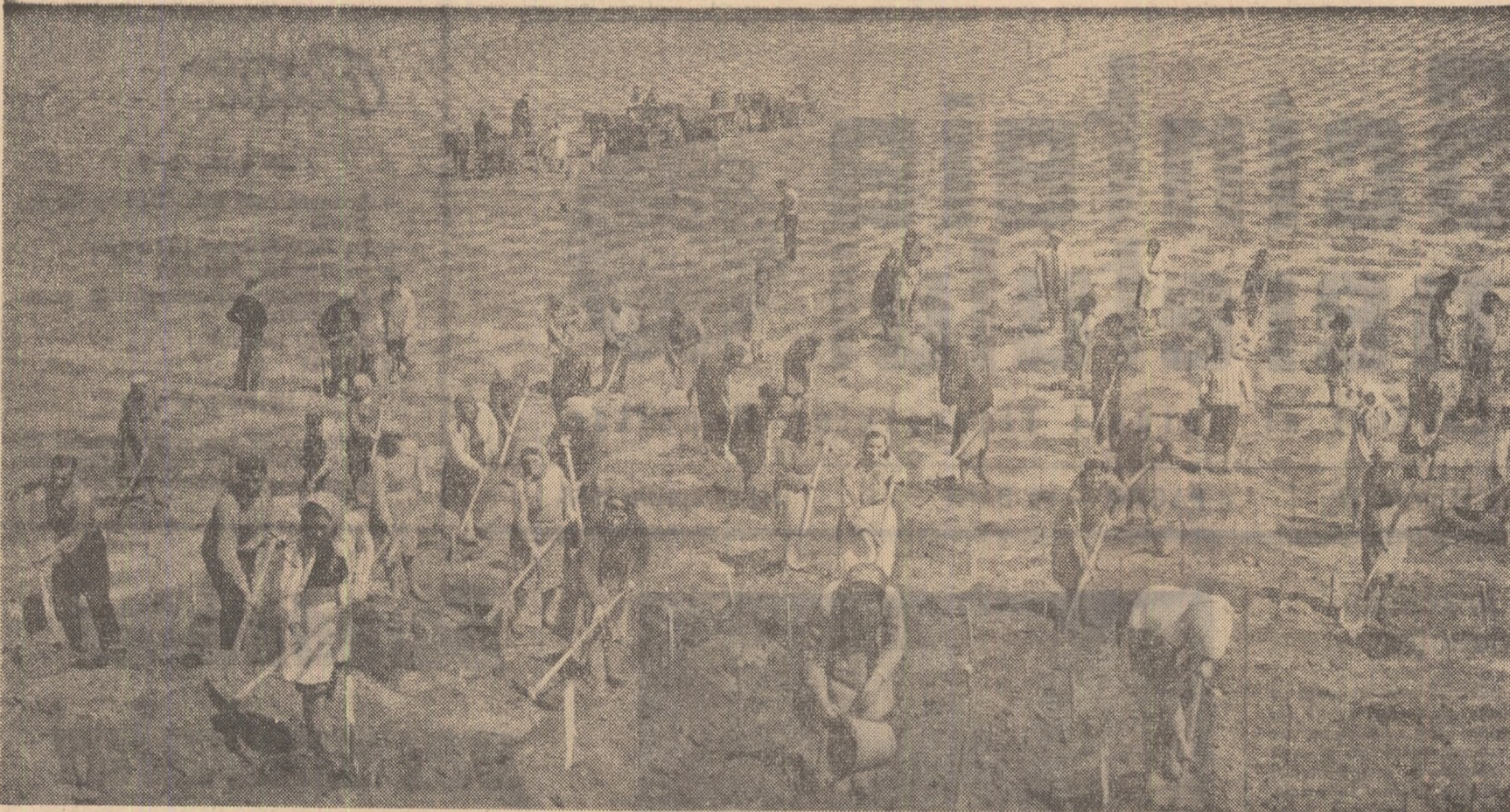
Colectiviștii din comuna Gemenale, raionul Brăila, au prevăzut să planteze în primăvara aceasta cu viță din soiuri de mare productivitate o suprafață de 40 de hectare, împotriva culturii cerealelor. Este momentul potrivit pentru înfăptuirea acestui plan. De aceea, membrii brigăzii întâi urgencează acum lucrările