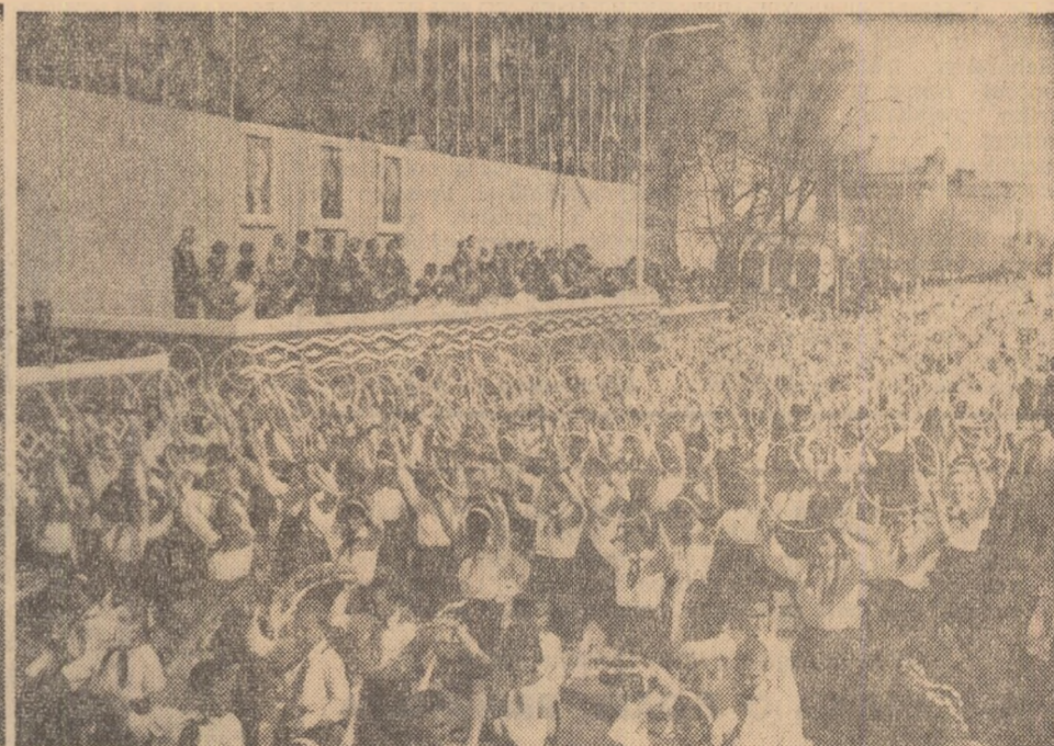
Și la Galați pionierii au adus în fața tribunelor nu numai urale și cîntecul tîneretii ci și un mînușchi de jocuri sportive.