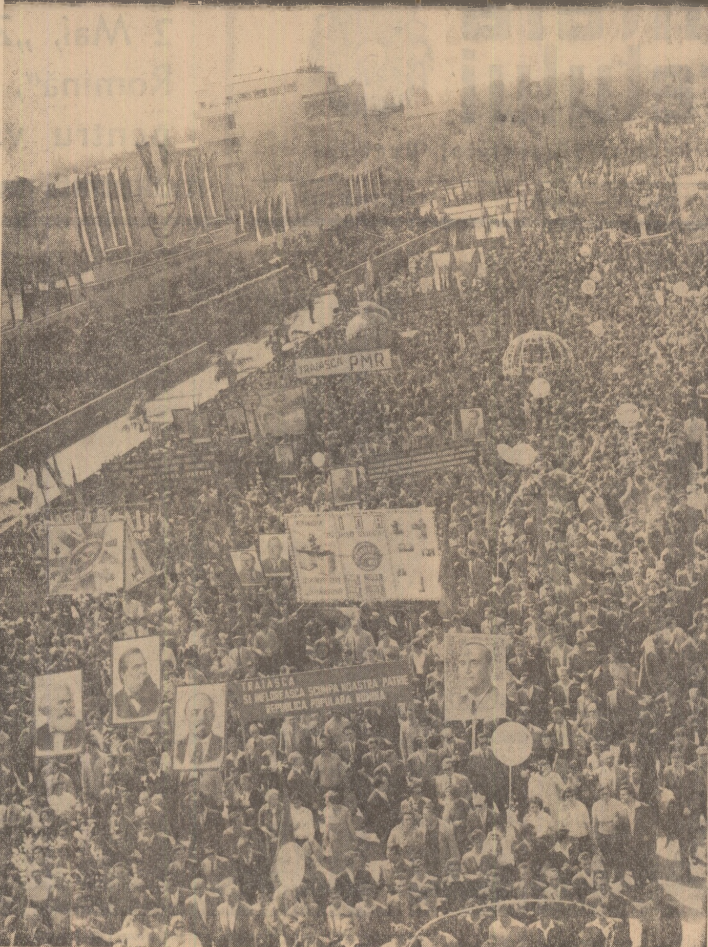
Piața Aviatorilor este inundată de mulțimea demonstrațiilor

Trecînd prin fața tribunelor, reprezentanții primei regiuni din țară cu agricultura colectivizată au raportat că astăzi pe ogoarele dobrogene muncește, înfrunțată, o puternică familie de colectivități a cărei avere obstească trece de 1 miliard de lei. Îmbrăcați în pitorești costume naționale, au trecut, prin fața tribunelor din orașul Timișoara, braț la braț, mecanizatorii și colectiviiștii romîni, maghiari, germani și sirbi din unitățile agricole socialiste din Giarmata, Freidorf, Carani, Sag, Giroc — toți pînă de brațe aceeași piine, același snop de spice — raportînd cu minărie terminarea înăsmînțării de primăvară. Au demonstrat de ziua lui înții mai, raportînd partidului că au terminat cu înăsmînțatul porumbului, colectiviiștii din Galați, cei din regiunea București, din unele raioane ale regiunilor Argeș, Crișana, Ploiești și Oltenia. Numeroși mecanizatori, lucrători din gospodăriile de stat și colectivități, pentru terminarea înăsmînțării într-un timp cit mai scurt, au sărbătorit 1 Mai, muncind.