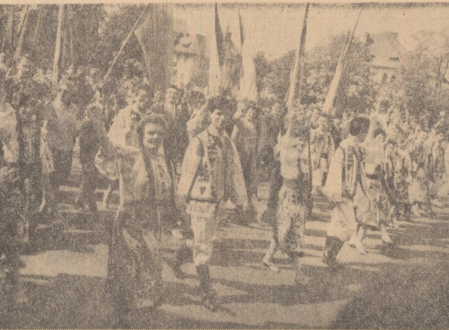
Drapele fluturînd în adierea primăverii, multe, multe flori, tinerețe, optimism. Aspect de la demonstrația oamenilor muncii din Roșietti.