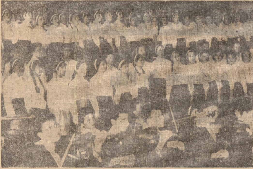
În toată după-amiaza zilei, artiștii amatori și-au dezvăluit în fața sutelor de spectatori talentele lor.

O zi de mai, poate una dintre cele mai frumoase zile de mai. Frumoasă pentru soarele ei strălucitor și festiv, pentru verdele crud al parcurilor, pentru mireasma florilor de țes, dar de o mie de ori mai frumoasă pentru inflorescențele unel sărbători a tineretii cu tot ce poate să demonstreze la o asemenea sărbătoare un tineret de sute și sute de mii, o generație a hărniciei, a sănătății, a frumuseții, a elanurilor creatoare, în această zi de sărbătoare, întregul nostru tineret își îndreaptă gândurile pline de recunoștință și dragoste fierbinte către Partidul Muncitoresc Român, mulțumindu-i din inimă pentru grija cu care este înconjurat, pentru condițiile minunate de muncă și de viață. „Ziua tineretului din R.P.R.” desfășurată pe toate coordonatele geografice ale țării a concentrat simbolic în manifestările ei tot ce face organic parte din viața, din năzuințele, din preocupările de fiecare zi, de fiecare clipă ale tineretului generat, permanent prezentă acolo unde prin muncă și neobosită se nase marile înfăptuiri ale poporului condus de partid. Un reportaj al acestei zile e greu de încheiat din mii și mii de imagini desfășurate în același timp pe un vast cimp sărbătoresc. Dar tinărul nostru cititor a fost ei însuși un sărbătorit, un participant entuziast, unul dintre cei care au întregit frumusețile acestei zile. Noi îi vom da doar prilejul să-și aducă aminte.