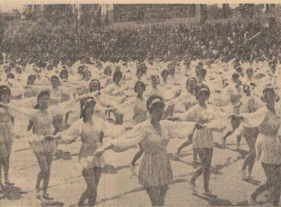
Buchete de flori albe, purtate cu gingășie, cu grație.

Reportaj realizat de: V. CĂBULEA, V. CONSTANTINESCU, E. FLORESCU, V. RANGA, A. I. ZAINESCU și corespondenții regionali al zărilor.