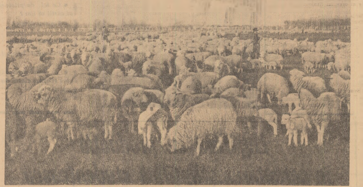
Pe pășunea bine întreținută, zile gospodăriei colective din Rîmnicelu, raionul Brăila, găsesc hrană din belșug.

În cursul lunii mai, datorită și faptului că volumul de lu-