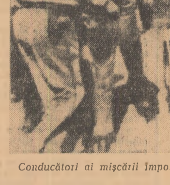
Conducătorii ai mișcării împotriva segregăției rasiale arestați de poliția din Birmingham

În același timp, agenția France Presse relevă că opt negri din Attalla (statul Alabama) care și-au propus să străbată pe jos statul Alabama pentru a continua marșul întreprins de albul William Moore, care a fost asasinat, au fost arestați la cîteva minute după ce au plecat. Ca și Moore cei opt negri purtau pancarte în care cereau acordarea de drepturi populare de culoare.