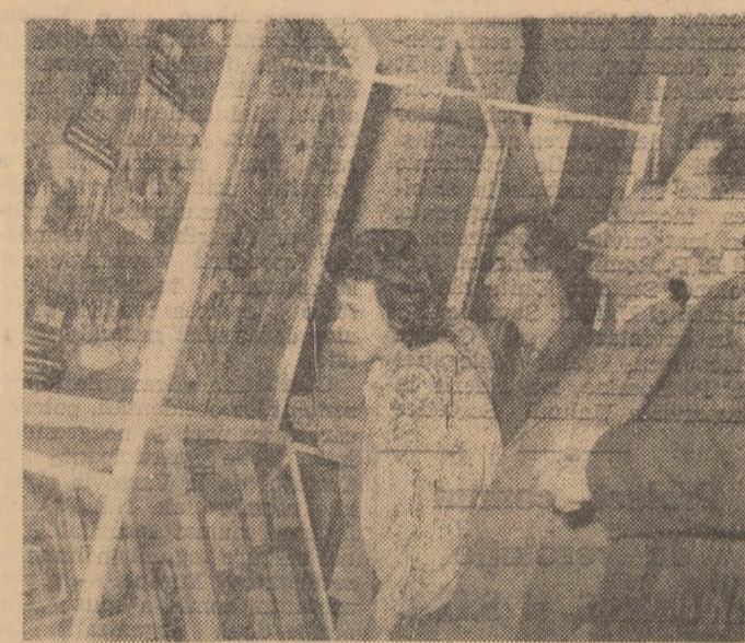
La expoziția filatelică O.N.U.