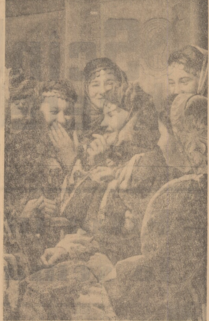
Tinere din comuna Mitnicul Mare, raionul Lugoj, pregătind un nou spectacol al brigăzii artistice.

N. ARSENI corespondentul „Știntei tineretului” pentru regiunea Dobrogea