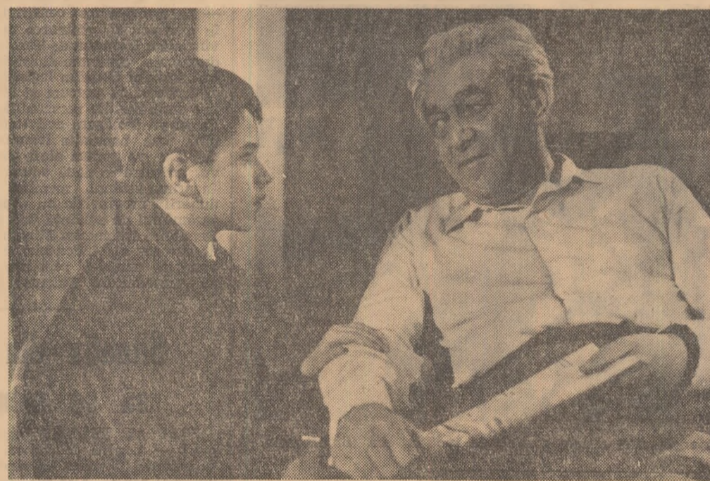
Cadru din film

● Reprezentanții de fotbal a Braziliei și-a continuat turneul în Europa, întîlnind joi seara la Amsterdam, în fața a 70.000 de spectatori, echipa Olandei. Meciu,