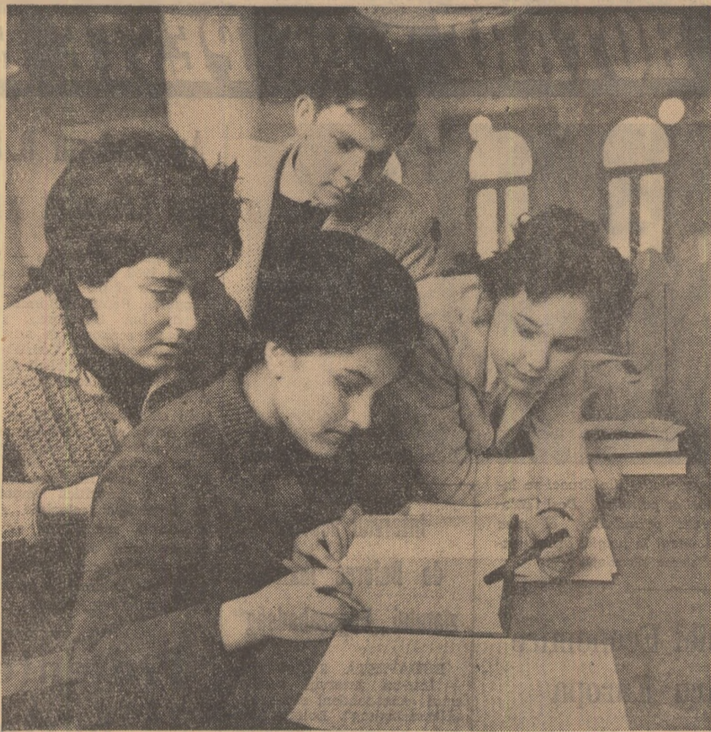
La biblioteca centrală a Institutului de științe economice studenții din anul I al Facultății de finanțe consultă materialul bibliografic necesar viitorului seminar.