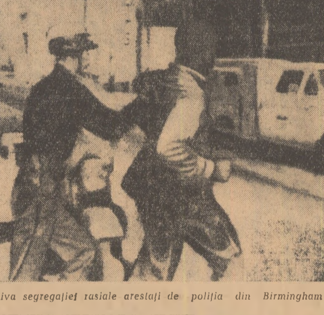
Conducătorii ai mișcării împotriva segregăției rasiale arestați de poliția din Birmingham