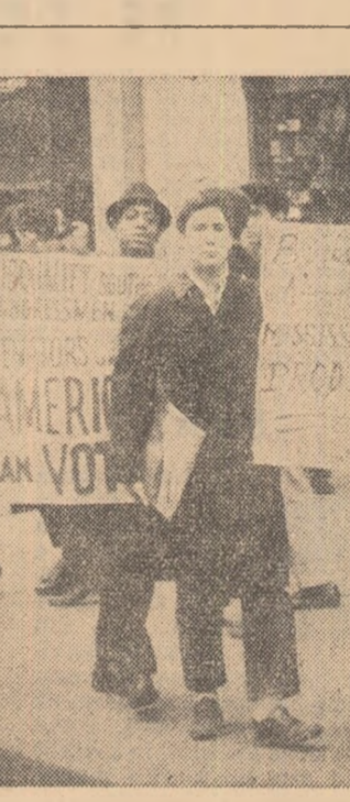
La New-York a avut loc recent o demonstrație de protest împotriva terorii pe care o exercită poliția din statul Mississippi din S.U.A., împotriva populației de culoare. Fotografia redă un aspect din timpul demonstrației de la New York.

MOSCOVA 4 (Agerpres). — Simbăta a avut loc la Moscova o reuniune festivă consacrată zilei presei sovietice care se sărbătorește în fiecare an la 5 mai, ziua apariției primului număr al ziarului „Pravda”. La reuniunea festivă au luat parte Leonid Ilicișov, secretar al C.C. al P.C.U.S., Pavel Satiukov, redactor șef al ziarului „Pravda” președintele Comitetului Uniunii Ziaristilor sovietici, Alexei Romanov, președintele Comitetului de Stat Uniunea-republican pentru cinematografie de pe lângă Consiliul de Miniștri al U.R.S.S., redactori șefi, redactori ai revistelor și ziarelor.