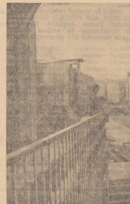
„Aici, pe dealul de sud — orașul studenților”.

Un aparat de fotografiat neînșufleț ar observa acum numai mormane de p-