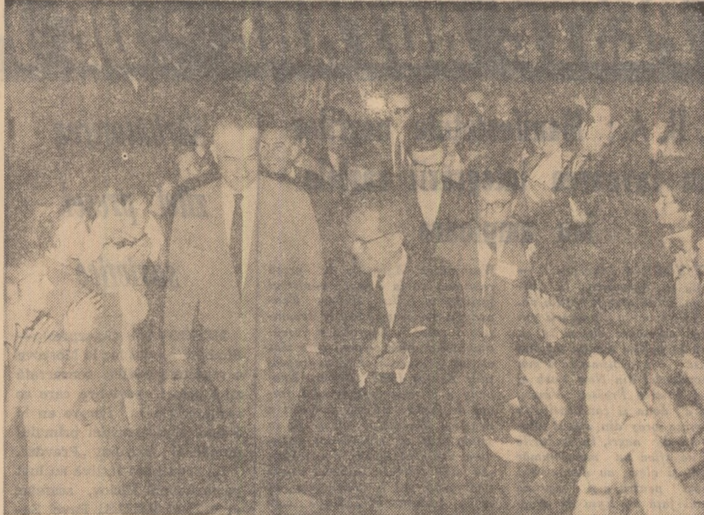
Vizita secretarului general al O.N.U., U Thant la Complexul studențesc de la Grozăvești