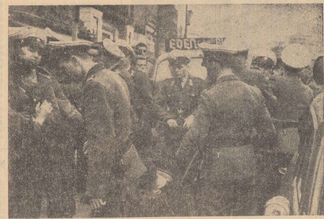
Studenți originari din Spania, alături în Berlinul occidental, au organizat o demonstrație de protest împotriva barbarilor săvârșite de regimul franchist. Polițiștii vest-berlinezi au intervenit brutal, arestând un mare număr de manifestanți.

colaborator al secției de informații a ambasadei Spaniei la Londra pentru a lua cuvintul la o intrunire, la 3 mai studenții de la Universitatea din Oxford au organizat o demonstrație de protest împotriva executării lui Julian Grimau. Un student a înmănat diplomaților spanioli o petiție semnată de peste 100 de studenți în care se cere să fie puși în libertate toți deținuții politici, să fie restabilesc toate drepturile sindicatelor și să se acorde libertăți democratice poporului spaniol. Aproximativ 40 de studenți au organizat pichet în jurul sălii unde a luat cuvintul diplomatul spaniol. Studenții scandau: „Grimau!”, „Grimau!”. Intre polițiștii și studenții au avut loc ciocniri. După aceea studenții au demonstrat pe străzile Oxfordului, purtând pancarte cu lozinci antifranchiste.