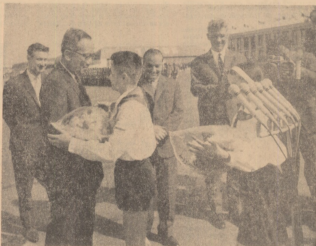
La sosire, pe aeroportul Băneasa

Permiteți-mi ca, din înșărcinarea și în numele guvernului lui, exprimînd sentimentele cu care vă întâmpinăm poporul romîn, să vă adresez un călduros