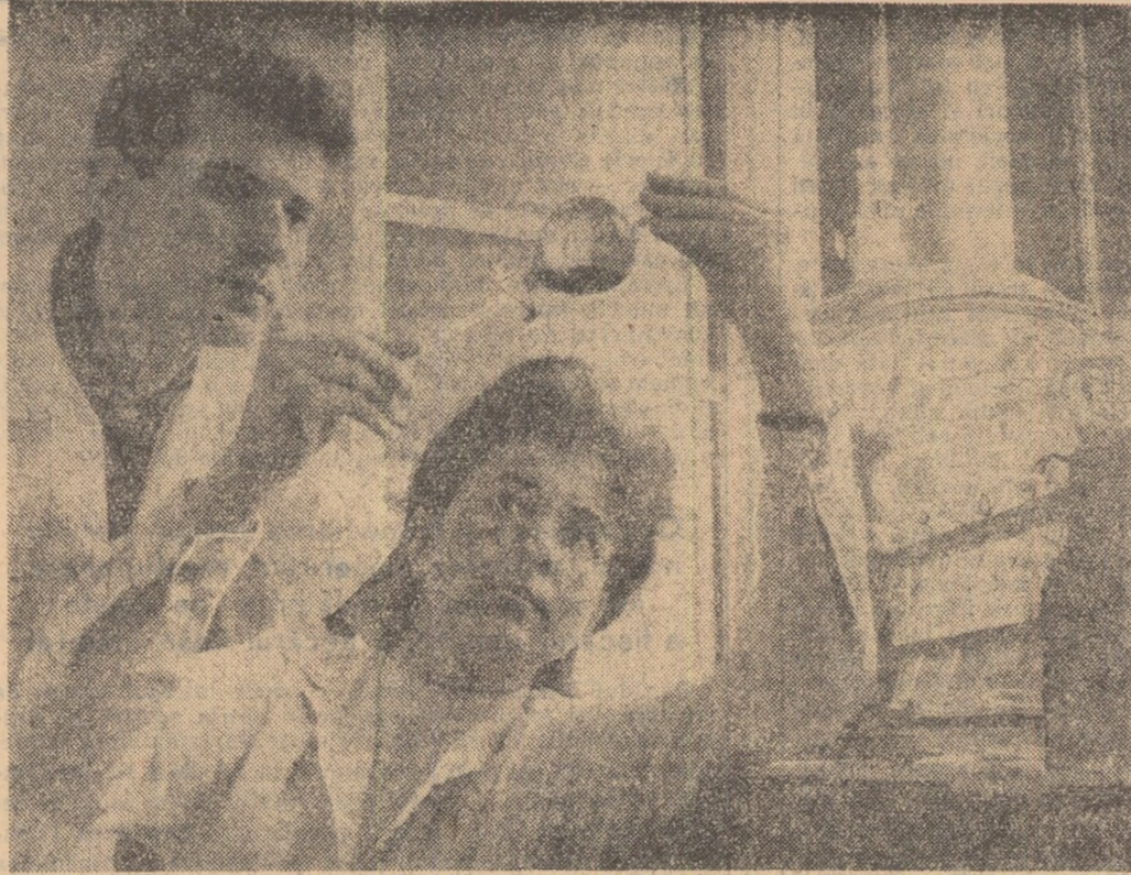
Studenți din anul III într-unul din laboratoarele Institutului de petrol, gaze și geologie din Capitală.