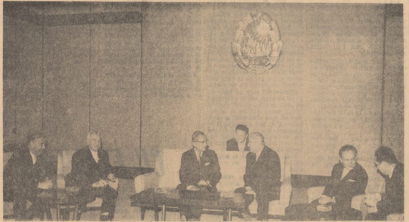
La Palatul Consiliului de Stat