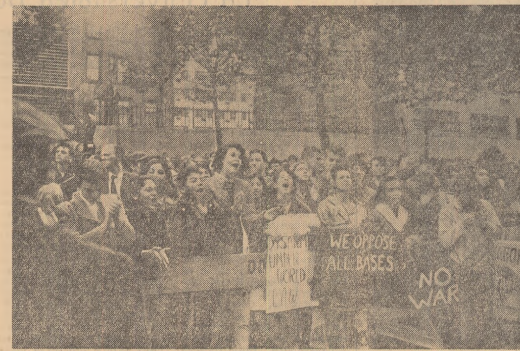
Tinerii din S.U.A. iau parte activă la acțiunile în sprijinul păcii și dezarmării. În fotografia de sus se produc un astfel, un aspect de la o demonstrație pentru dezarmare a tinerilor din Minneapolis.

BRISBANE. — Agenția Reuter anunță că la Cooktown, provincia australiană Queensland, o fată de 15 ani a ucis cu un topor un șarpe python lung de peste trei metri și l-a lăsat în buchi pentru a salva pe pisica ei înghită de python. Pisica a scăpat cu viață nesulțurînd decît câteva zgîrțituri.