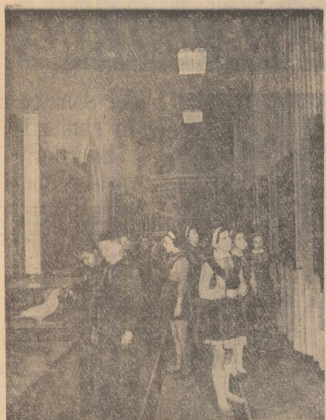
La muzeul regional Oltenia din Craiova a fost deschis de curând o expoziție permanentă de științele naturii. Elevii din localitate vizitează noua expoziție.