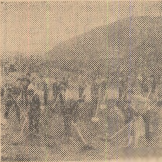
Mii de tineri din Brașov lucrează la înfrumusețarea orașului. În fotografie: un grup de muncitori de la Uzina Șteagul roșu și elene de la Școala medie din Săcele, lucrînd la nivelarea de teren din pasajul Dirste.

CLUJ (de la corespondentul nostru). — În ultimele zile, tinerii din raionul Dej au curățat 203 ha pășune. În zilele de vineri, simbătă și duminică, tinerii din C.A.C. Zalău au plantat 14.000 puieti și au efectuat lucrări de întreținere pe 48 ha de pășune. Duminică, mobilizați de organizația U.T.M., tinerii din Heanda, au defrișat un hectar pășune și au terminat de plantat 12.500 de puieti. Nu cu mult timp în urmă, 1.200 de tineri din orașul Dej au contribuit prin muncă patriotică la înfrumusețarea orașului, la transportarea materialelor de construcție pe unele șantiere ale orașului.