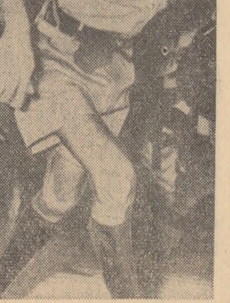
SINGAPORE. Aspect din timpul unei recente ciocniri între poliție și un grup de demonstrații care manifestau împotriva creării Federației Malaezeze.