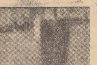
BIRMINGHAM, (S.U.A.). Un negru maltrat de poliție din cauza că a demonstrat împotriva segregăției rasiale.

După cum se știe, kurzii reprezintă majoritatea populației în regiunile de nord ale Irakului. În timpul regimului lui Kassem, o bună parte a armatei irakiene era angajată în luptele de amploare împotriva partizanilor kurzi care au reușit să obțină controlul în diverse regiuni rurale din nordul Irakului. După lovitură de stat din 8 februarie care a răsturnat regimul lui Kassem, noii conducători ai Irakului, încercînd să-și consolideze poziția, au făcut diferite promisiuni populației kurde și luptele au încetat temporar. Intre o delegație a populației kurde și autoritățile irakiene au avut loc tratative care, însă, s-au dovedit cînd a fi zadarnice deoarece noii conducători ai Irakului nu s-au arătat dispuși să satisfacă revendicările juste ale poporului kurd. Iminența reluării luptelor, a fost subliniată de observatori încă de săptămîna trecută cînd reprezentanții populației kurde nu s-au mai prezentat la tratativele cu autoritățile și au dispărut din Bagdad.