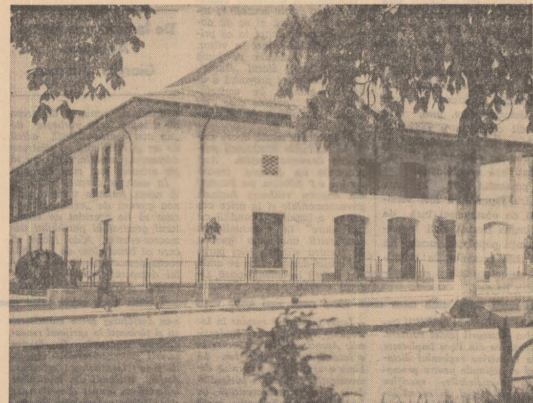
Noua casă de cultură din Calafat, regiunea Oltenia.