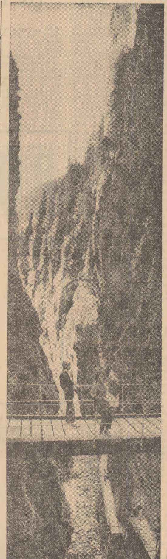
Prin cheile Orzel (Masivul Bucegi)