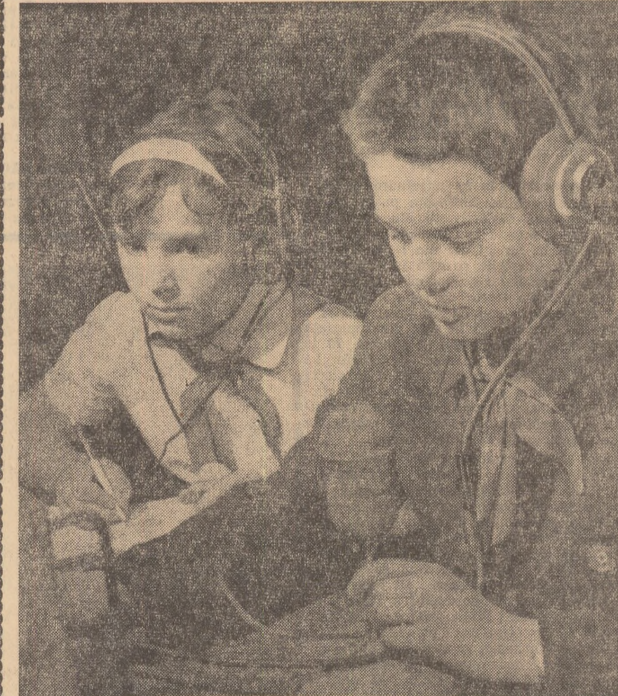
La stația de radioemisie a Patatului pionierilor din București se desfășoară o activitate pasionantă.