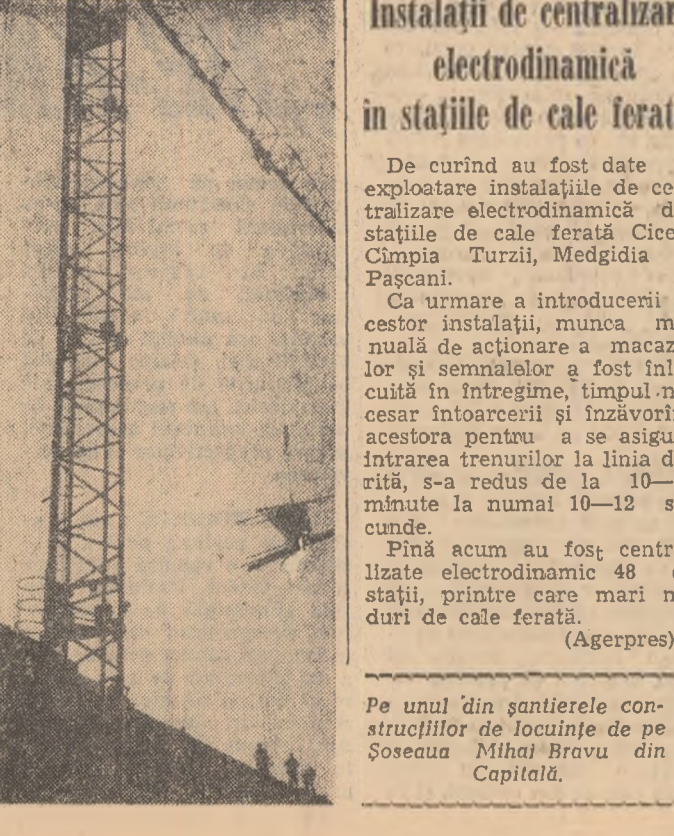
Pe unul din șantierele construcțiilor de locuințe de la Soseaua Mihai Bravu din Capitală.

Instalații de centralizare electrodinamică în stațiile de cale ferată. De curînd au fost date în exploatare instalațiile de centralizare electrodinamică din stațiile de cale ferată Ciceu, Cîmpia Turzii, Medgidia și Pașcani. Aceasta va permite o mai bună funcționare a sistemului de cale ferată.