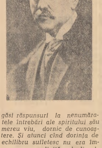
găsi răspunsuri la nenumăratele întrebări ale spiritului său mereu viu, dornic de cunoaștere. Și atunci cînd dorința de echilibru sufletesc nu era împlinită deplin de contactul cu matematica, cu literatura, cu filozofia, cu toate științele pe care și le însușea în școală, elevul făcea apel la muzică, se refugia în tovarășia viitorii, care a contribuit și ea la întregirea personalității omului de știință, sensibil la frumuseți, la disciplina vieții celui care și-a ales un drum greu — drumul cercetării științifice.

Asemenea întrebări am găsit în numeroase scrisori trimise de elevi către redacție. Ca răspuns, inaugurăm în „Pagina elevului” o suită de medaliaoane din viața unor oameni de seamă. În rîndurile de față vom povesti elevilor ceva despre anii de școală ai marelui savant român Georgehe Țițeica.