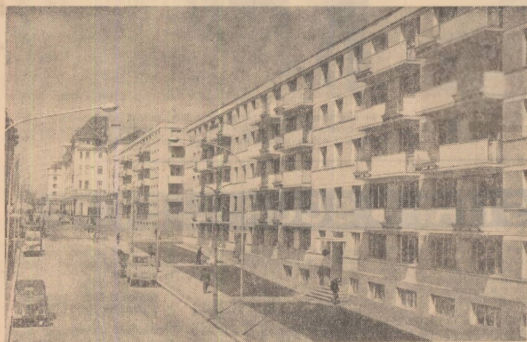
Noi blocuri construite în centrul orașului Craiova

Față de vara anulului trecut, numărul traseelor a crescut cu 48, al curselor cu 320, iar lungimea rețelei cu peste 900 km. Noul orar al autobuzelor a fost editat și se poate procura de la toate agențiile din țară.