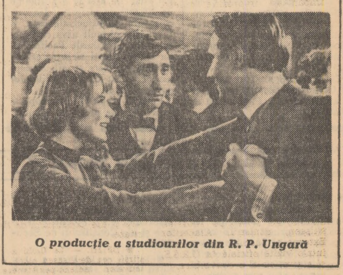
O producție a studiourilor din R. P. Ungară