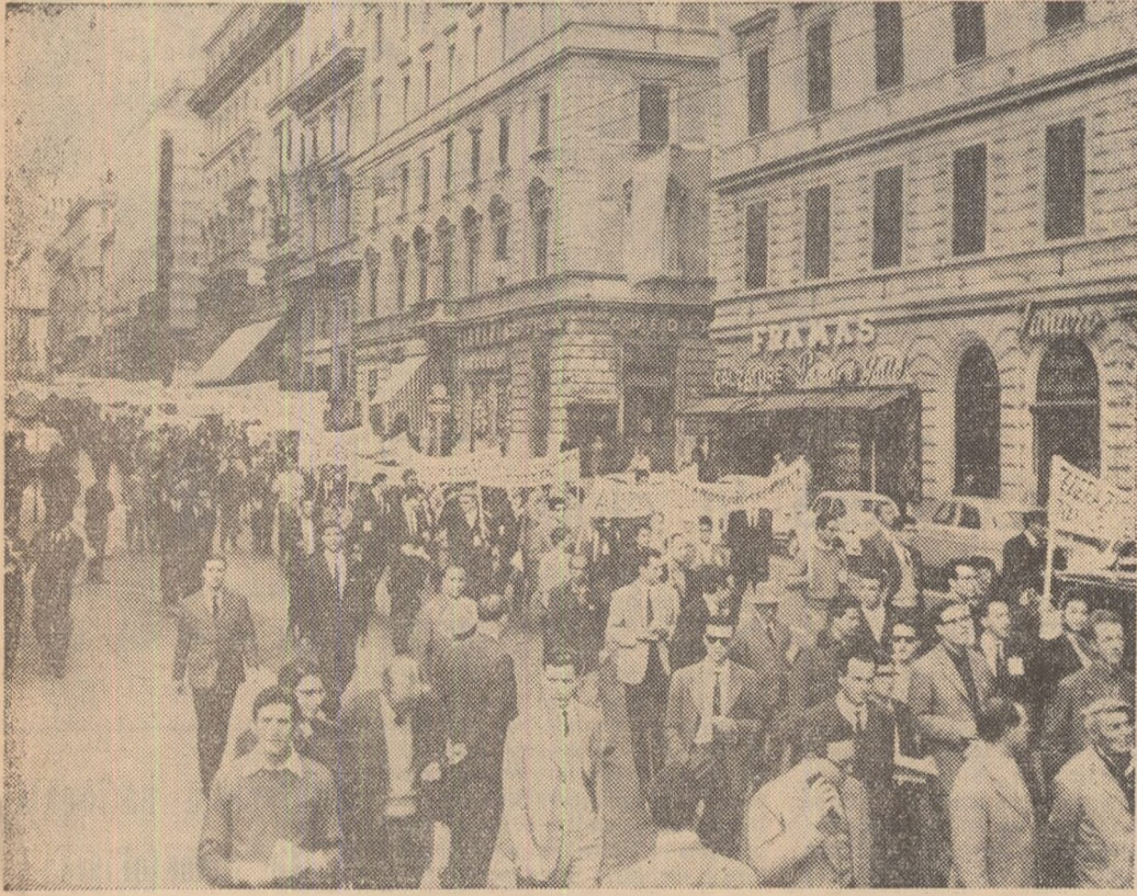
ITALIA: Manifestația de la Roma împotriva cursei înarmării