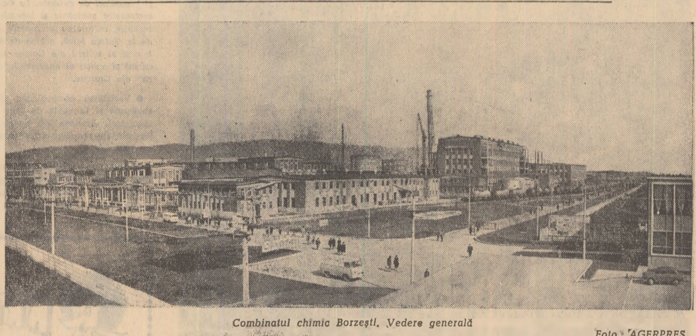
Combinatul chimic Borzești, Vedere generală