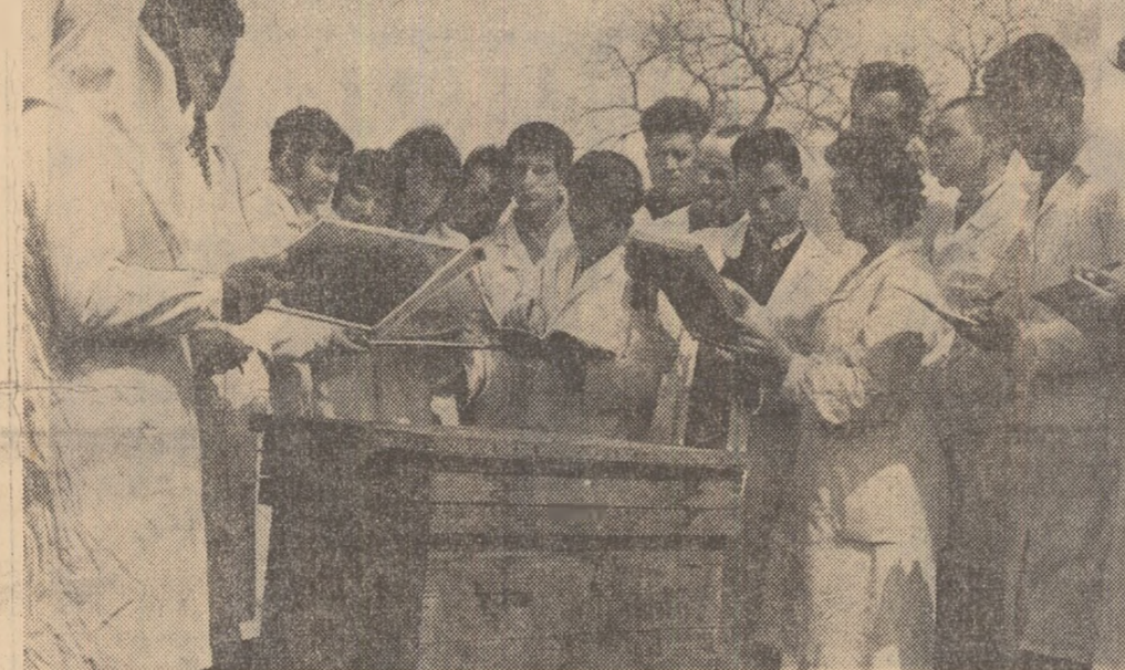
O imagine de la Centrul școlar agricol din comuna Malu Mare, regiunea Oltenia. Lucrare practică în stupina școlii cu elevii anului III. Cei aproape 400 de elevi ai acestei școli, veniți din toată regiunea, se pregătesc pentru a deveni buni tehnicieni veterinari.

Etapa a doua a concursului este deschisă pînă la data de 23 August 1963 și va fi dotată cu numeroase premii constînd în obiecte, excursii în țară și în străinătate.