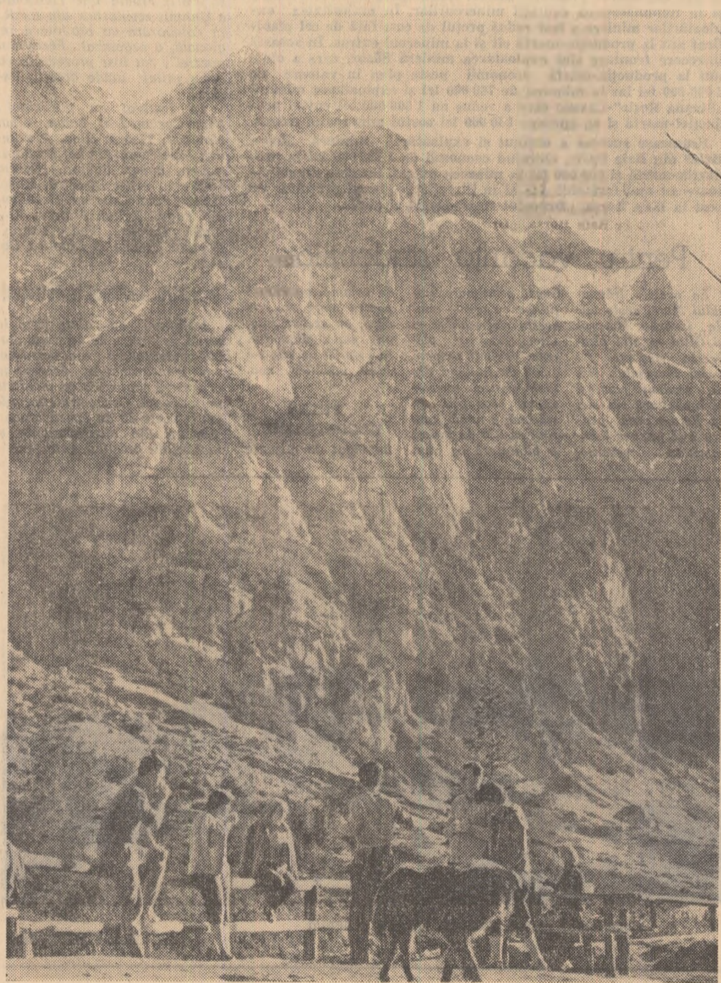
În drum spre Omul, popas la cabana Măldăști

Am văzut în planul comitetului U.T.M. de la „Tractorul” referiri precise la contribuția pe care o pot aduce la buna desfășurare a unei excursii cercurile artistice, plasticienii, poezii și prozatorii, prietenii muzicii. Și, mai ales, fotografiile amatori. Se preconizează inițierea unui concurs de fotografii. Lucrările vor fi apoi expuse într-o expoziție organizată la întoarcere. Întreaga excursie este recapitulată apoi, în sensul că impresiile produse, cunoștințelor cu care i-a îmbogățit pe tineri sînt un material prețios pentru cel puțin două serii culturale-distractive! Mulți tineri vor lua parte la programul cultural al acestor serii, povestindu-și impresiile din excursii, adică făcînd în fața tovarășilor lor un fel de scurte note de călătorie prin regiune sau prin țară. Asemenea „recapitulări” instructive vor avea loc la „Tractorul” după excursiile la Bran și Sibiu, Frumusețile naturale ale unei părți a patriei noastre, importanța istorică a unor locuri, datele științifice despre o anumită zonă — sînt aspecte de care se ține în primul rînd seama în organizarea, desfășurarea și apoi reconstituirea prin concurs a excursiilor.