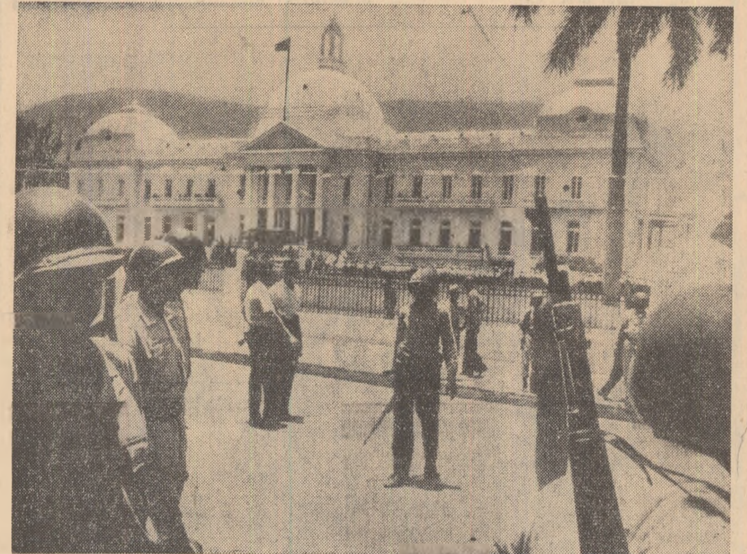
În urma instaurării stărilor de asediu la Port-au-Prince organele de poliție și siguranță intensifică teroarea împotriva adversarilor regimului de dictatură al președintelui Duvalier. În fotografie: Poliștii în fața palatului prezidențial de la Port-au-Prince.