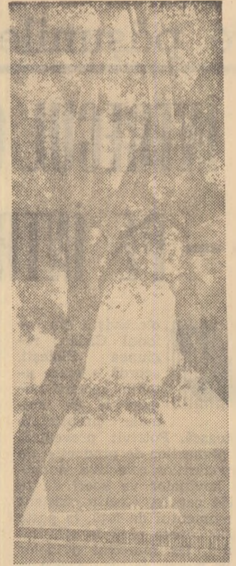
Vedere de la Constanța

Idea ce urmează a fi demonstrată trebuie să fie clară în mîntea celui ce ne scrie și la fel, clar, faptele pe care are de gînd să ni le povestească. Trîmîndu-ne portretul mine-