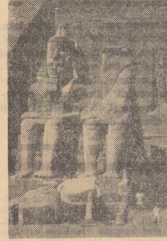
Specialiștii au propus pentru salvarea străvechului edificiu egiptean Abu Simbel din raza barajului înalt de la Assuan acoperirea sa cu un clopot de sticlă.

La München a fost deschis un „Muzeu al berii”. El dispune de tot felul de relice istorice în legătură cu prepararea berii, care în Bavaria este considerată o artă. Printre acestea se numără și cartă din 1372, care dădea cetățenilor din acest oraș dreptul