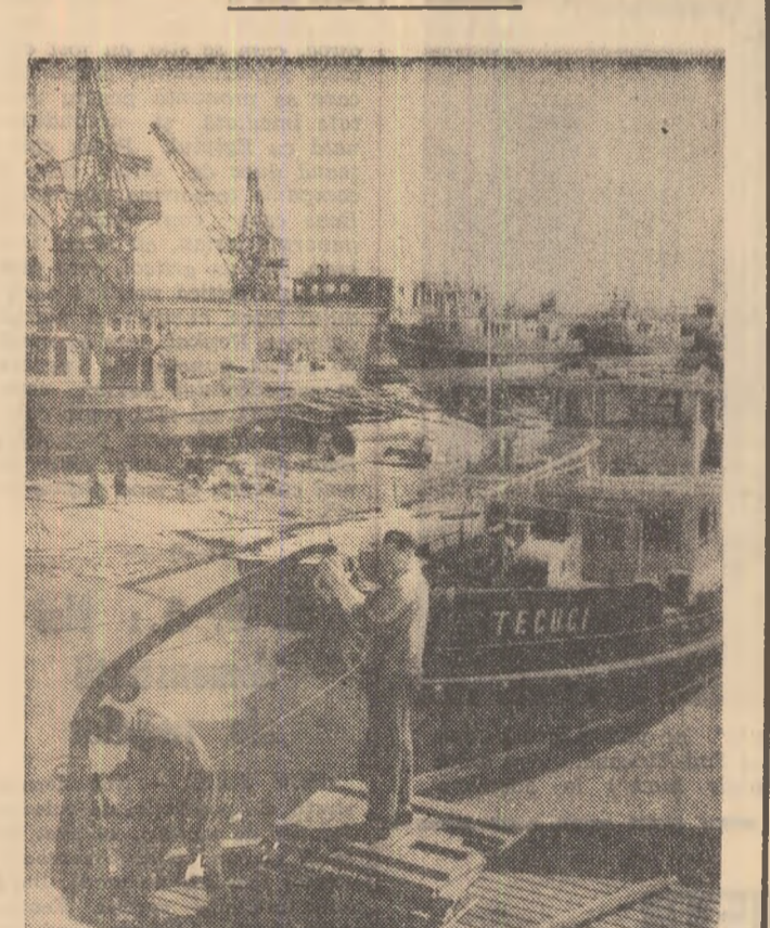
Santierul naval Oltenița și-a îndeplinit planul de producție pe luna aprilie în proporție de 100,8 la sută. În fotografie: vedere generală a santierului.

Simbătă la amiază, în sala de marmură a Casei Științei, s-au încheiat lucrările celei de-a IV-a Conferințe naționale de stomatologie organizată de Uniunea Societăților de științe medicale din R. P. Română.