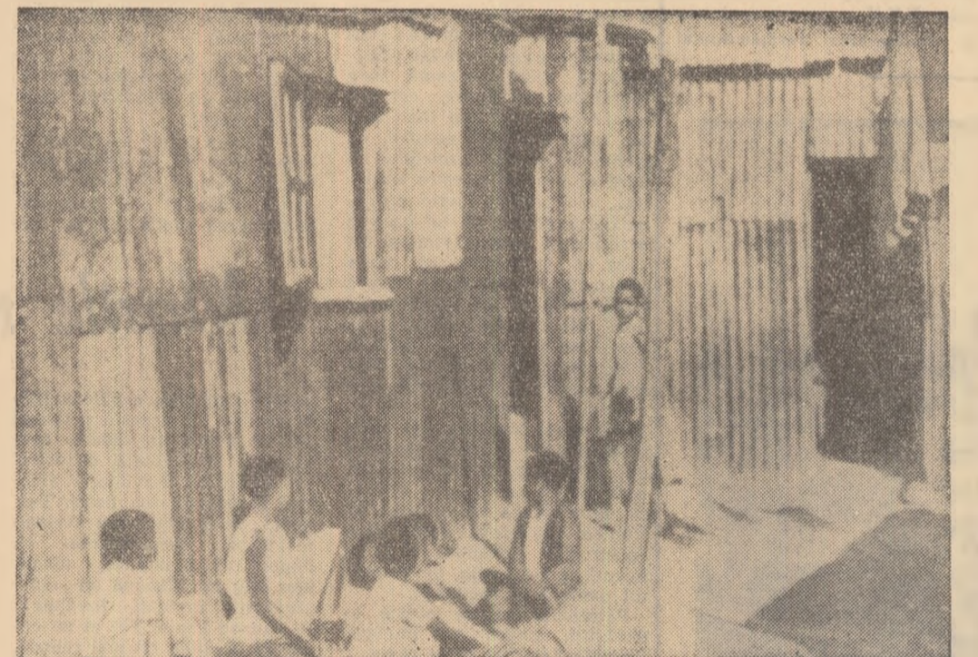
Din această fotografie reprodusă din ziarul britanic „The Observer” ne putem face o idee despre condițiile de locuit ale populației de culoare din Republica Sud-Africană. Așa arată o „locuință” (pe care „The Observer” o califică „una din locuințele bune”) la Edendale

În fotografia noastră: aspect de la o demonstrație de masă a țăranilor vest-germani împotriva politicii agrare a Pieței comune și a guvernului de la Bonn.