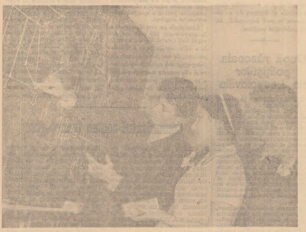
După ora de matematică, elevii ai clasei a X-a D de la Școala medie nr. 2 din Ploiești, recapitulează cunoștințele predate în oră.

fonie pînă la Beethoven”) și vine pentru a împlini mișcările menieră educativă, vor corespunde mai bine nevoilor educative numai după apariția unei serii de asemenea lucrări, de broșuri elaborate într-o ordine judicioasă din punct de vedere pedagogic. (Ciclul celor cîteva lecții ținute în cadrul Universității Bucureștene de educație muzicală, difuzate zilele acestea de către această instituție, ar putea servi bineînțeles ca bază pentru publicarea de către Editură a unui ciclu de lucrări de inițiere care să fie introduse în cadrul colecției „Muzica pentru toți” prin decongestionarea planului editorial de unele lucrări care nu sînt deosebit de necesare).