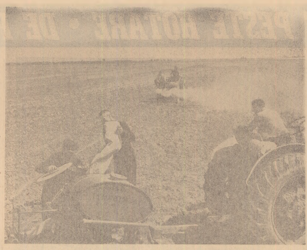
Mecanzatorii de la S.M.T. Târtășești, raionul Râcari, regiunea București, împreună cu artiștii ai G.A.C. „Drumul belșugului” din comuna Brezoaie.