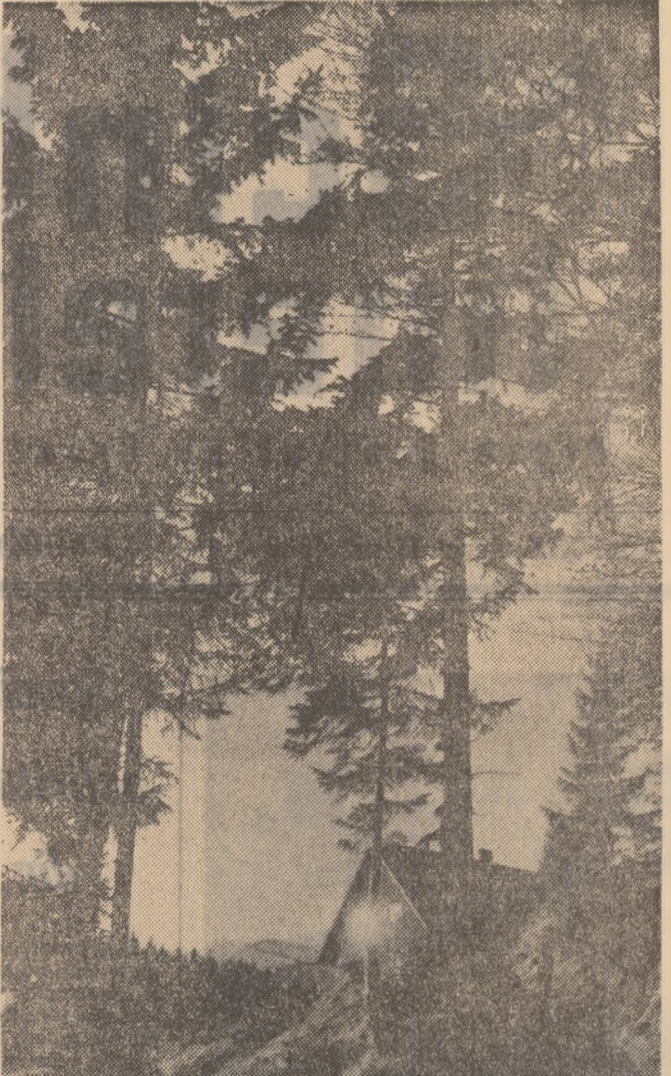
Cabana Diham din munții Bucegi