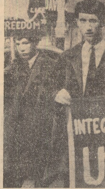
Opinia publică internațională condamnă represuniile împotriva populației de culoare din sudul S.U.A. În fotografie: tineretul din Londra se îndreaptă spre ambasada S.U.A. purtând pancarte cu inscripții împotriva represuniilor din Alabama.

NEW YORK. — La New York a fost anunțată plecarea în R.A.U., Yemen, Arabia Saudită și Irak a misiunii speciale a Comitetului O.N.U. pentru examinarea problemei aplicării Declarației cu privire la acordarea independenței țărilor și popoarelor coloniale pentru a avea în vedere și oficialități și refugiați de pe teritoriul Adenului, în scopul analizării situației din acest teritoriu.