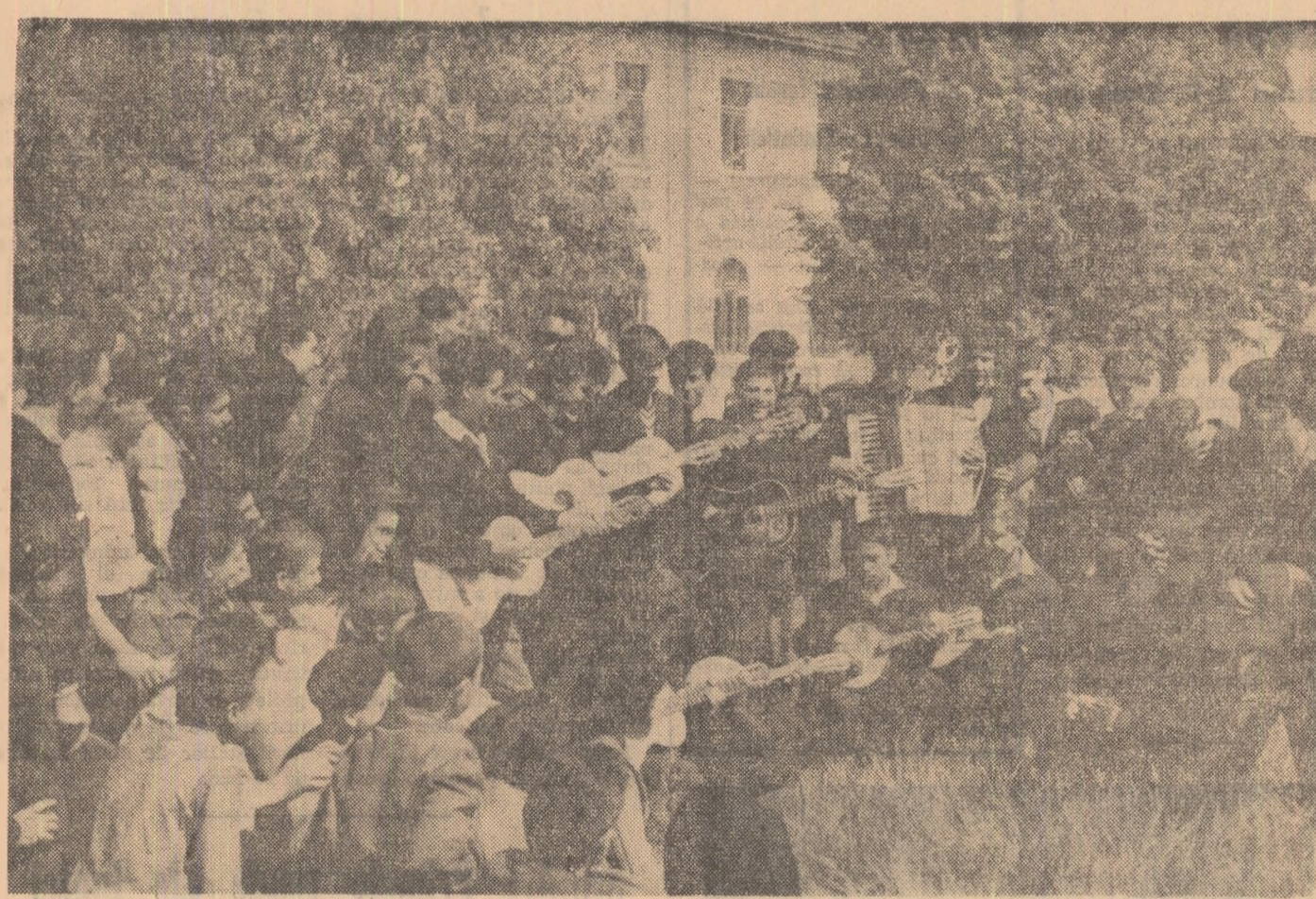
Spectacol muzical in aer liber prezentat de elevii grupuluișcolar petrol-chimie din Brăila.