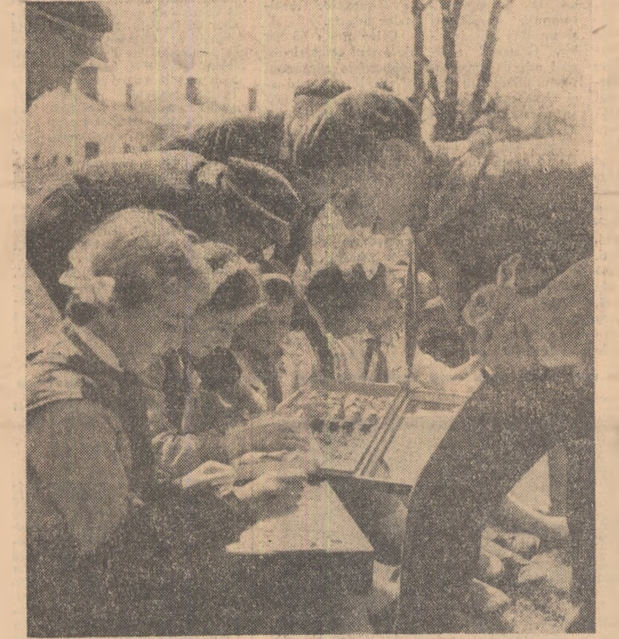
Micii naturaliști se află în plină activitate. Ei pregătesc cu grijă material pentru colțul viu al școlii.