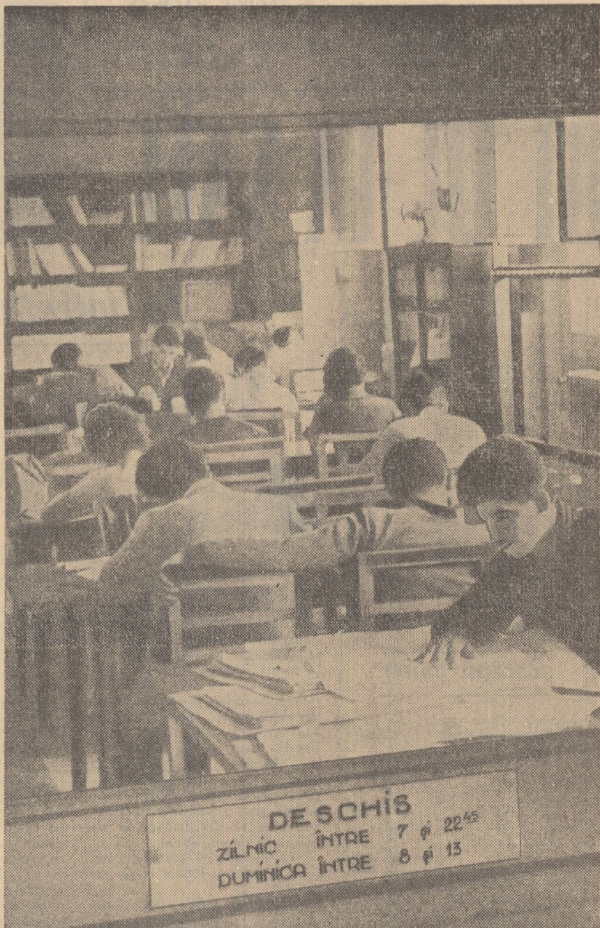
Ssst! Să nu-i deranjăm! Viitorii ingineri agronomi se pregătesc pentru examene