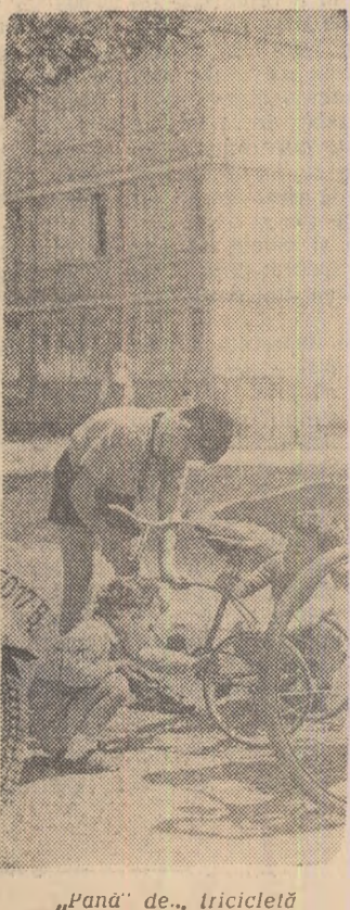
„Panda” de... tricoloră