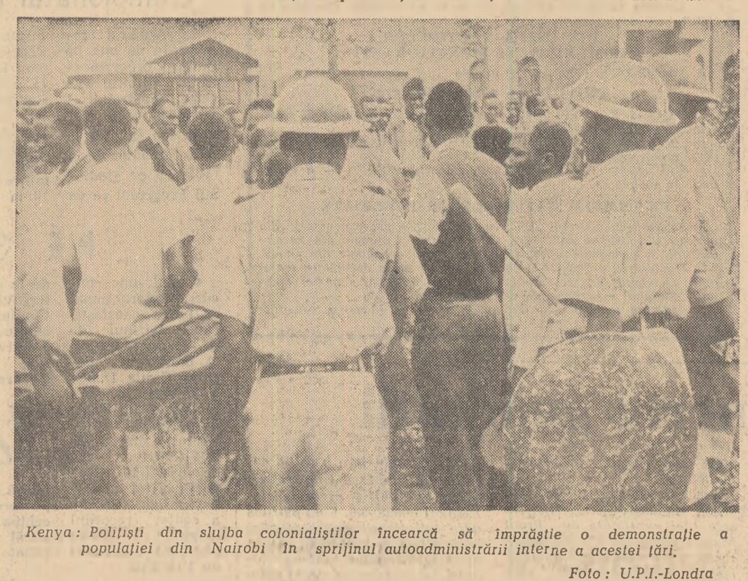
Kenya: Poliști din slujba colonialiștilor încearcă să împrăști o demonstrație a populației din Nairobi în sprijinul autoadministrării interne a acestei țări.

Răspunzînd la interpelările membrilor Camerei Comunelor, primul ministru Macmillan a căutat să convingă că guvernul englez „folosește toate mijloacele posibile în vederea realizării unui acord” cu privire la interzicerea experiențelor cu arma nucleară.