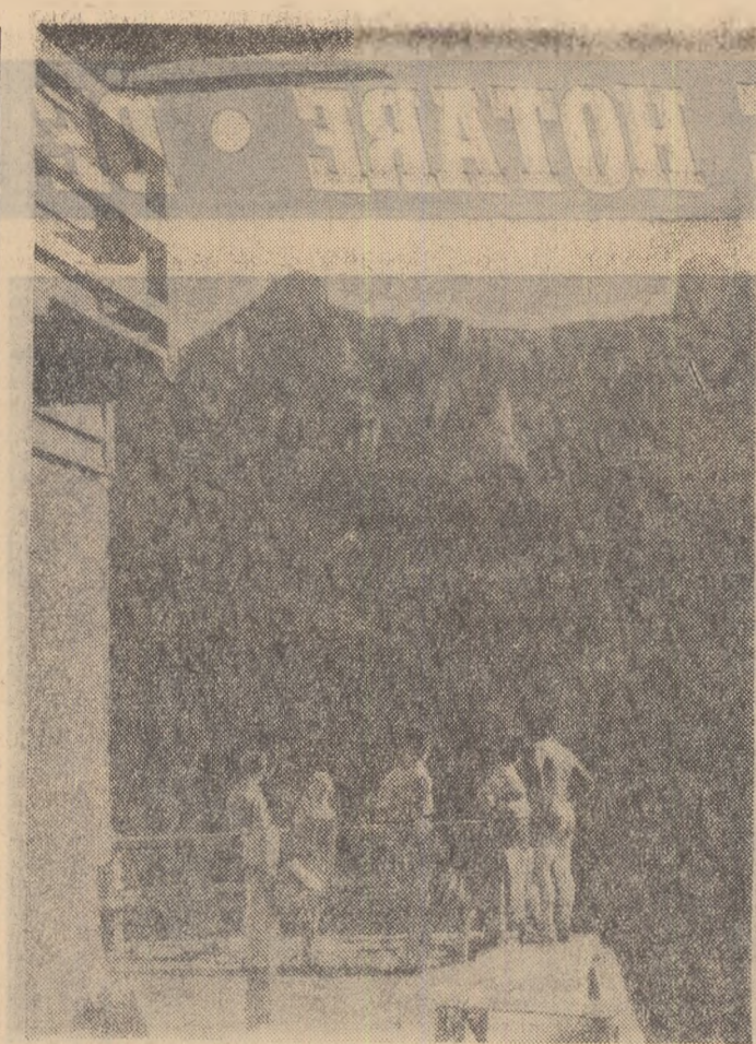
Crestea Ceahlăului văzută de la cabana „7 Noiembrie”