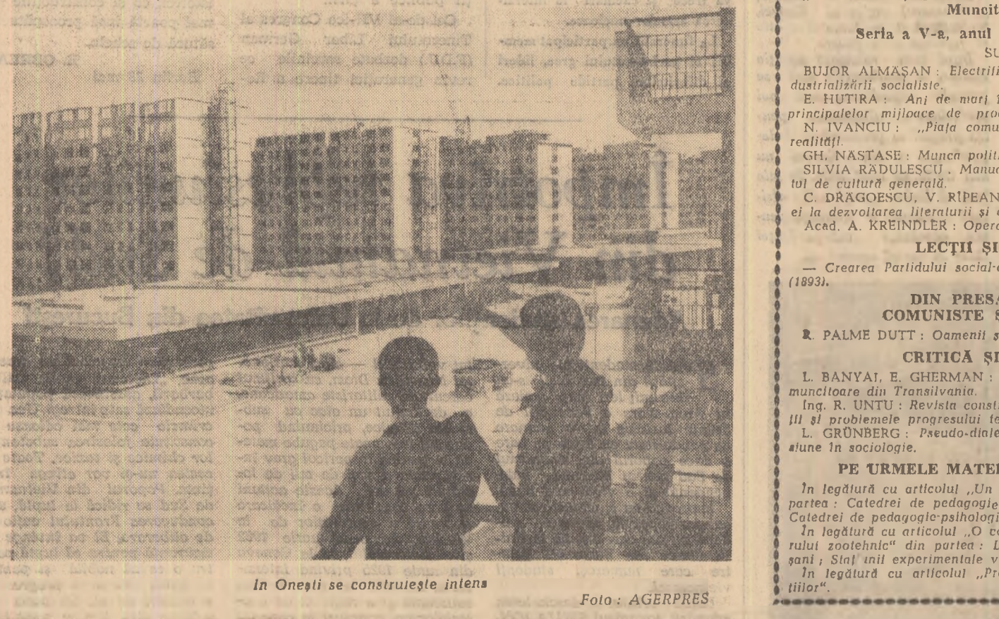
În Onești se construiește intens