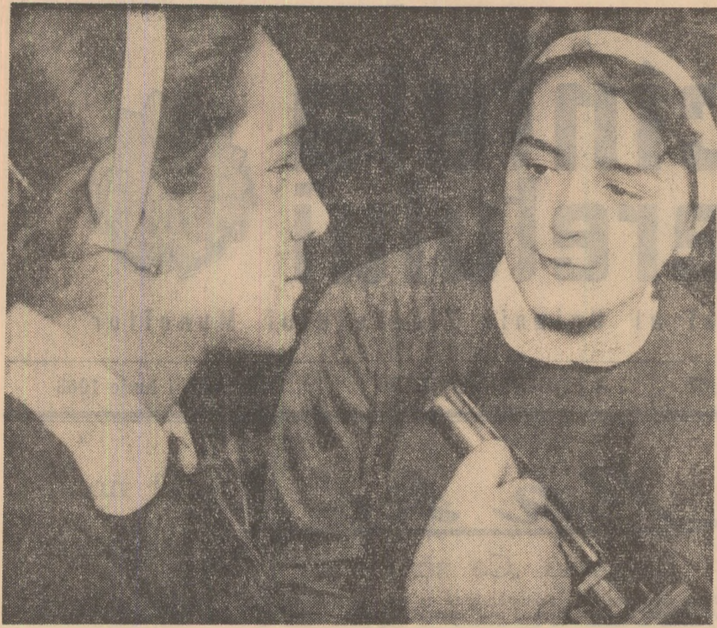
La ora de fizică, în laboratorul Școlii medii nr. 2 din Pitești.