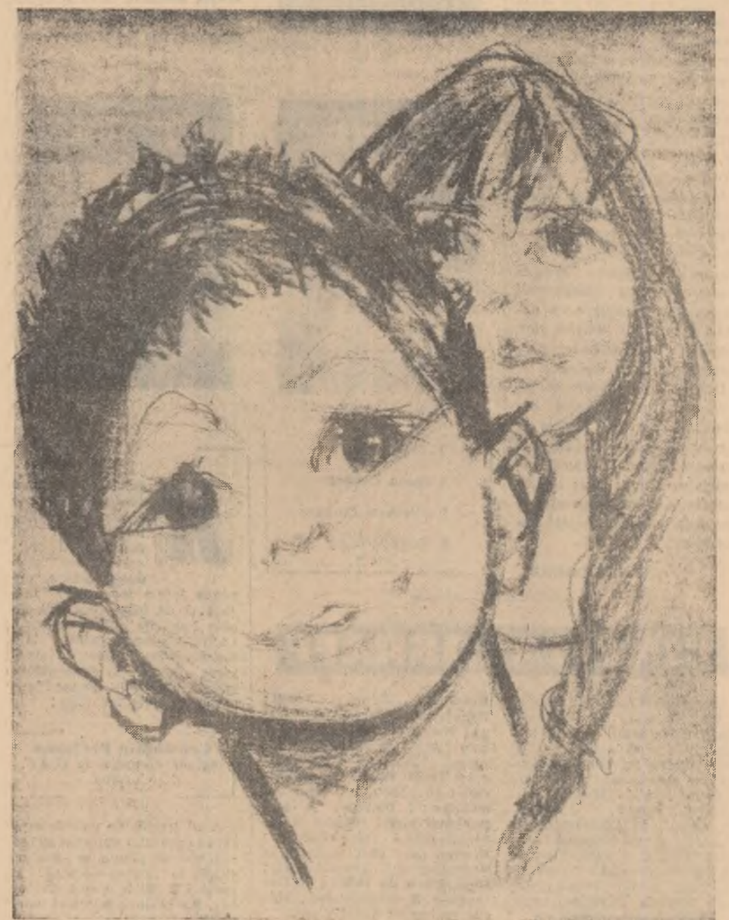
Desen de TIA PELTZ

La întrebarea „unde merg tinerii sîmbătă seara” răspunsurile sînt numeroase, începînd cu spectacolele de teatru și sîrșind, de pildă, cu o simplă plimbare prin parc. Dar la întrebare mulți dintre tineri răspund: „la dans”. Cunoșcînd această firescă formă de petrecere a timpului liber de către tinerii citiva reporterii ai noștri și-au propus să-i urmeze într-o călătorie de-a lungul seții culturale-distractive. Publicăm în paginile 2 și 3 însemnări din acest raid.