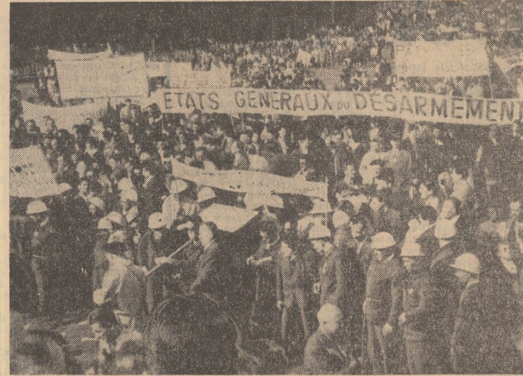
PARIS. Aspect de la puternica manifestație a „Statelor generale pentru dezarmare“, la care au participat zeci de mii de francezi.

Stirea privind sosirea membrilor „Corpului păcii“ a stîrnit vii proteste în întreaga țară. Partidele politice, organizațiile sindicale, țărănești, de tineret și de femei din Kalimantan, Sumatra și alte insule, întreaga opinie publică progresistă din Indonezia, au luat o atitudine hotărîtă împotriva „Corpului păcii“ american.